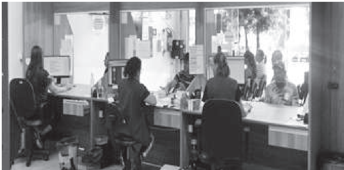
Em média, seis mil usuários foram atendidos por mês na Farmácia Municipal

A audiência pública do Conselho Municipal de Saúde de Três de Maio, realizada na semana passada, apresentou os números dos atendimentos prestados pelas oito Estratégias de Saúde da Família (ESF) no município. No último ano, as unidades realizaram um total de 28.130 atendimentos.