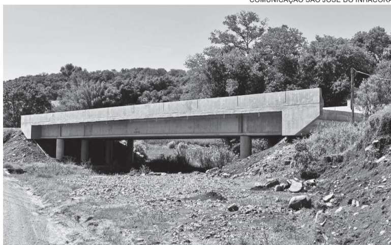
Para a conclusão da obra restam as cabeceiras da ponte

A ponte é uma obra de responsabilidade do Estado do Rio Grande do Sul e vem sendo construída pela empresa Engedal, vencedora do processo licitatório. O período de construção é de cerca de oito meses, restando apenas a conclusão das cabe-