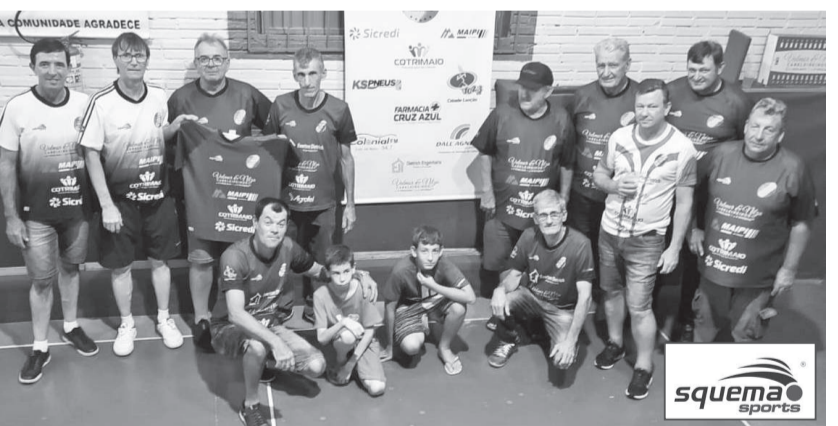
Equipe de Santo Antônio Consolata venceu o primeiro jogo das semifinais contra Bela Vista