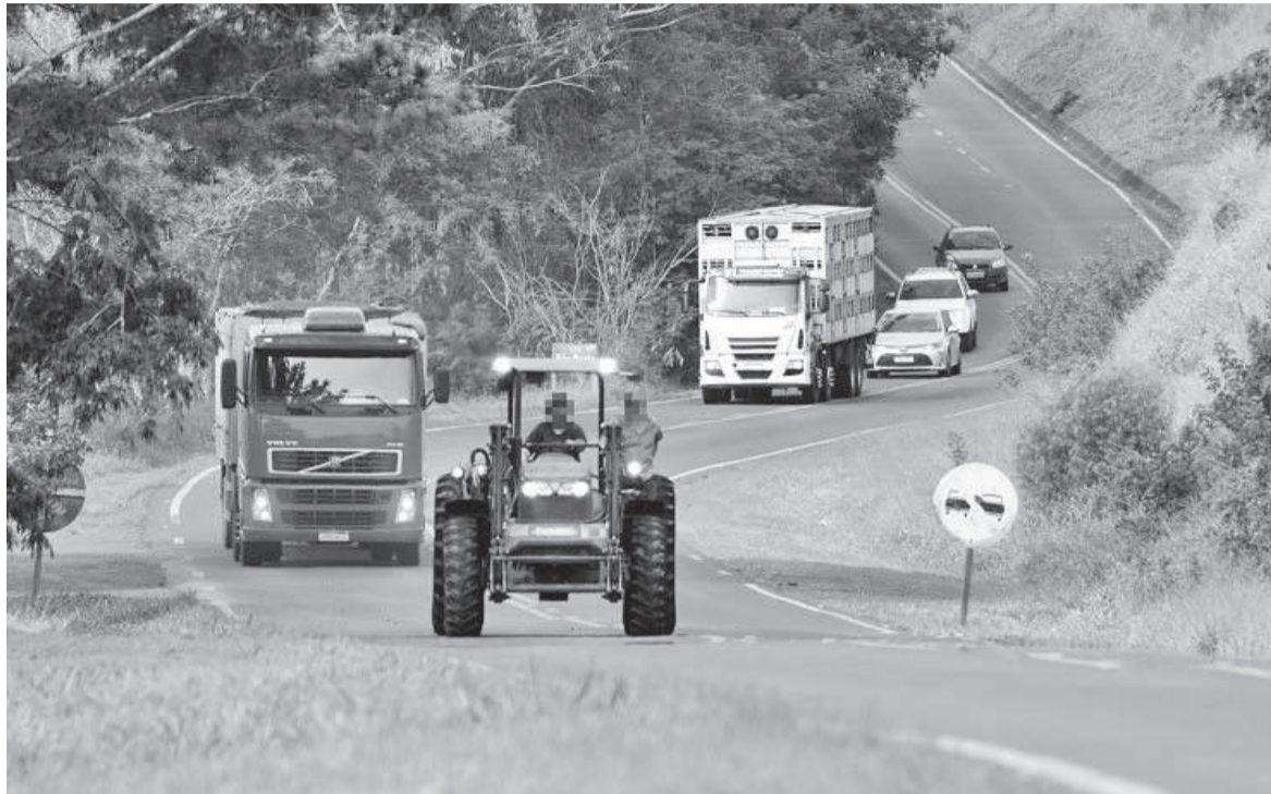
Tratores com até 3,20 metros podem circular sem Autorização Especial de Trânsito, desde que não invadam a faixa contrária, e transitem apenas durante o dia, em condições favoráveis de visibilidade

Desde o início do ano, o trânsito de máquinas agrícolas tem novas, conforme Resolução nº 1.017/2024 do Conselho Nacional de Trânsito (Contran). A medida visa atender uma antiga demanda do setor, minimizando os riscos de acidentes e promovendo uma convivência mais segura entre máquinas agrícolas e veículos.