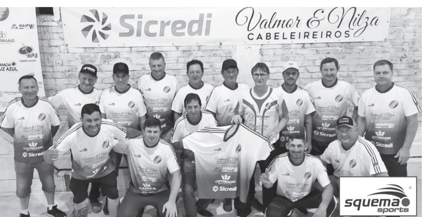
Equipe de Bela Vista joga em casa em busca da vaga na final do campeonato