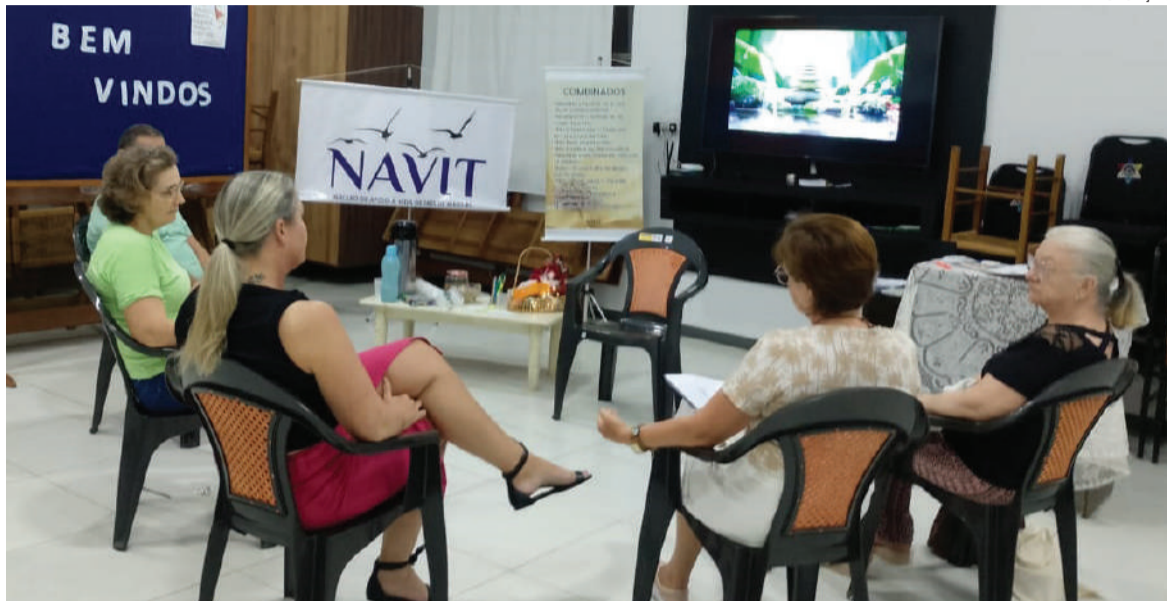
Voluntários do Navit estão à disposição das pessoas que buscam por apoio