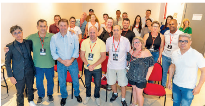
Primeiro congresso, realizado no último sábado em Erechim, reuniu representantes de 24 jornais do Sul do país

O Jornal Semanal integra a Associação dos Jornais do Sul (AJS), que abrange veículos de comunicação impressa do Rio Grande do Sul, Santa Catarina e Paraná. Com 24 jornais associados, atingem cerca de 150 cidades, com mais de 450 mil jornais impressos por mês, com a missão de levar informação e conteúdo de qualidade e confiabilidade / Caderno S