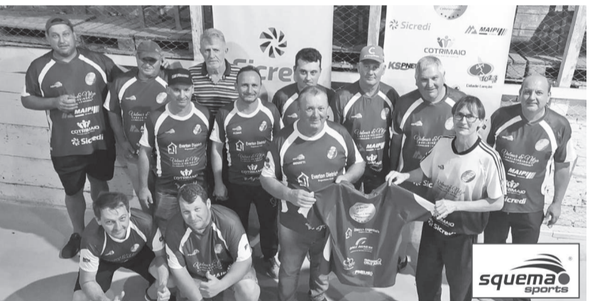
Equipe de Esquina Bado faz seu primeiro jogo da fase de semifinais hoje à noite