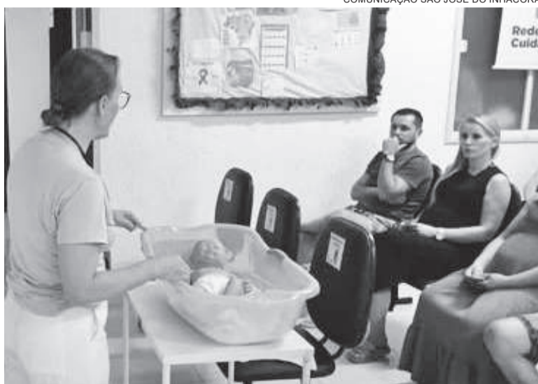
Encontro abordou temas relacionados ao puerpério e ao recém-nascido

O programa segue as diretrizes da Organização Mundial da Saúde e do Ministério da Saúde em relação à assistência ao pré-natal, puerpério, puericultura e planejamento sexual e reprodutivo, alinhando-se às Políticas Estaduais de Saúde da Mulher, do