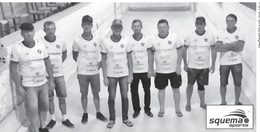
Equipe da comunidade de Manchinha faz o primeiro confronto das semifinais hoje