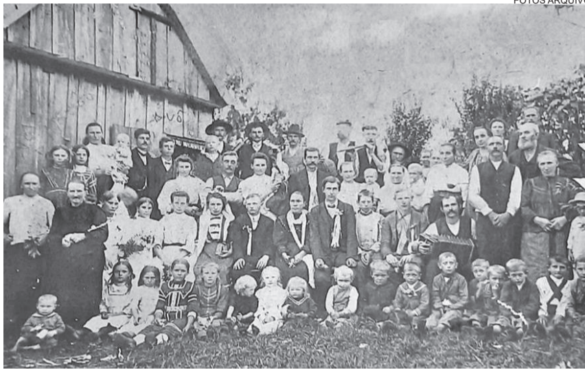
Moradores reunidos em frente à primeira igreja luterana de Flor de Maio

A partir daí, outras famílias de origem alemã que paravam para pernoitar no lugar, conversando com esse comerciante, acabavam não encontrando motivos para seguir adiante, já que, na nova colônia que estava surgindo além do Rio Santa Rosa, o governo estava priorizando e dando apoio e trabalho apenas aos colonos nacionais, diferentemente do que havia ocorrido nas