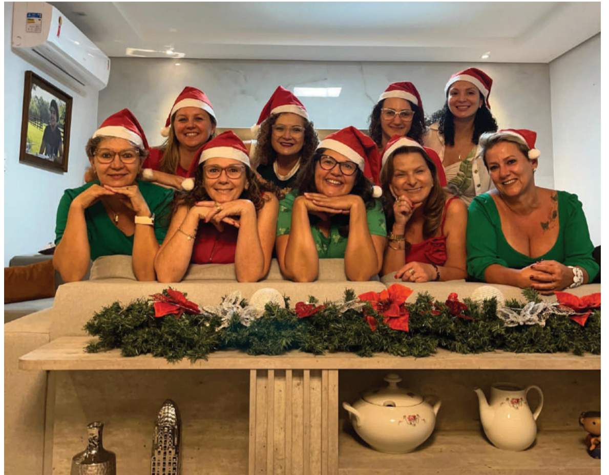
Na confraternização de fim de ano, um registro especial para eternizar o momento

A história começou há cerca de 14 anos, após o término de outro grupo, que reuniu algumas das integrantes por mais de uma década. Das amigas que faziam parte desse primeiro grupo -