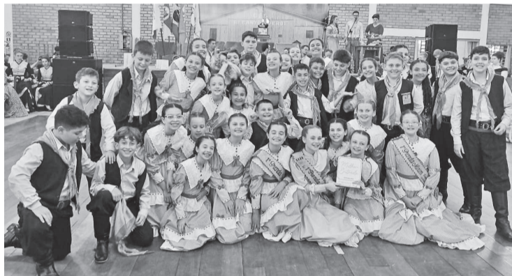
Invernada Mirim do CTG Tropeiros do Buricá