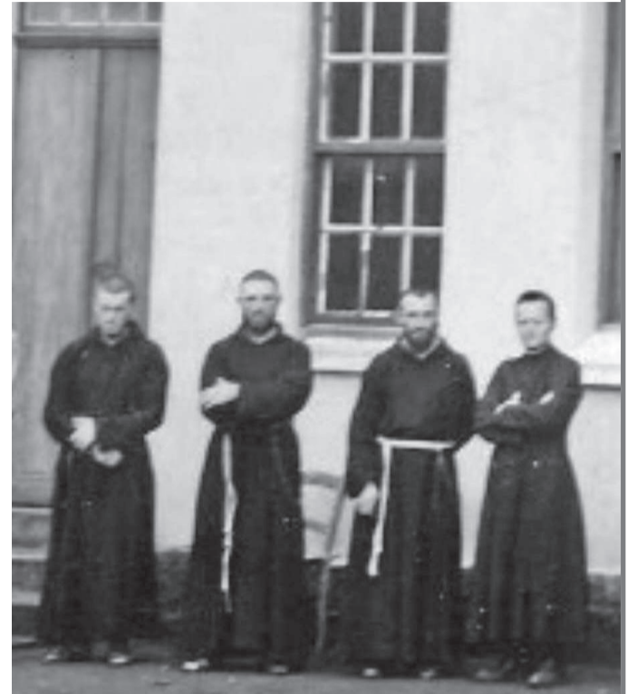
Freis capuchinhos de Três de Maio em frente à residência Medianeira, situada na antiga propriedade que hoje compõe boa parte do Bairro São Francisco