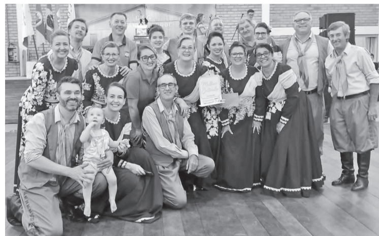
Invernada Xiru do CTG Tropeiros do Buricá