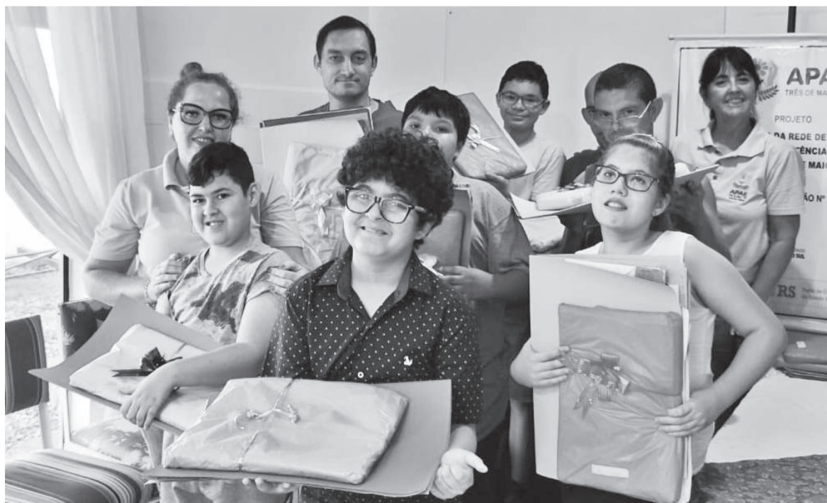
Alunos das oficinas de arteterapia, do turno da tarde

Durante o encerramento do projeto, os alunos compartilharam depoimentos sobre as