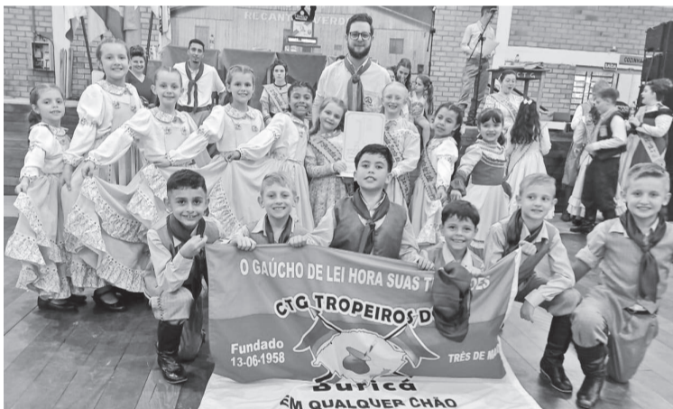
Invernada Pré-Mirim do CTG Tropeiros do Buricá