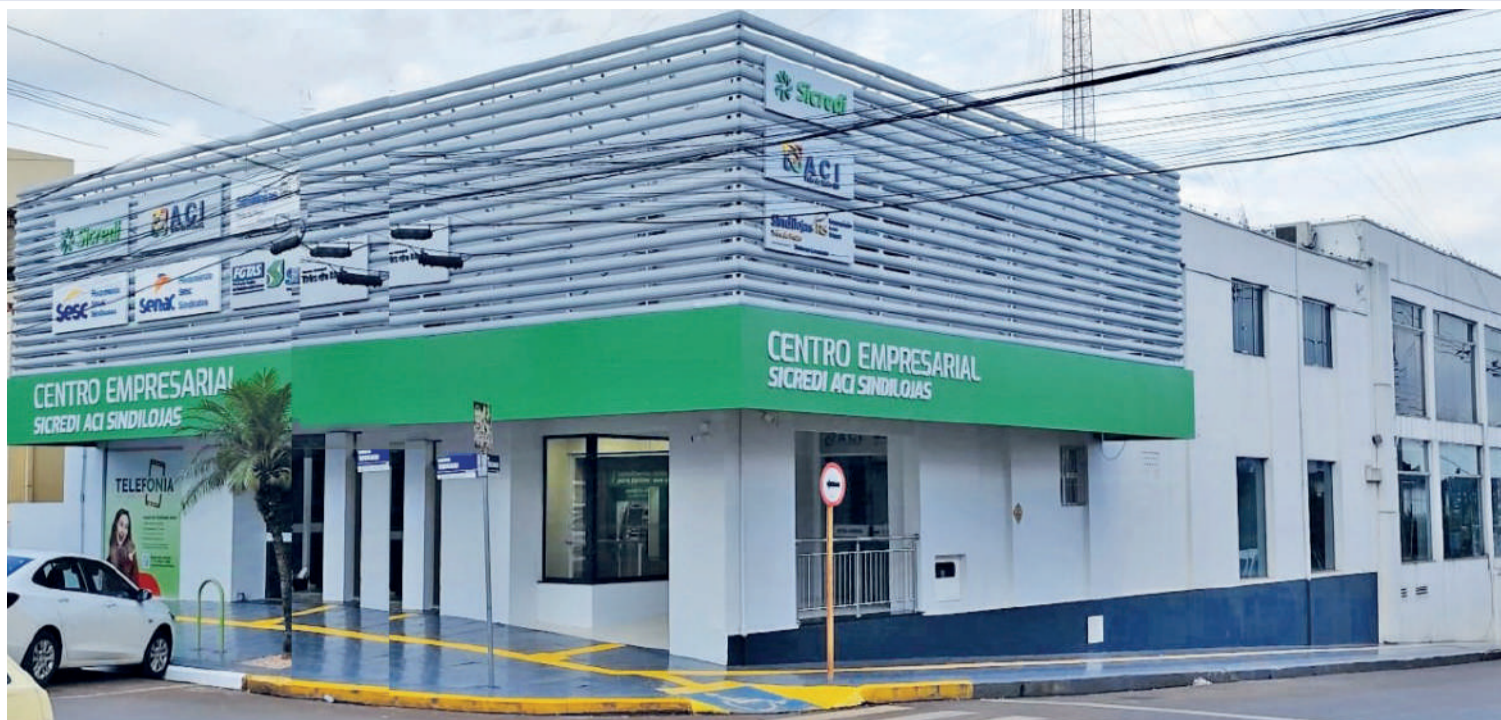
O Centro Empresarial Sicredi ACI Sindilojas, localizado na Avenida Uruguai, nº 366, Centro, Três de Maio, proporciona um ambiente de negócios dinâmico e multifuncional, ideal para empresas e profissionais de diversos setores, tanto locais quanto regionais