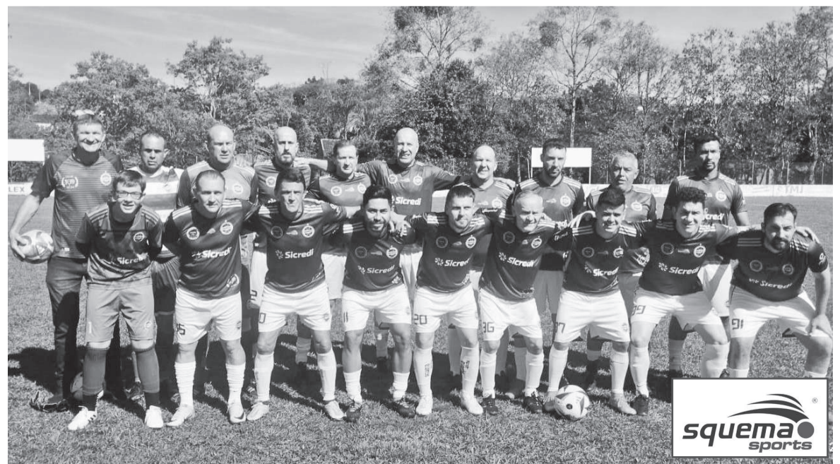
Veteranos do Oriental FC

No registro abaixo, alguns integrantes e atletas dos veteranos que hoje faz o Oriental acontecer, juntamente com as suas categorias de base.