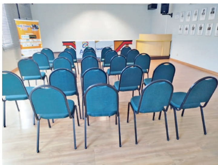
Auditório para eventos corporativos e encontros empresariais