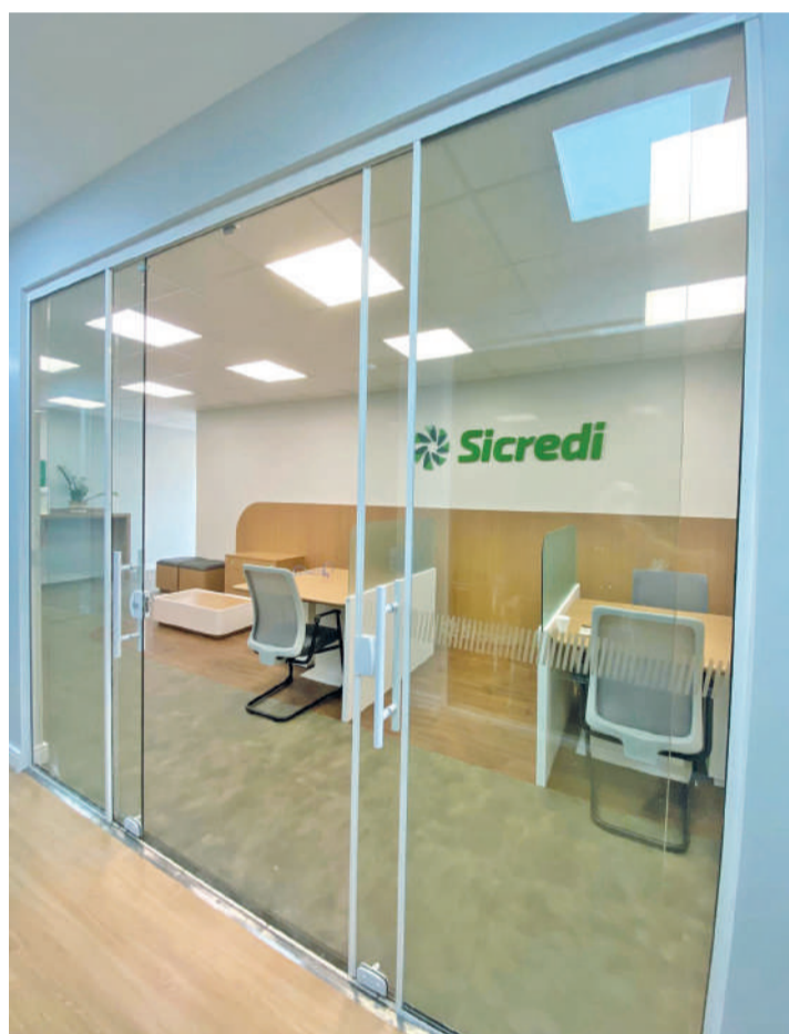
Escritório de Negócios do Sicredi