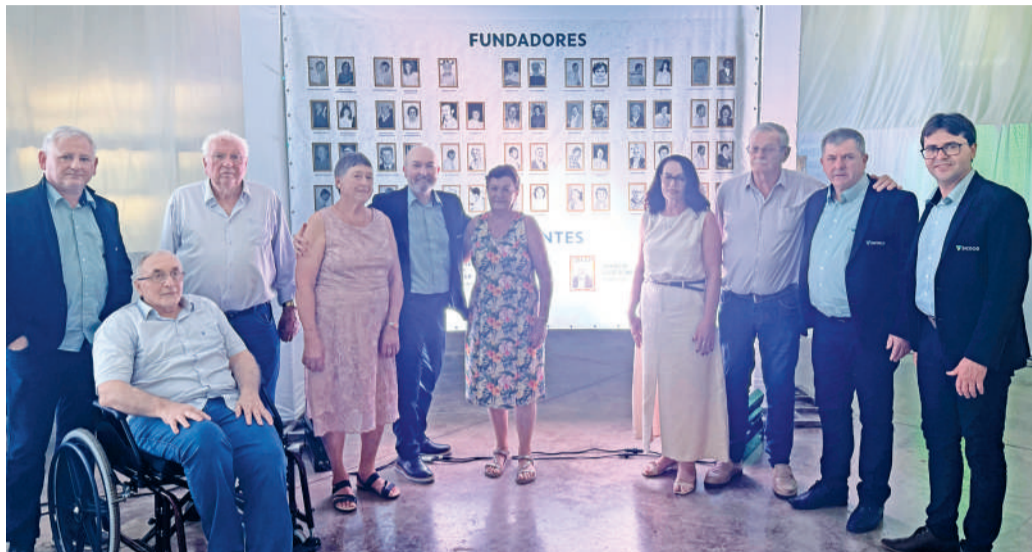
Painel teve inserção da imagem das esposas dos sócios fundadores, valorizando a mulher fundadora