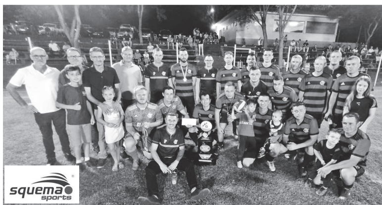
Flamengo foi vice-campeão do 5º Campeonato de Futebol 7