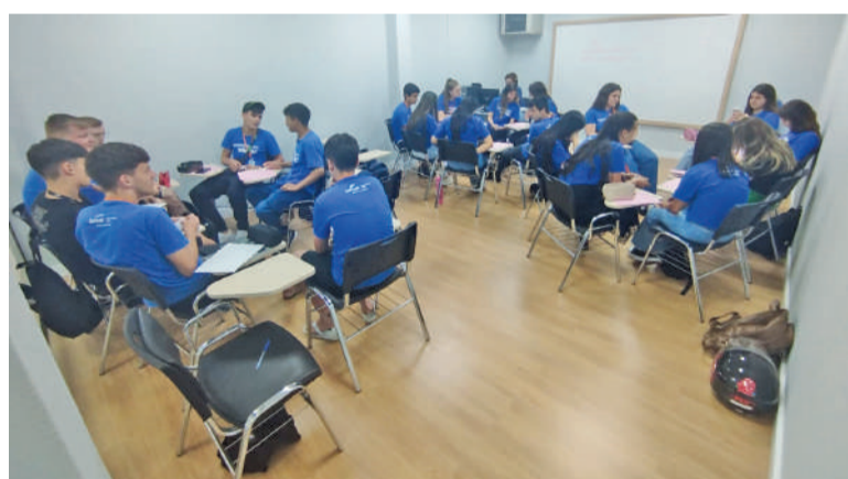
Sala do SENAC/SESC