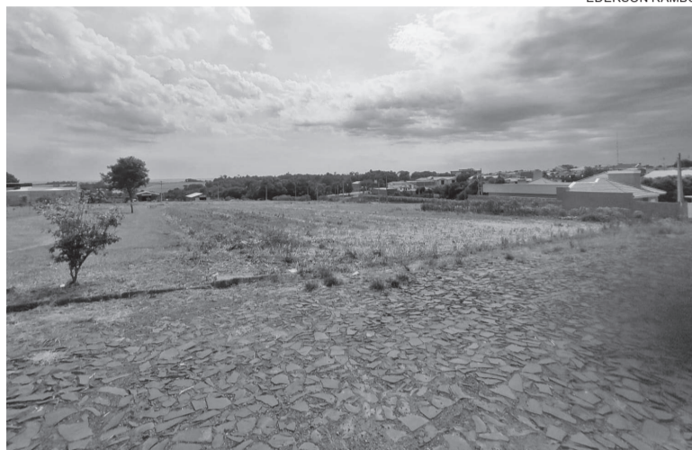
Centro será instalado ao lado do Memorial Saúde, no bairro Planalto