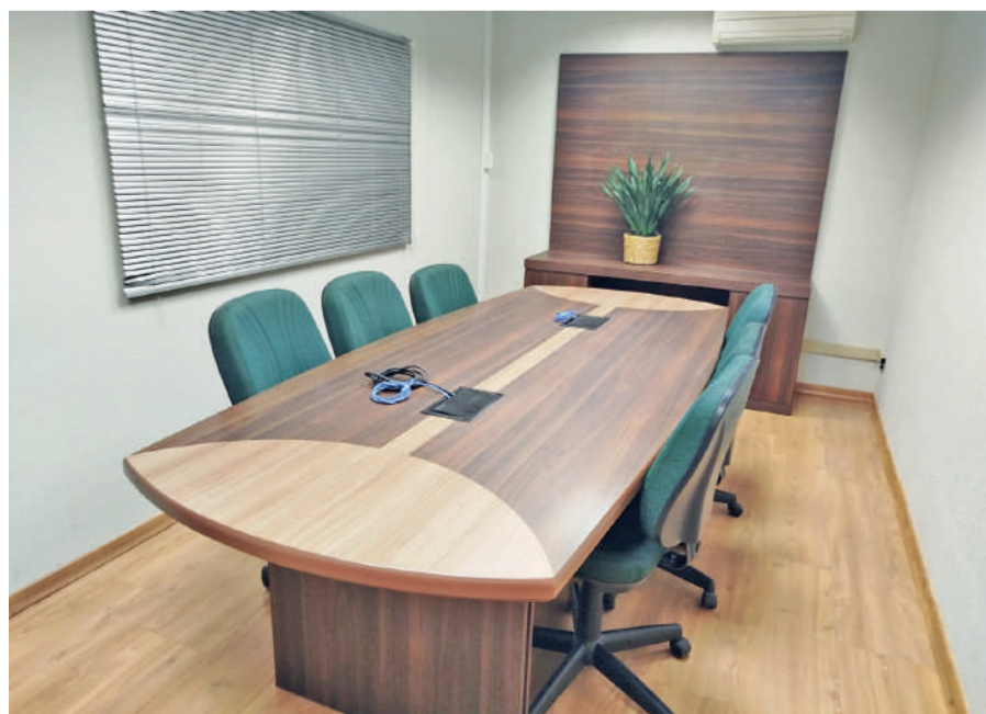
Sala de reuniões