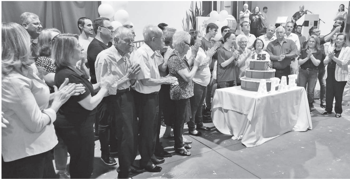
A comemoração contou com fundadores, ex-presidentes e seus familiares

A APAE de Três de Maio celebrou seus 55 anos em uma solenidade realizada na terça-feira, 29 de outubro, que reuniu autoridades, amigos, empresários, colaboradores e convidados. Durante o evento, foi exibido um vídeo com depoimentos de ex-presidentes, que compartilharam momentos importantes da trajetória da entidade.