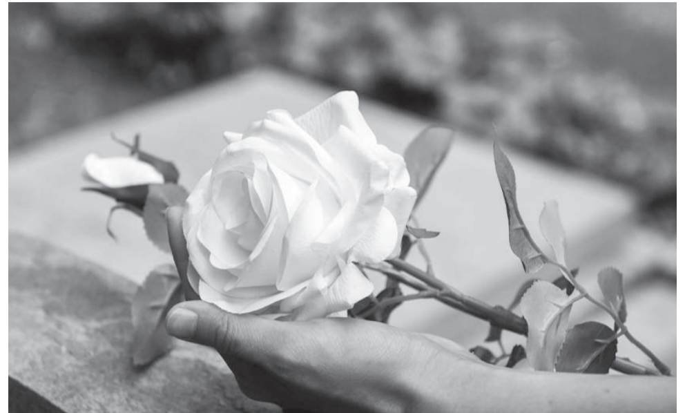
Quando o processo de luto se estende por longos períodos, não permitindo que a pessoa enlutada restabeleça sua vida de maneira saudável e produtiva, é considerado um transtorno pela OMS