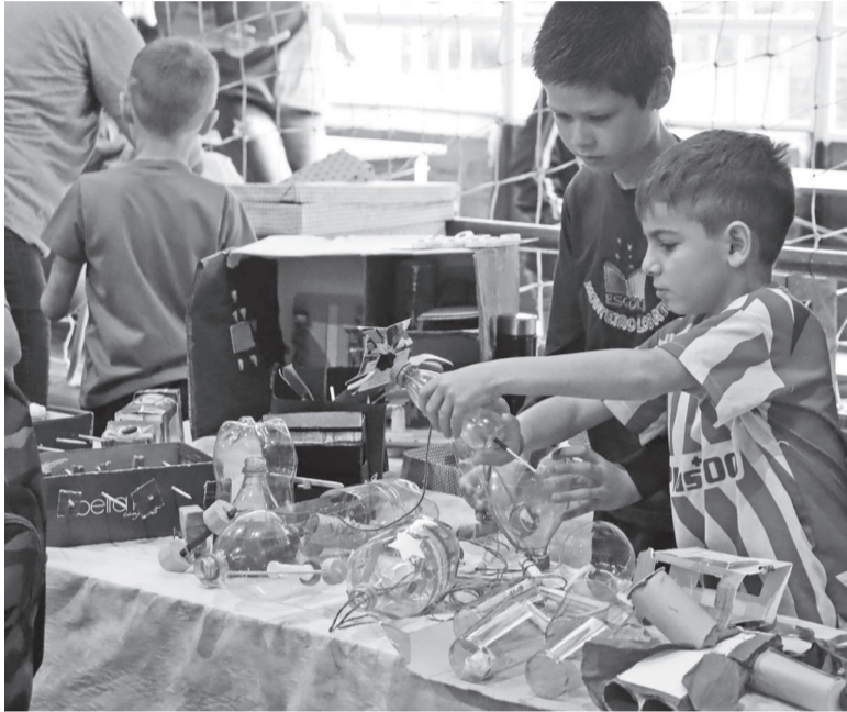
Feira reúne estudantes do Ensino Fundamental. Registro é da edição de 2023

Na próxima terça-feira, dia 5, ocorre a 3ª Feira de Educação Empreendedora, através do Governo Municipal de Três de Maio, por meio de uma parceria entre a Secretaria de Educação, Cultura e Esporte (SMECE) e o Sebrae.