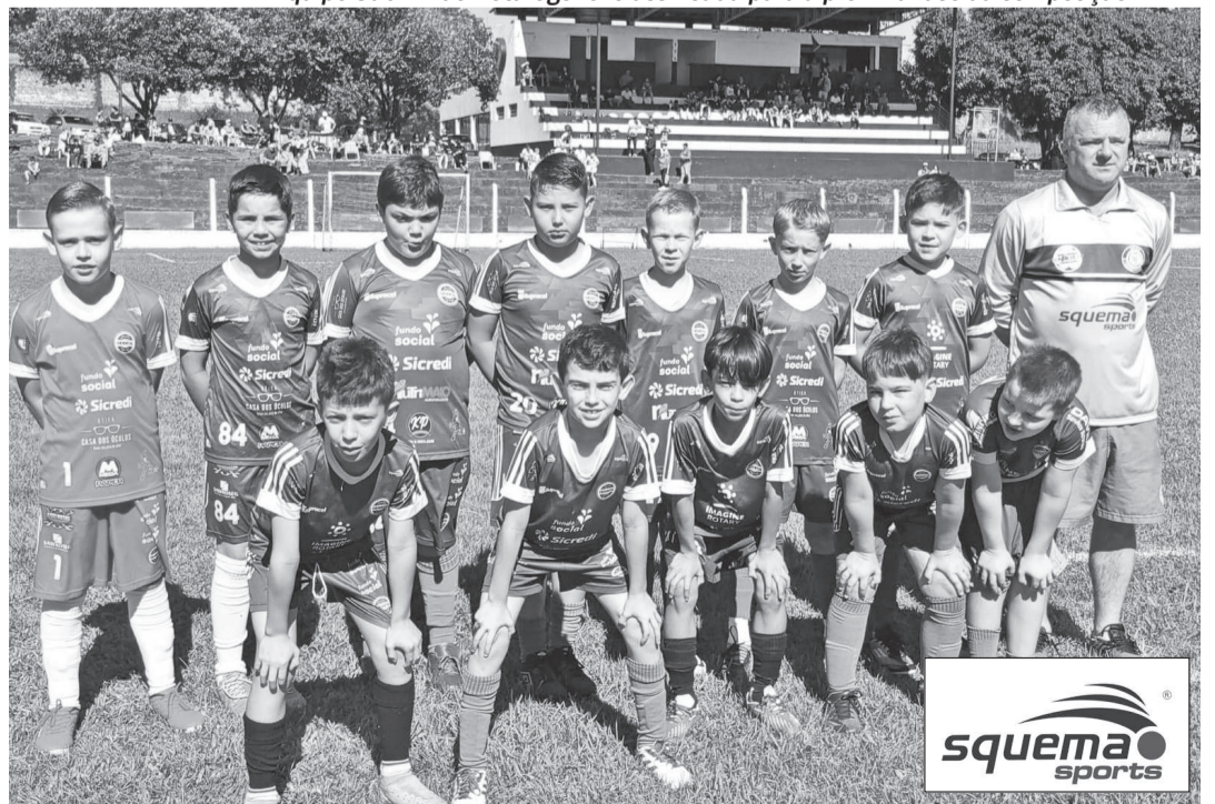
Próxima fase da Taça Sicredi terá a equipe Sub-9 do Oriental entre os classificadas