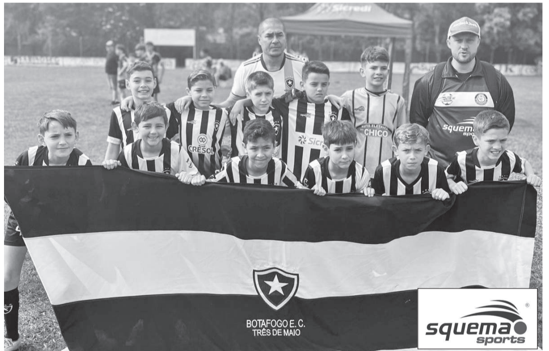
Equipe Sub-11 do Botafogo foi classificada para a próxima fase da competição

Sub-15: Botafogo, Mancha Verde e Oriental