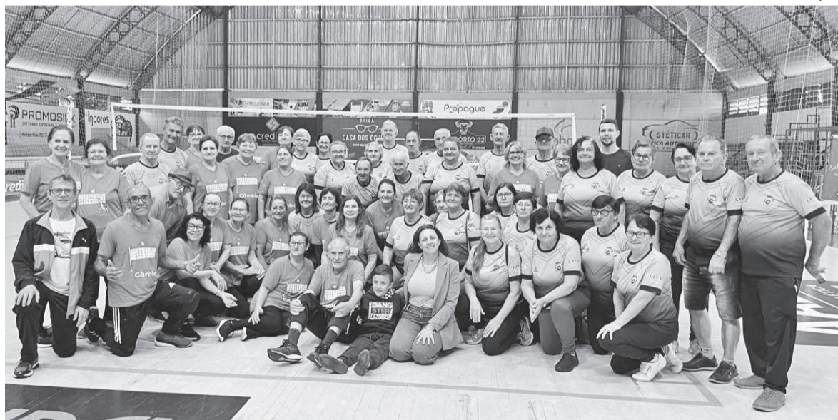
Integrantes do Grupo de Câmbio Saber Viver de Três de Maio se reúnem três vezes por semana no Ginásio da AABB

O Grupo de Câmbio Saber Viver de Três de Maio surgiu com o objetivo de atender o anseio da terceira idade. Os integrantes buscam manter a saúde e a qualidade de vida em um esporte que tem ganho cada vez mais espaço na cidade e região.