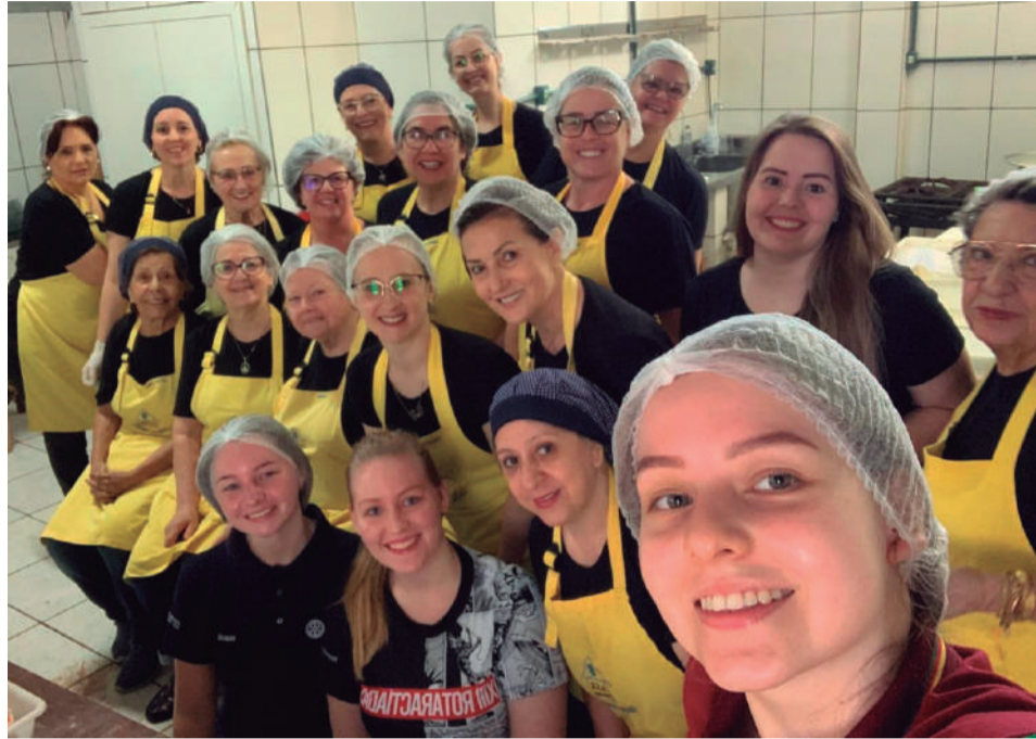
Integrantes da Casa da Amizade e do Rotaract que prepararam as saladas

No último domingo, foi realizada mais uma edição do tradicional Costelão do Rotary, que reuniu 600 pessoas no Parque de Exposições Germano Dockhorn de Três de Maio. Em sua 24ª edição, o evento novamente contou com a dedicação das senhoras da Casa de Amizade, no preparo das deliciosas saladas servidas no almoço. O preparo dos 35 costelões ficou a cargo dos rotarianos. Os recursos arrecadados serão destinados a projetos sociais. A família rotária agradece a presença de todos e já anuncia o próximo evento: o Baile do Baltazar, que será realizado no dia 5 de abril de 2025.