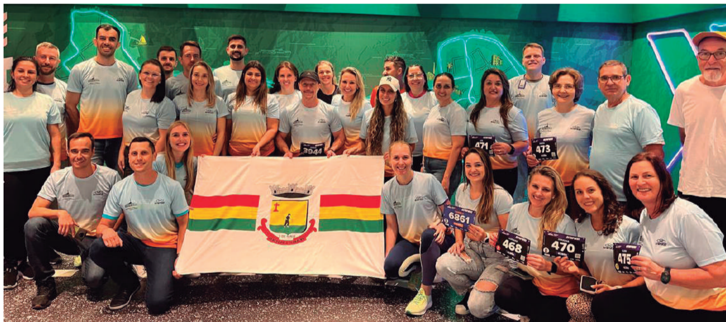
Três de Maio mais uma vez foi destaque na Maratona de Porto Alegre. O grupo de corrida Evidence Runners Três de Maio participou da 39ª Maratona Internacional de Porto Alegre, nos dias 28 e 29 de setembro. Este evento ocorre todos os anos, e os corredores de Três de Maio participam desde 2018. Neste ano, foram 34 atletas. Desses, quatro fizeram 10 quilômetros, 21 completaram 21 km (meia maratona), oito correram 42km (maratona) e um participou do Desafio Gaúcho: 21km + 42km. A maratona de Porto Alegre é de nível internacional e contou com mais de 20 mil atletas participantes. Parabéns, vocês são grandes!