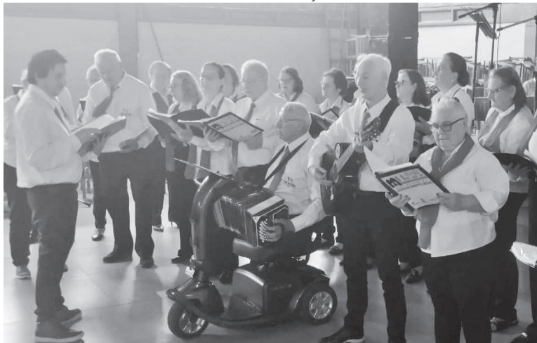
Integrantes do coral três-maiense presentes no 8º Encontro Microrregional Noroeste de Canto Coral da Terceira Idade, realizado em Boa Vista do Buricá

O evento reuniu corais de diversos municípios da região, promovendo a integração e valorização da cultura musical entre os idosos. Representando Três de Maio, o Coral A Arte de Cantar na Melhor Idade encantou o público com seu repertório, destacando-se pelo talento e entusiasmo dos participantes.