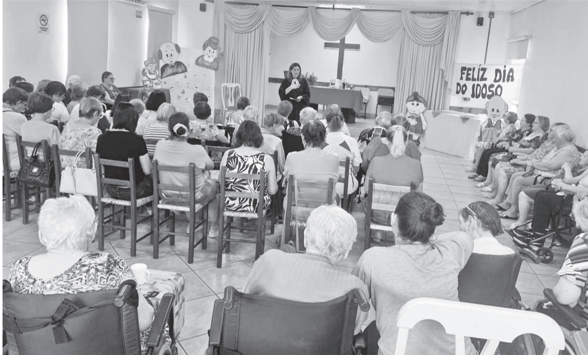
Muitos voluntários realizaram atividades com os moradores do lar. No registro, momento de oração na Semana do Idoso

Em quase três décadas, a Associação Tresmaiese de Amigos dos Idosos já abrigou 268 moradores acima de 65 anos