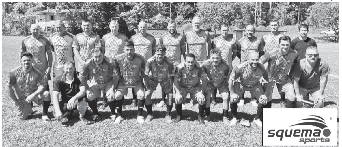
Time dos Amigos de Chapecó enfrentou o Palmeiras de Mato Queimado no último domingo, dia 29 de setembro, na cidade catarinense