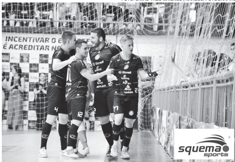
União finalizou 1ª fase com o melhor ataque do grupo, com 52 gols marcados

A segunda teve 12 gols, sendo sete do time da casa e cinco dos visitantes. Os gols do União