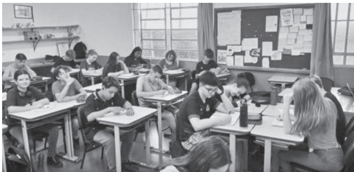
Alunos do Ensino Médio da Escola Castelo Branco têm um currículo diversificado, com unidades curriculares eletivas, que permite que os estudantes explorem interesses pessoais em áreas como artes, esportes, tecnologia e empreendedorismo

Escola Estadual de Ensino Médio vem implantando modelo de pedagógico com o objetivo de oferecer uma formação integral para os estudantes