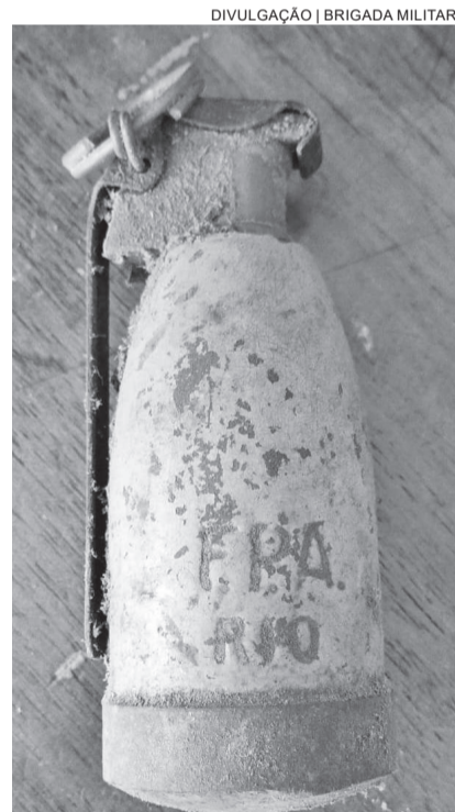
Granada encontrada em uma residência próxima a área central da cidade foi detonada pelo BOPE

Conforme a BM, não se pode precisar se a granada tinha potencial explosivo. Por ser um artefato antigo, estima-se que pertencia ao falecido morador.