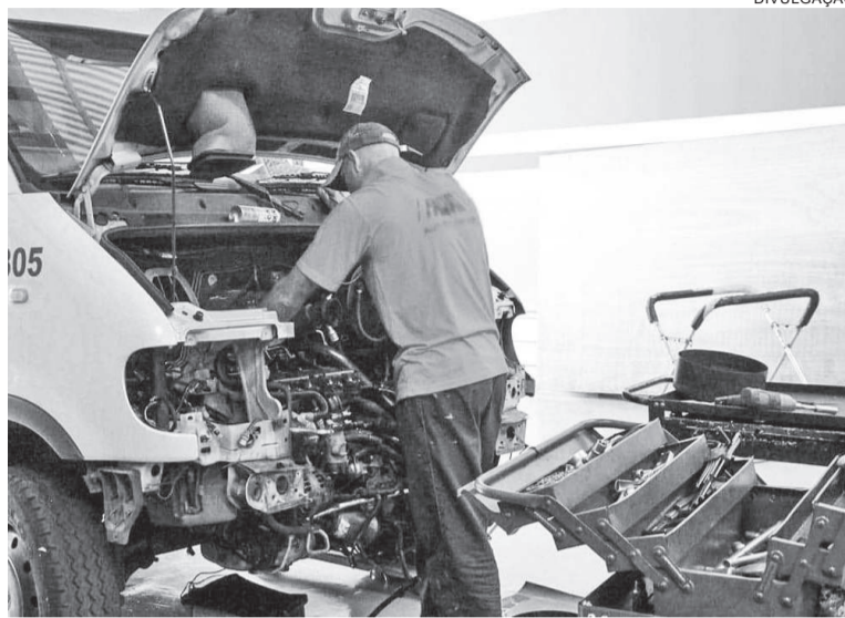
O setor dos serviços detém a maior quantidade de empregos em Três de Maio, com 2.430 trabalhadores

O melhor desempenho do mês apareceu nos serviços, setor que mais emprega no ano em Três de Maio. Foram 14 postos de trabalho criados, alcançando o total de 2.430 trabalhadores formais. Na construção o saldo ficou em 13 empregados, passando a ter 151 trabalhadores. Já a indústria cresceu em 11 empregados no mês, chegando a 1.632.