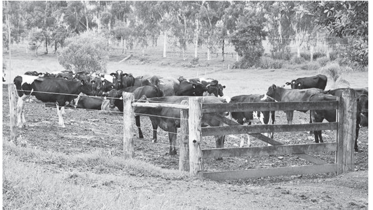
Mesmo com diminuição do efetivo de bovinos, Três de Maio lidera a lista com 13025 cabeças

Pesquisa da Pecuária Municipal mostra variação do número de cabeças em diferentes espécies de 2022 para 2023