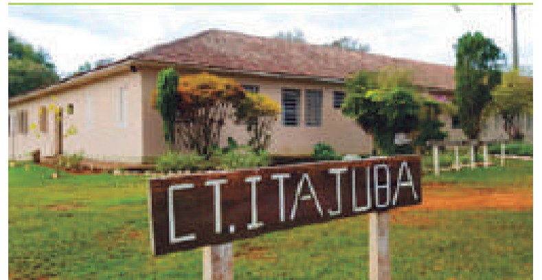
A Comunidade Terapêutica São Nicolau, em Itajubá, Porto Mauá, foi a primeira a ser inaugurada pela Associação Vida Plena Amor Exigente

Além de todos os profissionais envolvidos nos atendimentos, a associação conta com o trabalho de cerca de 40 voluntários.