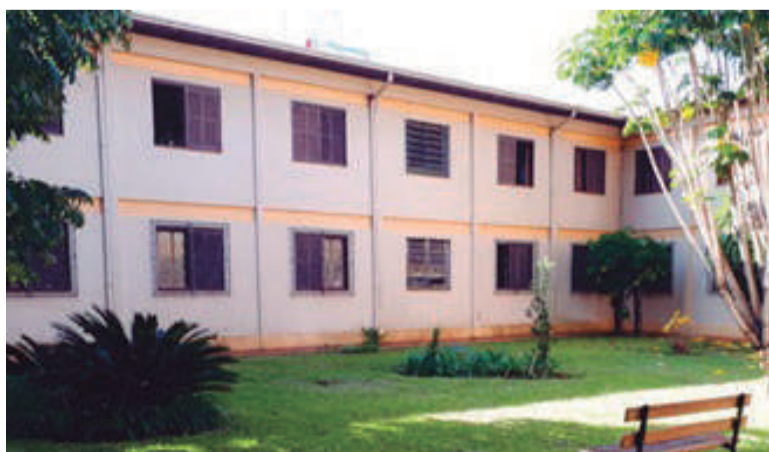
A unidade Tupancy, localizada em Santa Rosa, tem capacidade para abrigar 45 pacientes. Comunidade foi a segunda a ser construída e é destinada a mulheres

Atualmente, há um grupo de 41 pessoas internadas na Avipae sem condições de custear sua internação, ou seja, as despesas da manutenção dessas pessoas nas casas, é totalmente custeada pela Avipae. "Essas pessoas estão descobertas de qualquer convênio, pois todas as vagas SUS encontram-se preenchidas. Por isso, é tão importante a ajuda da comunidade, que pode ser feita através de doações em dinheiro ou em alimentos", complementa Pe. Edegar.