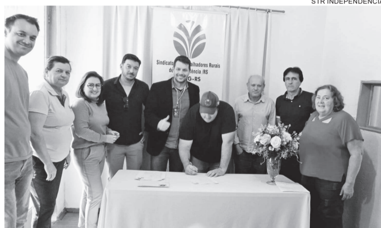
Assinatura do contrato ocorreu no STR de Independência, reunindo representantes das entidades envolvidas