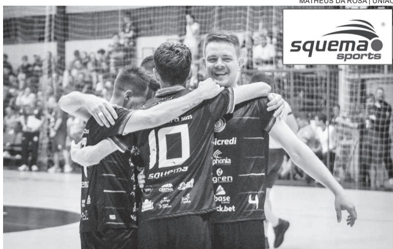
Com os seis gols da noite de sábado, o União Três-Maiense tem o melhor ataque da Chave B, somando 29 gols marcados em sete jogos

Com o término da 7ª rodada, o União se isola na liderança da chave B com 16 pontos, cinco de vantagem para o vice-líder, Asaf. Agora são oito pontos à frente do 4º colocado Real Itaquí e do 5º