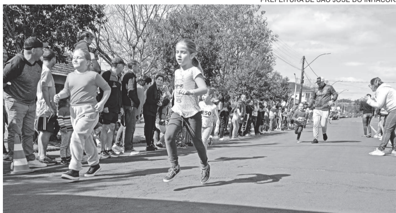
Crianças participaram das provas durante a 3ª edição da Rústica da Independência

A Semana da Pátria do município encerra amanhã, com a extinção do Fogo Simbólico na Praça Alceu Fernandes, às 17 horas.