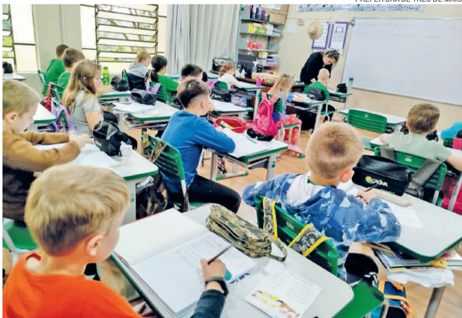
PREFEITURA DE TRÊS DE MAIO

Realizado de dois em dois, o Índice de Desenvolvimento da Educação Básica - IDEB 2023, foi divulgado recentemente pelo Ministério da Educação (MEC). A Escola Municipal Bem Viver Caúna, localizada na localidade de Caúna Alta, interior do município, obteve o melhor aproveitamento na avaliação das Séries Iniciais do Ensino Fundamental, entre as escolas públicas de Três de Maio, com nota 7,3. A escola atende 143 alunos em turno integral/5