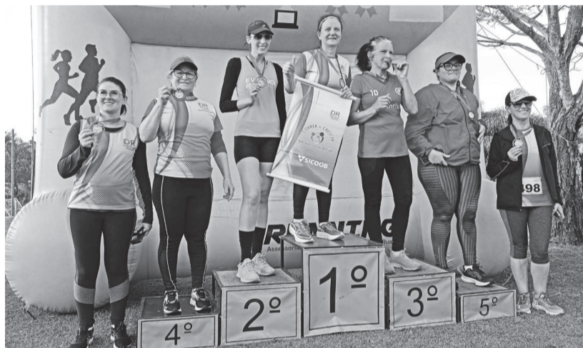
Ganhadoras da categoria livre feminino