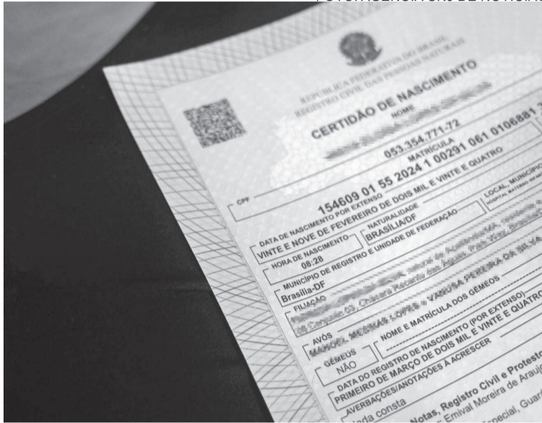
A gratuidade da certidão de nascimento é garantida por lei no Brasil