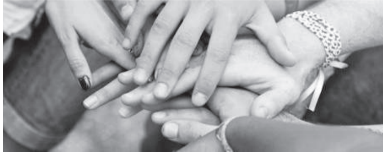
Propósito do A.A. é manter a sobriedade dos membros

O grupo três-maiense tem em torno de dez membros que