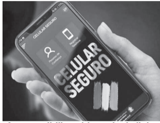
App possibilita o bloqueio da linha em caso de furto, por exemplo

Segundo o MJSP, não existe limite para cadastro de números, mas é preciso que estejam vinculados ao CPF titular da linha para que ocorra o bloqueio efetivamente. Quem estiver cadastrado no aplicativo pode indicar pessoas de sua confiança, que estarão autorizadas a efetuar bloqueios, caso o titular tenha o aparelho celular roubado, furtado ou extraviado. A própria vítima também pode realizar o bloqueio, desde que acesse o site através de um computador.