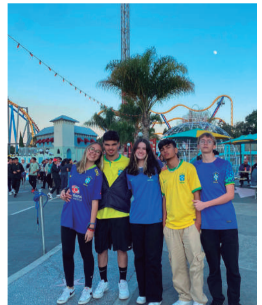
Viagem ao centro do México. Registro no parque de diversões Six Flags com outros brasileiros que estavam fazendo intercâmbio no mesmo distrito