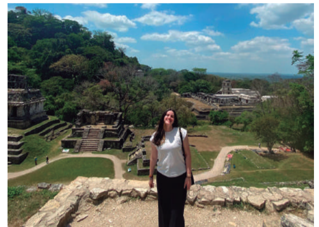
Visita à zona arqueológica de Palenque, no estado de Chiapas