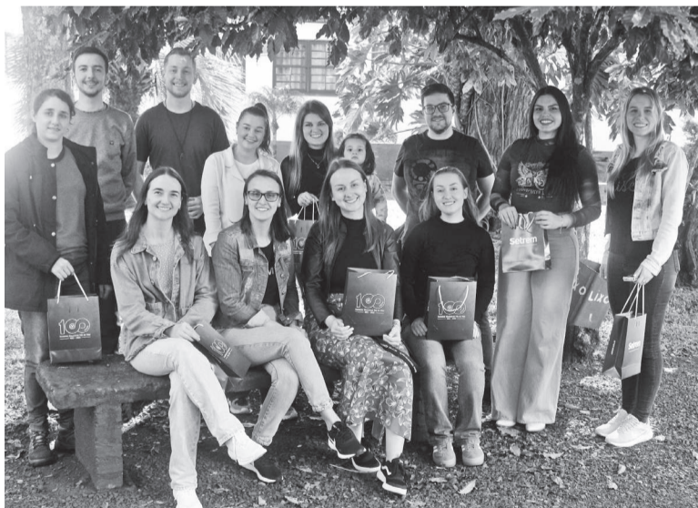
Doze anos depois, egressos voltaram à Setrem para relembrar sobre sua jornada escolar

Além de reler cartas, o grupo encontrou itens como um jogo de truco, listagens de colegas e eletrônicos da época.