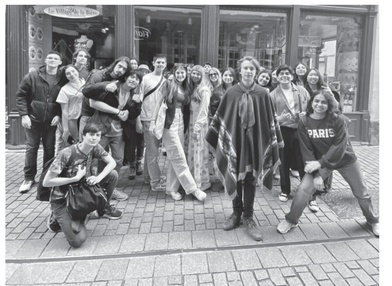
Intercambistas do Rotary, em uma viagem a Estrasburgo, uma cidade no Rio Reno, localizada metade na França e metade na Alemanha