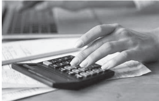
A taxa média mundial de IVA é de aproximadamente 15%, com médias regionais variando entre cerca de 12% na Ásia e 20% na Europa. No Brasil será de 26,5%

Os regimes diferenciados, que significam alíquotas menores para determinados setores,