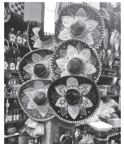
Tradicional sombrero Mariachi. Registro é em uma feira artesanal, na cidade de Puebla