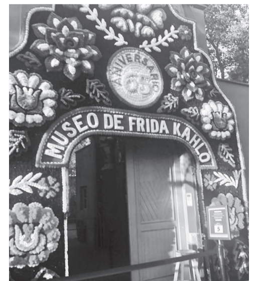
Entrada da casa da pintora Frida Kahlo, na Cidade do México. Atualmente o local é um museu