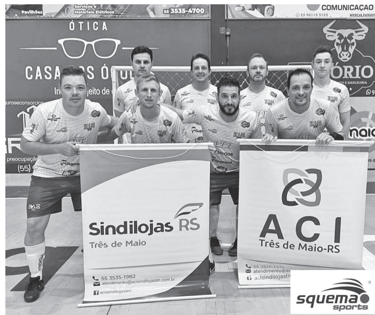
Equipe da Agrosol venceu a Retífica Motor 3 na primeira rodada do Campeonato do Trabalhador Tresmaiese pelo placar de 4 a 3