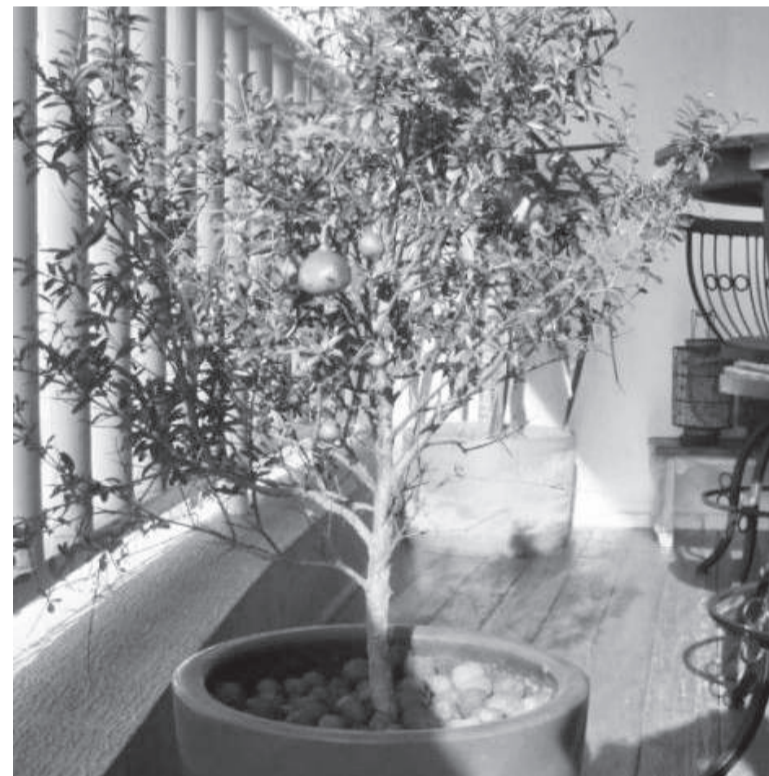
Com alguns cuidados, é possível ter uma produção em pequenos espaços

Além disso, Régis indica, para o controle de pragas e doenças, a