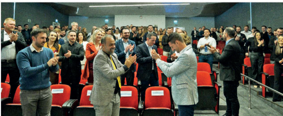
Migrate comemorou seus 20 anos com a presença de autoridades, colaboradores, instituições de ensino e financeiras, parceiros, fornecedores e familiares, onde a empresa agradeceu a parceria