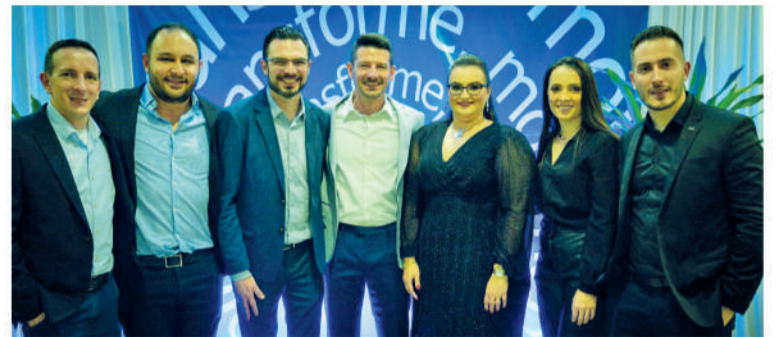
Time de Gestores da Migrate

A trajetória da Migrate serve de inspiração, mostrando que é possível conquistar um mundo de oportunidades mesmo partindo de uma pequena cidade do interior. Esses 20 anos impulsionaram a empresa a acreditar em um futuro extraordinário, alcançado por meio das pessoas e da sua expertise, tornando-se uma empresa global.