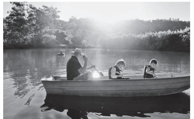
O sítio é uma opção de espaço para lazer e interação com a natureza