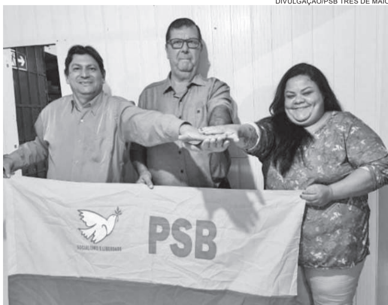
Candidatos confirmados para disputa à vereança pelo PSB de Três de Maio