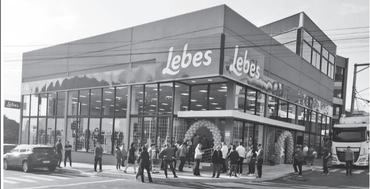
Loja fica na esquina da Rua Horizontina com a Senador Alberto Pasqualini