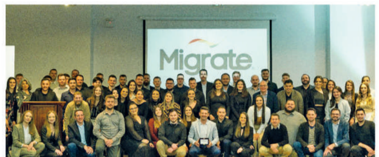
Os 73 Migraters que fazem o projeto Migrate acontecer