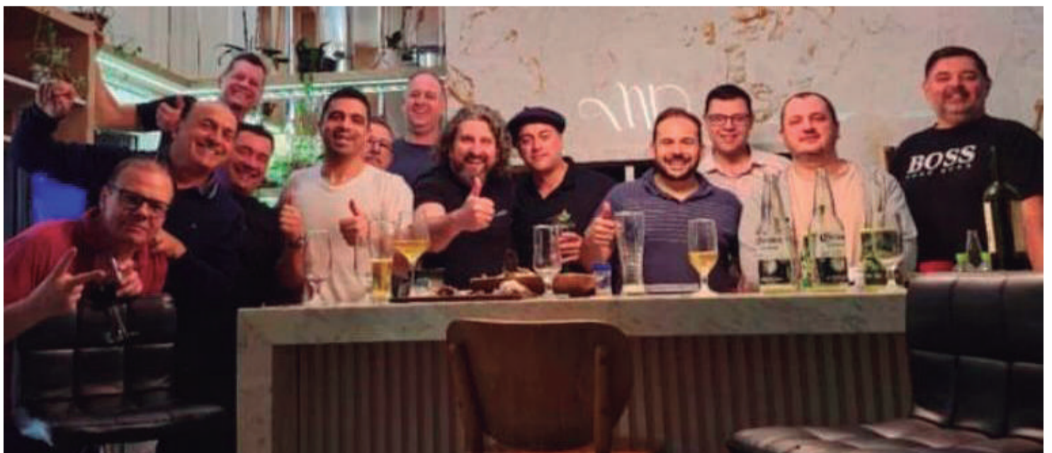
Um registro especial da Turma do Milhão, exemplos de amigos e parceiros. A turma existe a muitos anos, seguidamente se encontram para confraternizar. Já colecionam lindos momentos e grandes memórias afetivas. Vida longa!