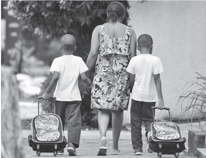
Legislação foi aprovada na Assembleia gaúcha e visa estimular o compromisso dos pais com a escola

Na segunda-feira, dia 8, o governador Eduardo Leite sancionou a lei que assegura a preferência de vaga a irmãos na mesma escola da rede estadual de ensino, desde que a instituição ofereça turmas nos níveis educacionais dos alunos. O projeto de lei é de autoria do deputado estadual Gustavo Victorino (Republicanos).