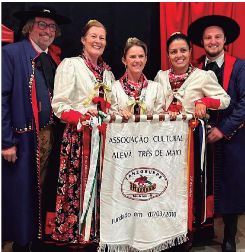
Alguns membros da Associação Cultural Alemã de Três de Maio, representando o Tanzgruppe Maiblume na cidade de Campinas das Missões!