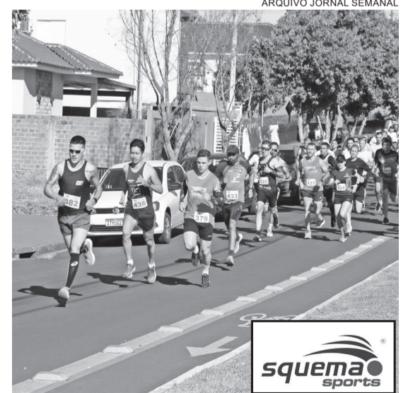
A corrida é uma boa opção para quem pretende começar a praticar atividade física no dia a dia

Fonte: Corpo.ciência (Me. L.Carvalho - doutorando - UNICAMP e Me. V. Concon)