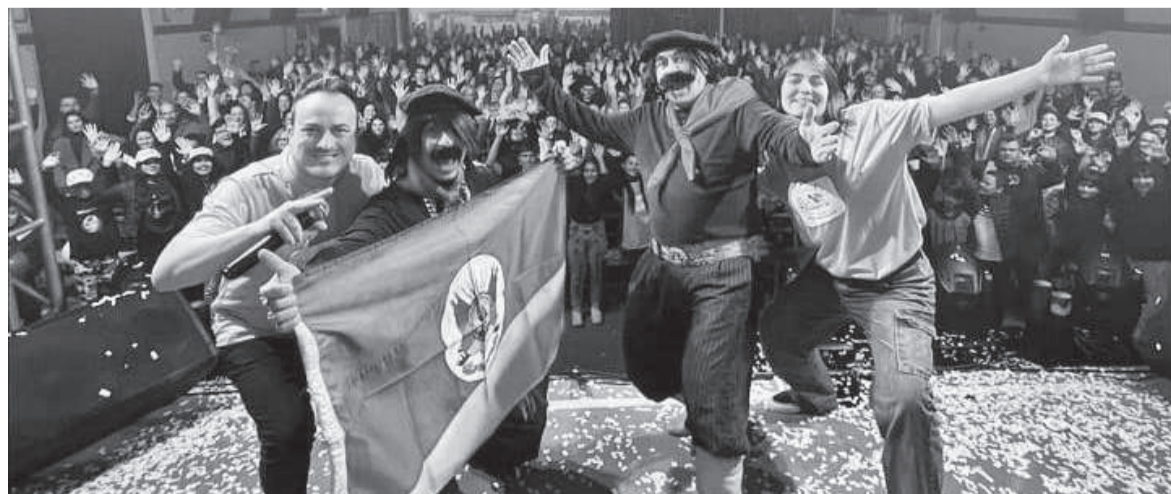
Show do Guri de Uruguaiana foi uma das atrações do Dia de Cooperar

O Dia C em Três de Maio foi promovido pela Cresol, Sicoob, Sicredi, Auriverde, Certhil, Cotrisal, Coopermil, Unimed, Unitec, Cooper Dom Hermeto, Cotrimaio, Cooper União, Coopersenap e CopHermeto. A ação teve apoio dos Clubes de Serviço.