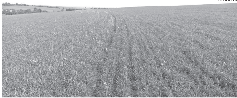
A maioria das lavouras de trigo da região está com desenvolvimento vegetativo favorável

Já o rendimento médio esperado para esse ano é de 3.300 kg/hectares (ou seja, 55 sacas/ha). Rustick explica que o aumento de área se deve a alguns