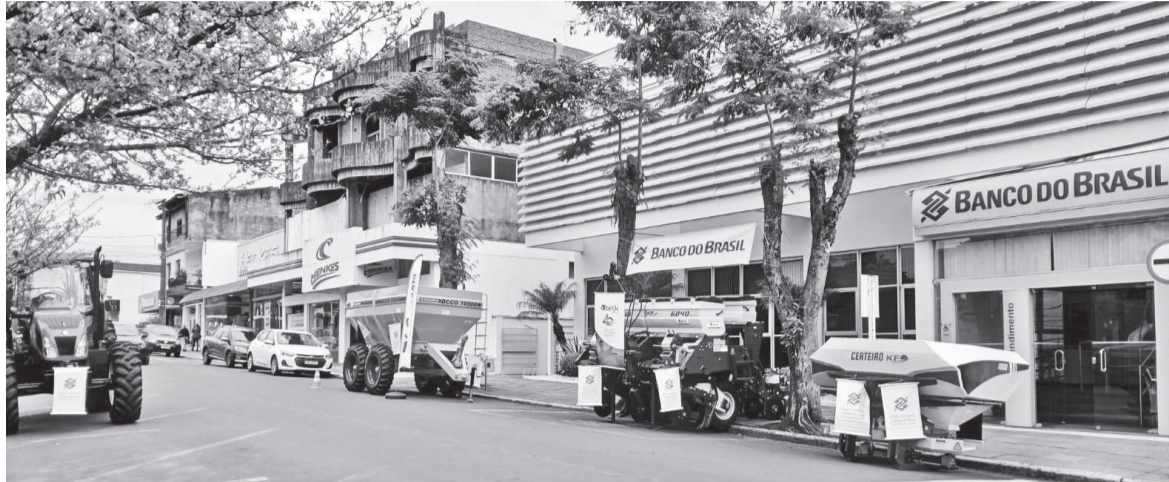
Agência local do Banco do Brasil atua com linhas de crédito a agricultores de Três de Maio, São José do Inhacorá e Alegria, com recursos liberados a financiamentos a outros estados brasileiros

a agência do Banco do Brasil atende aos municípios de São José do Inhacorá e Alegria. “No entanto, os clientes do Banco do Brasil atuam em toda a região e, inclusive, com financiamentos em outros estados do país, como Mato Grosso, Mato Grosso do Sul, Goiás, Piauí, Bahia e Maranhão”, reforça Andrade.