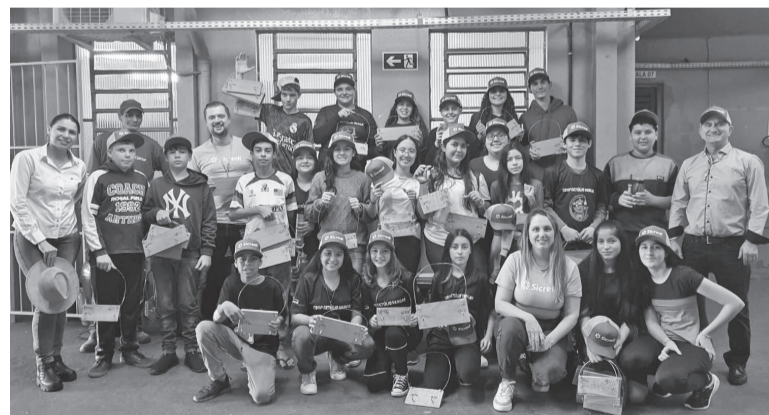
Em Independência, a Cotrisal, Sicredi e alunos da escola municipal Presidente Getúlio Vargas produziram e instalaram placas em residências que não possuíam lixeiras com separação para lixo seco e úmido