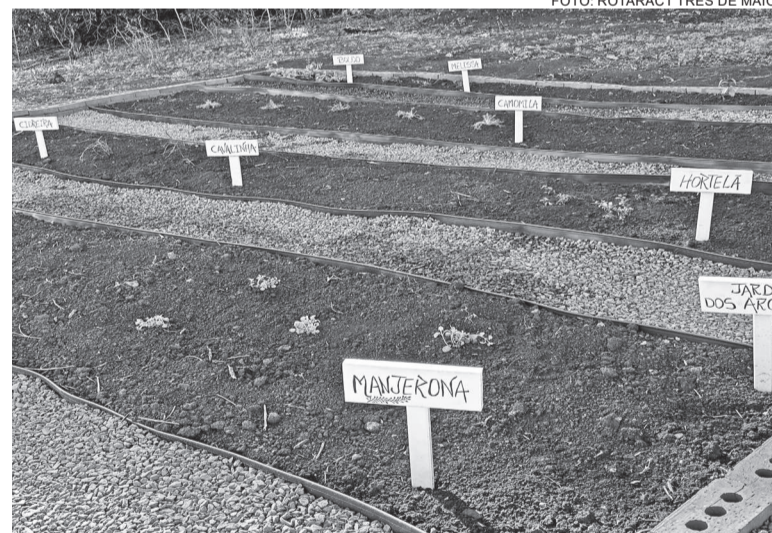
O solo preparado pelos voluntários recebeu mudas e sementes de chás e temperos

O local recebeu um jardim/horta com mudas e sementes de diversos tipos de chás e hortaliças