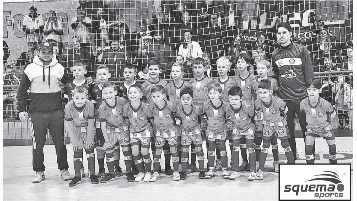
Equipe Sub-9 da Crednor Futsal que jogou no último domingo no Ginásio da AABB

Os meninos da Crednor folgam neste final de semana e retornam às quadras no dia 20 de julho.