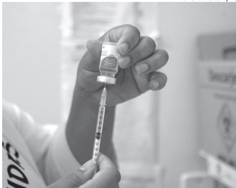
Em Três de Maio, a vacinação contra a influenza ocorre na ESF São Pedro das 13h às 16h30; na ESF Promorar das 13h às 16h30; na ESF Consolata das 13h30 às 16h30; na ESF Manchinha das 13h30 às 16h30; e na Unidade Central das 7h30 às 11h e das 13h às 16h30.

“Porque essa vacina não promove imunidade duradoura. Algumas doenças como catapora, sarampo, a pessoa pega uma vez e nunca mais adoecer, porque são gerados anticorpos que duram a vida toda, mas a gripe não. Gripe, a pessoa pode adoecer diversas vezes na vida, justamente porque os anticorpos não são duradouros. Mas ainda há um outro motivo. O vírus da gripe sofre muitas mutações. Então, quase todos os anos, os vírus circulantes são