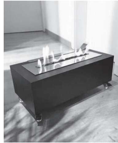
Aquecedores e lareiras ecológicas podem causar explosões, queimaduras e até incêndios, se utilizadas de forma inadequada