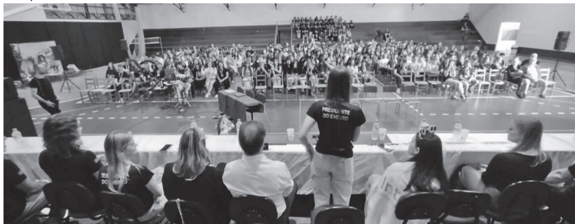
Conferência Distrital reuniu mais de 400 interactianos em Três de Maio

A posse da governadora distrital, equipe distrital, governadores assistentes, presidentes dos Rotary e Rotaract, RDR, RDI e RDK do ano rotário 2024-2025 ocorre amanhã, em Tupanciretã.