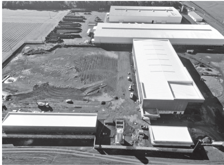
Parque Empresarial IV conta com a área de 165 mil m 2