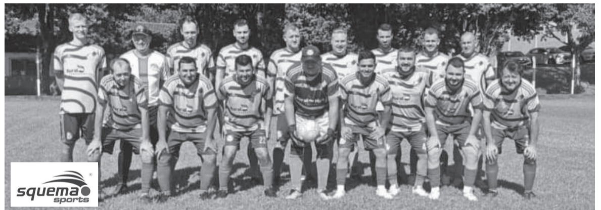
Equipe do Palmeiras de Mato Queimado. Equipe enfrenta o Oriental amanhã