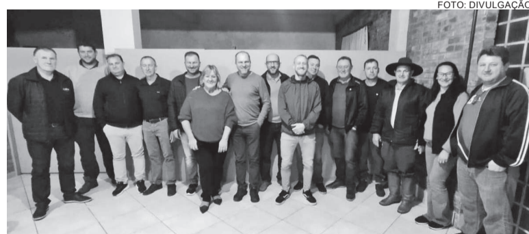
Dirigentes dos cinco partidos estiveram reunidos e definiram apoio aos atuais prefeito e vice de Boa Vista do Buricá

Conforme informações repassadas ao Semanal pelas agremiações políticas boavistenses, os partidos passam a organizar a composição para pré-candidaturas a vereador. Entre os cinco partidos