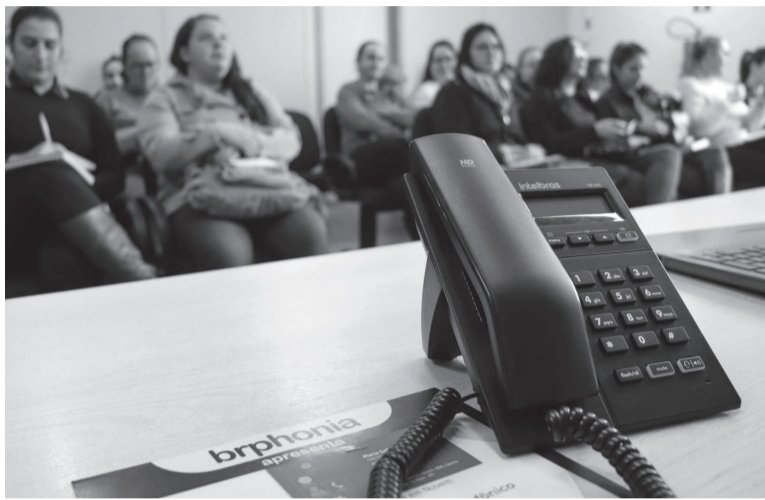
PREFEITURA DE TRÊS DE MAIO

De acordo com o governo municipal, além da integração, a Unidade de Resposta Audível (URA), uma espécie de secretária eletrônica, permitirá automatizar e centralizar as demandas em uma central telefônica. Ao invés de o cidadão precisar saber vários números telefônicos, ele poderá ligar para a central, no 3535-1122, digitar o ramal do serviço que deseja ou aguardar que URA irá informar o menu de ramais dos serviços disponíveis e, após a escolha pelo cidadão, direcionará a ligação para o setor específico ao qual o cidadão deseja tirar dú-