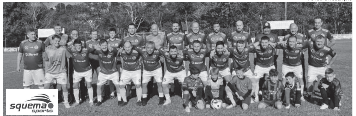
Oriental recebe o Palmeiras de Mato Queimado no Estádio Reinoldo Selzler