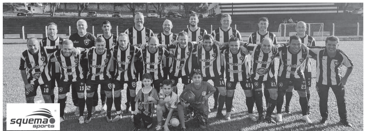
Já o Botafogo vai até Santa Rosa enfrentar a equipe do Atlético neste sábado