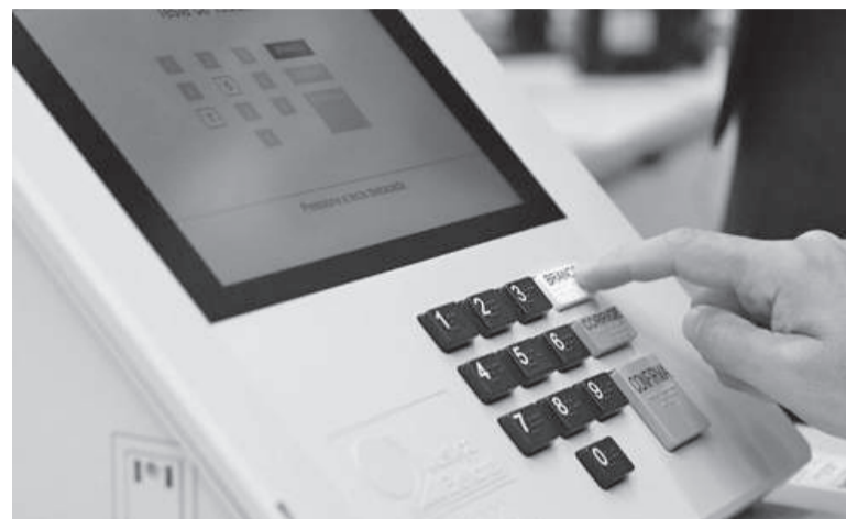
Eleições para escolha de prefeitos e vereadores ocorre em 6 de outubro

para o legislativo no pleito de 2024, entre aqueles vereadores que buscam reeleição e novos nomes.