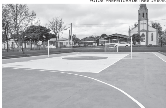
Quadra recebeu pintura nova