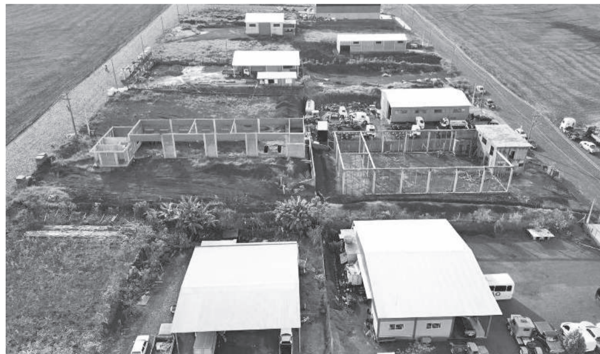
Parque Empresarial II tem recebido a maioria dos novos investimentos realizados em Três de Maio

Desde 2021, o setor metalmeccânico recebeu o maior número de investimentos, com cinco novas empresas.