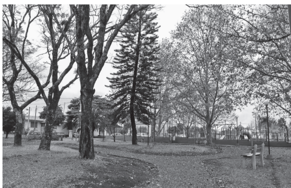
A praça da comunidade foi revitaliza