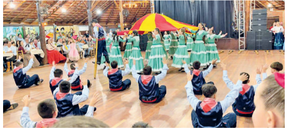
Invernada Mirim apresentou uma coreografia sobre a brincadeira Perna de Pau

Já o Departamento Cultural da entidade é sempre muito bem representado pelas prendas e peões de faixa e crachá. Nesse final de semana (20 a 23 de junho) e no próximo (28 e 29 de junho) o CTG contará com 7 representantes na Ciranda Regional de Prendas e Peões que será realizada na cidade de Independência.