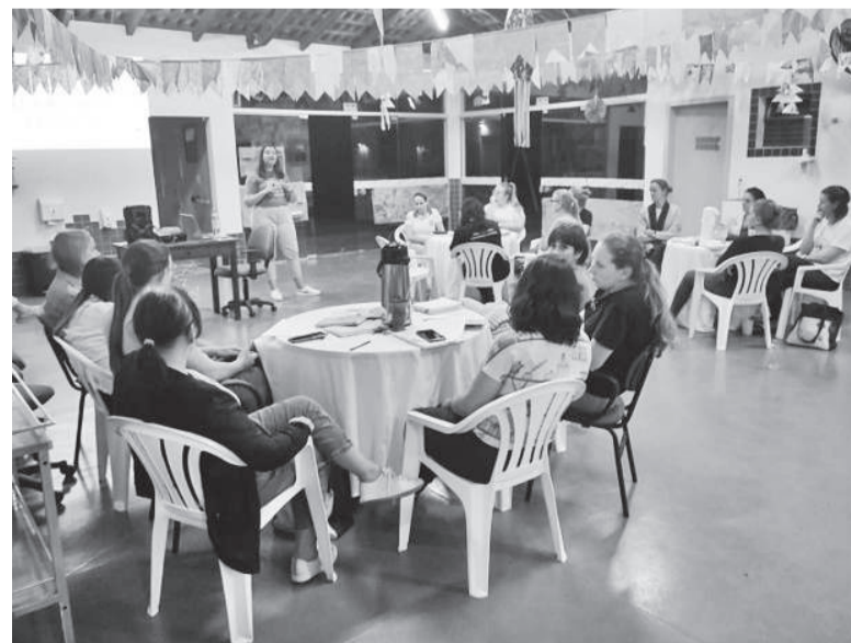
Capacitação teve como tema "Registros na Educação Infantil"

No período da tarde, as professoras das escolas municipais também tiveram um momento de assessoria com as profissionais da Docência em Construção.