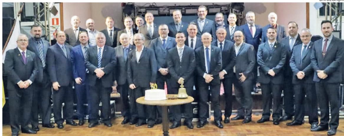
Para comemorar a data, na última sexta-feira, foi realizado um baile de confraternização na AABB de Três de maio

Na área da educação, possui o programa de intercâmbio de jovens, que permite que estudantes locais passem um ano no exterior, enriquecendo suas experiências culturais e acadêmicas. Mais de 30