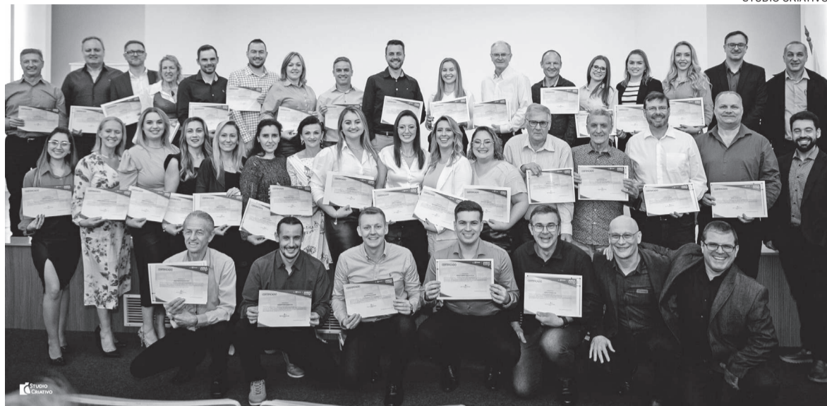
Curso teve a participação de 39 pessoas, entre elas colaboradores, conselheiros e líderes de Núcleo

Formação ocorreu através do Projeto +Coop