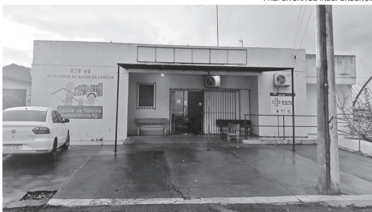
Projeto visa melhorar o atendimento das equipes da Estratégia da Família

Segundo, o prefeito João Edécio, o projeto busca qualificar o atendimento das equipes de Estratégia Saúde da Família (ESF 01), melhorar a estrutura física e ambiência, dando ênfase para a acessibilidade, além de ampliar o acesso à rede de saúde, incentivando a melhoria e o fortalecimento dos serviços de atenção primária oferecidos à população.