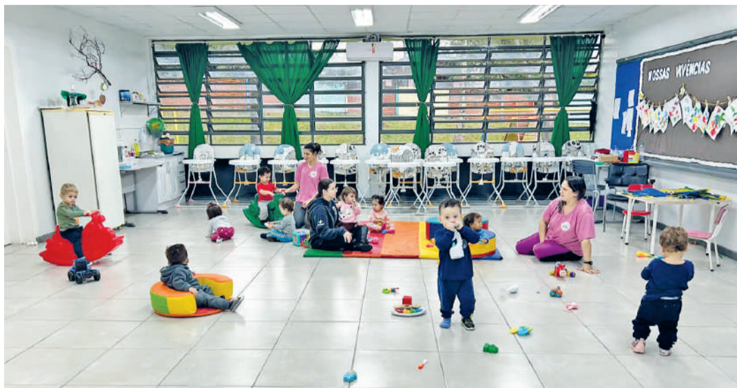
Atualmente, o município atende 660 crianças matriculadas na Educação Infantil (turmas de 0 a 3 anos)

O Governo Municipal de Três de Maio, através da Secretaria de Educação, Cultura e Esporte, preocupado com a garantia de acesso na Educação Infantil, sendo esta a primeira etapa da educação básica e pilar para o desenvolvimento integral do ser humano, intensificou as ações para garantir o direito a uma educação de qualidade para todos.