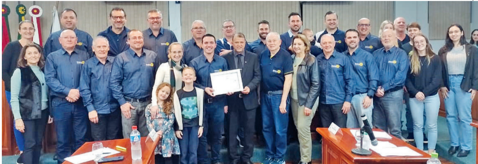
Homenagem dada pelo Legislativo contou com a presença de integrantes da família rotária de Três de Maio