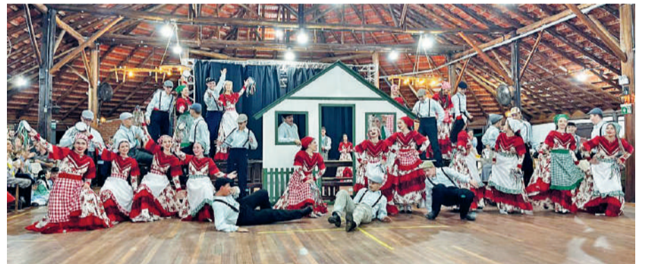
A cultura italiana, com as Festas de Filó, foi temática da apresentação da Invernada Juvenil