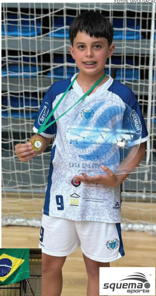
Solano foi o goleador da competição com 9 gols marcados