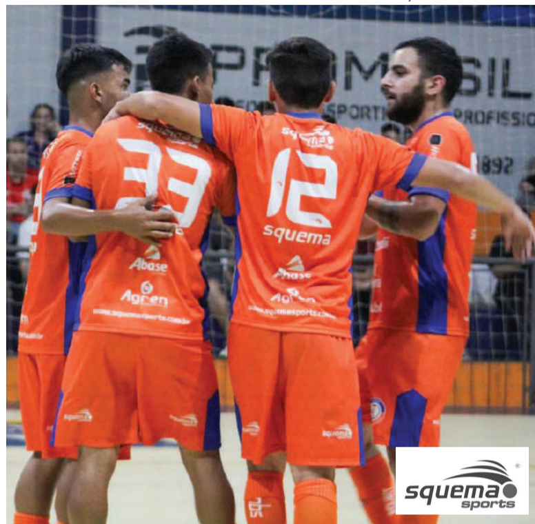
Antes da estreia no campeonato, a equipe do União Três-Maiense realizou quatro amistosos contra equipes da região