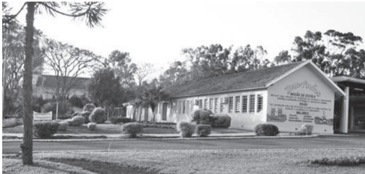
Atualmente 322 alunos estão matriculados na rede municipal de São José do Inhacorá

De acordo com Sandra, o município tem trabalhado in-