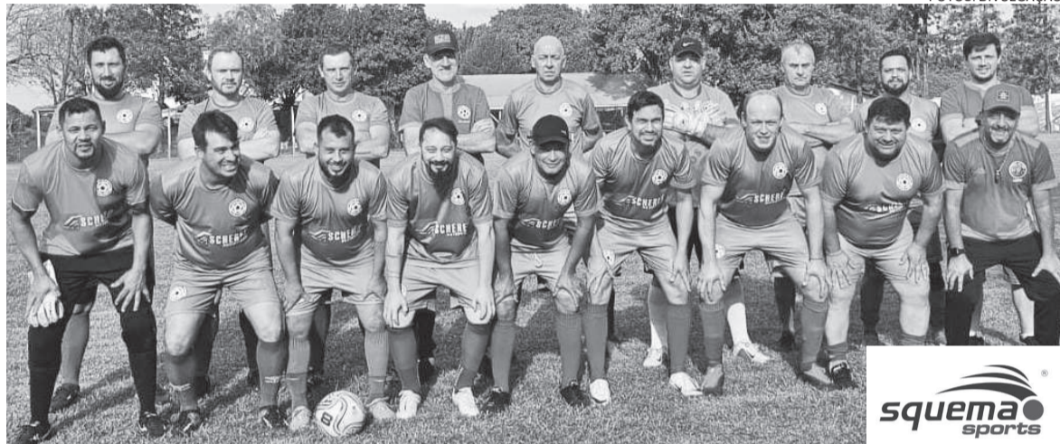
Amigos da Bola jogou no último sábado contra Dona Belinha, em Santo Cristo

“Vamos deixar acesa a fogueira da esperança e amor nos nossos corações, viva São João!” 24 de junho, dia de São João