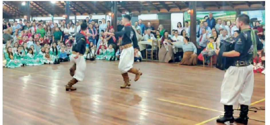
Triopacito se apresentou na noite do último sábado no CTG