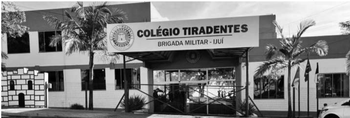
Colégio Tiradentes de Ijuí é uma das oito unidades mantidas em uma parceria entre a Brigada Militar e a Secretaria Estadual de Educação do RS

O Colégio Militar Tiradentes de Ijuí foi classificada como a segunda melhor escola pública do Brasil no ano de 2023, segundo as notas do Exame Nacional do Ensino Médio (Enem). Os dados foram divulgados na semana pela Empresa AIO Educação. A empresa apura os resultados médios das escolas brasileiras e elaborou um levantamento realizado com base nos microdados do exame do ano passado, divulgados pelo Ministério da Educação. Além da unidade de Ijuí, as unidades de Santo Ângelo e Santa Maria dos Colégios Tiradentes da Brigada Militar (CTBM) também ficaram entre as 25 melhores escolas públicas do Brasil.