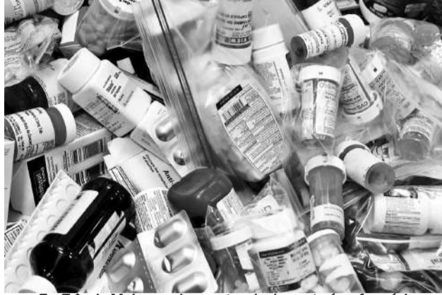
Em Três de Maio, um dos pontos de descarte é na farmácia municipal da Av. Santa Rosa

Os medicamentos têm substâncias que podem se tornar tóxicas após a sua decomposição. Quando jogados em locais inadequados, como lixo comum ou sistema de esgoto, os medicamentos contaminam a água e o solo, podendo afetar peixes e outros organismos vivos, além de