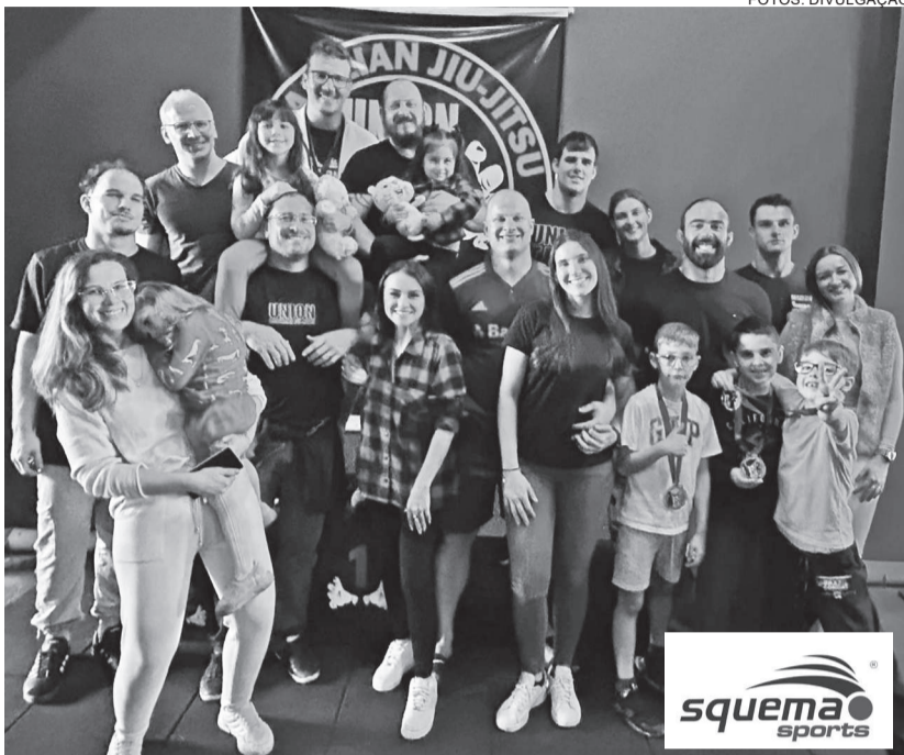
Atletas da Union Team de Três de Maio