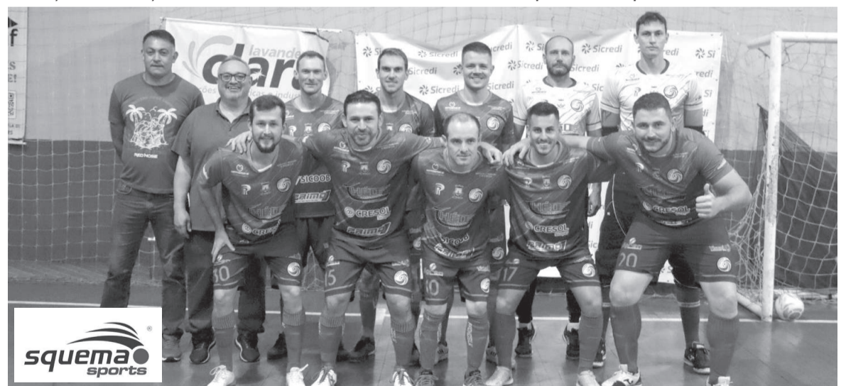
Após empatar em 2 a 2 com ARL Futsal/Casa dos Óculos, a Crednor/Gôndolas Mar-Rio passou nos pênaltis (3X2) e está na final do Livre