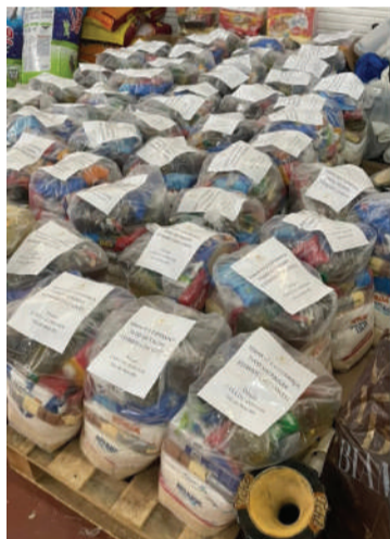
Produtos foram adquiridos com recursos de eventos promovidos pela Casa da Amizade