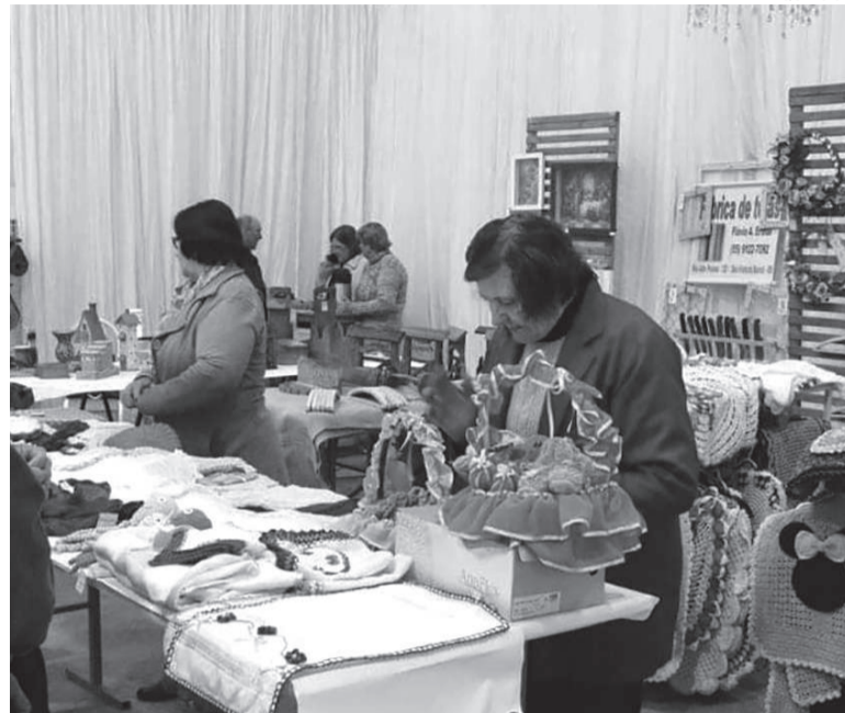
Feira reúne expositores boa-vistenses do ramo têxtil

Tem início hoje, às 17 horas, a Feira Têxtil 2024 em Boa Vista do Buricá. O evento é realizado pela prefeitura municipal, com apoio da ACI de Boa Vista do Buricá. A feira reúne expositores do município, tem entrada gratuita e vai até o próximo domingo, dia 9, no Ginásio São José.