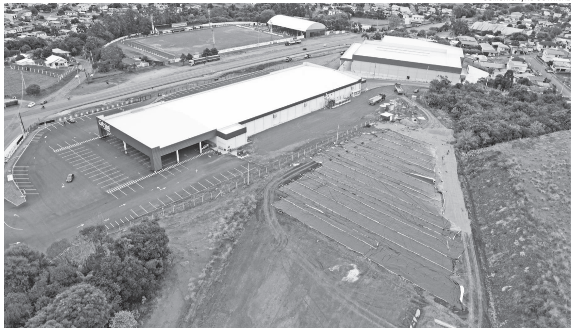
Usina está sendo instalada ao lado do Cotrisal Atacadista, em Sarandi

A Cotrisal prioriza ações sustentáveis nas suas atividades econômicas, incentivando e difundindo práticas para seus associados, por que acredita que cuidar da natureza é respeitar a vida e as próximas gerações. Para marcar o Dia Mundial do Meio Ambiente (5 de junho), a cooperativa anuncia a construção de uma Usina Fotovoltaica, em Sarandi.