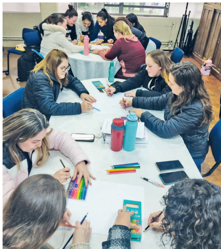
Professores participaram de diversas oficinas