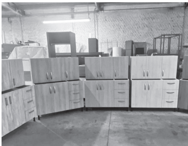
A fábrica de Móveis Castelo Branco produziu e doou conjuntos de balcão e armário e camas