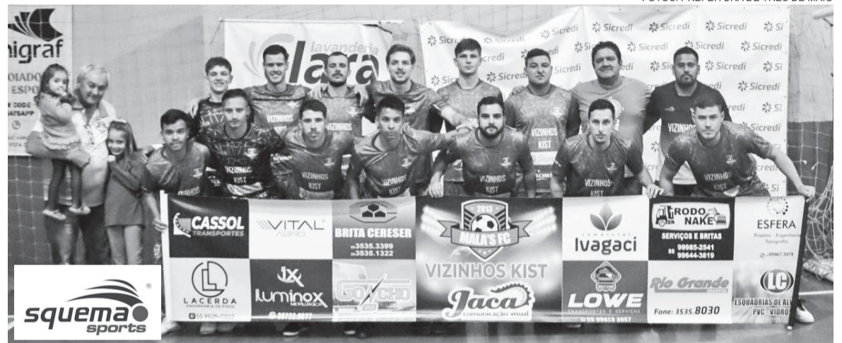
Malas/Vizinhos Kist/Jaca Visual venceu o Trem Bala da Colina na semifinal por 6 a 3 e disputa a final do Livre de 2024