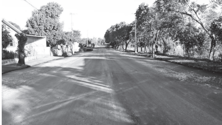
Obra pavimentou 4,4 mil m 2 da Rua Horizontina

O acesso pela Rua Horizontina ao Bairro Santa Maria recebeu capeamento asfáltico. De acordo com informações da assessoria de comunicação do Município, a pavimentação vai do trecho do antigo mini zoológico até o acesso do bairro, pela Avenida Santa Rosa.