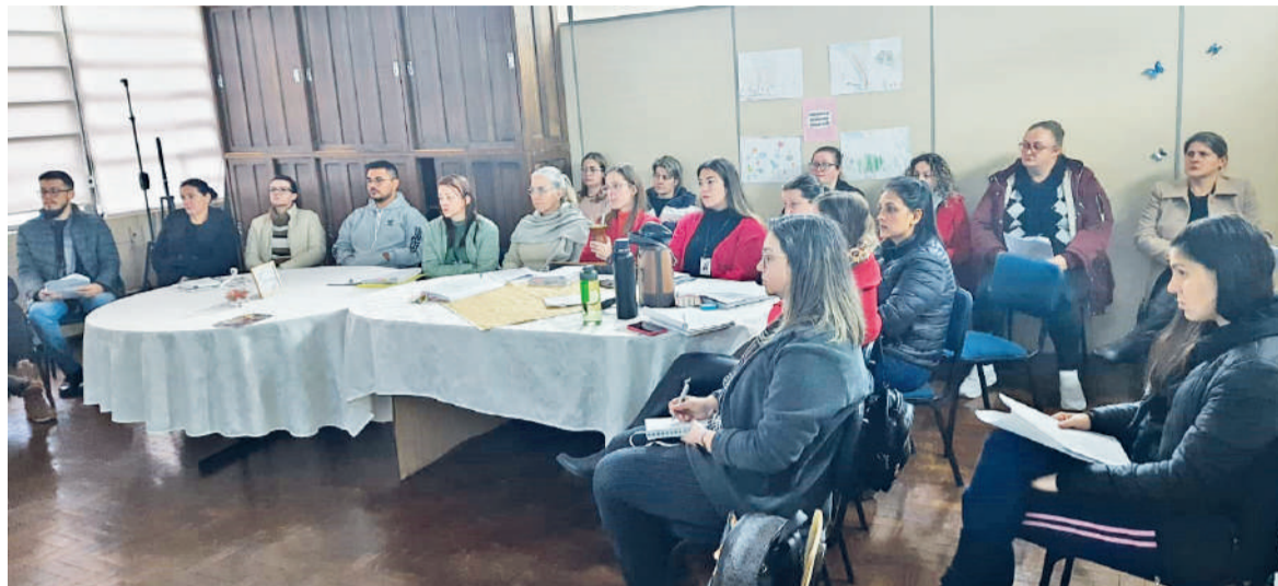
Reunião com representantes de todas as escolas de tempo integral para discutir a Política de Tempo Integral