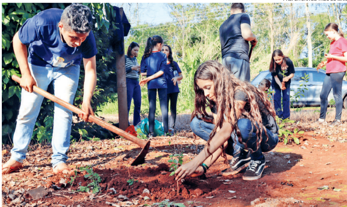
PREFEITURA DE TRÊS DE MAIO

Fazendo parte da programação da Semana do Meio do Ambiente de Três de Maio, alunos da Escola Municipal Germano Dockhorn realizaram o plantio de árvores nativas na área de preservação do bairro São Francisco, próximo ao Lajeado Morangueira. O plantio integra o projeto de compensação das árvores retiradas para construção do Complexo Esportivo e Cultural (foto)/15