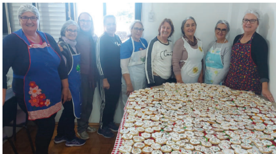
Bolachas foram doadas para Esteio e Sapucaia do Sul