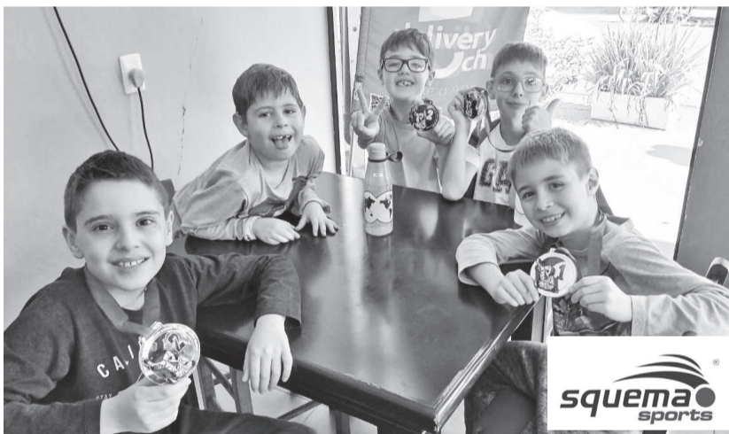
Atletas mirins de jiu-jitsu da Union Team de Três de Maio