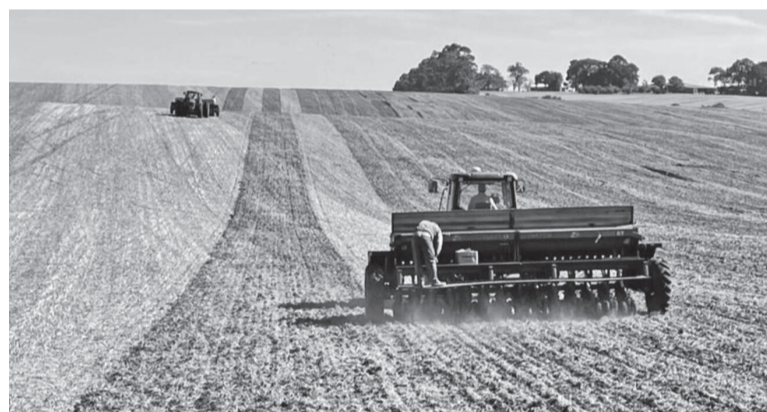
Semeadura de trigo deve alcançar 30% da área projetada em Três de Maio até o final dessa semana, conforme projeção da Emater local

mento da Emater estadual, divulgado em 6 de junho, a média de preços da saca aplicada no Rio Grande do Sul para o cereal é de R$ 65,63. “O cenário não é dos mais favoráveis, principalmente quanto ao lucro. Há uma margem muito apertada e com qualquer intempérie climática que afete as lavouras, a produtividade não cobrirá os custos da lavoura, principalmente pelo preço da saca de trigo ser o limitante para os nossos produtores”, acrescenta.