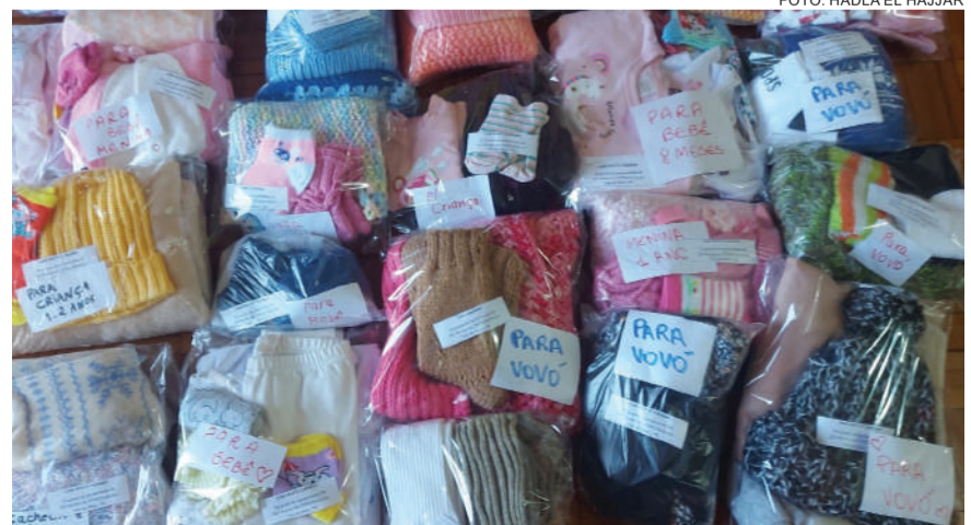
Além das peças confeccionadas pelas professoras, foi feita uma campanha de arrecadação de roupas de inverno, que foram destinadas ao núcleo de Porto Alegre para a distribuição

ACESSE JORNAL SEMANAL www.jsemanal.com.br