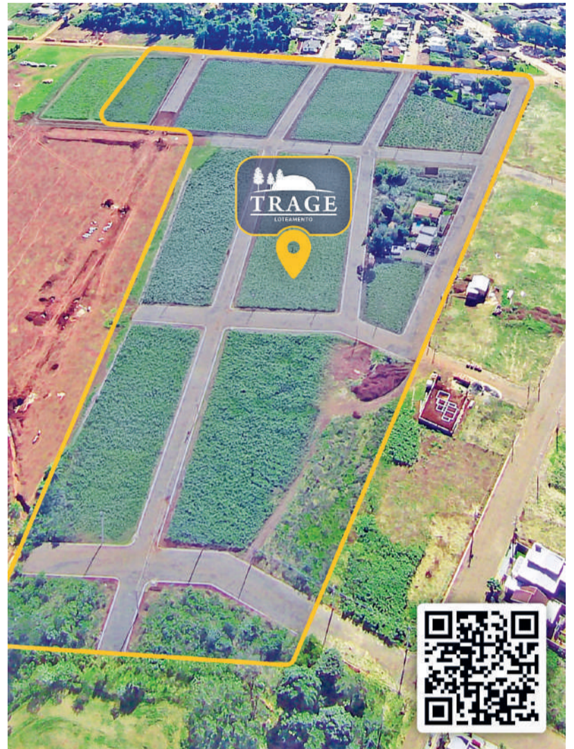
Estão sendo disponibilizados lotes com áreas de 300 a 900 m 2

A consultoria é gratuita e prestada por profissionais treinados da empresa SK Engenharia & Arquitetura.