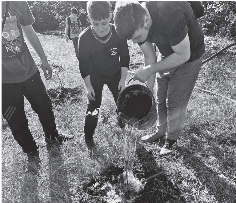
Espécies como Ameixa do Mato, Angico, Guajuvira, Pau-ferro, Pitanga, Cereja Preta, Ipê Roxo, Cedro e Guabijú estão sendo plantadas

Entre essas espécies plantadas estão as de Ameixa do Mato, Angico, Guajuvira, Pau-ferro, Pitanga, Cereja Preta, Ipê Roxo, Cedro e Guabijú.