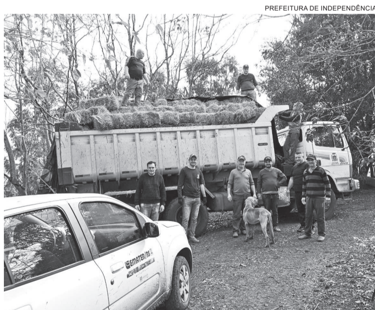
Campanha arrecadou 550 fardos de feno, que foram levados para depósito em Santa Rosa, de onde serão encaminhados às regiões afetadas

As doações foram transportadas até um depósito em Santa Rosa (no parque de exposições) com veículo da prefeitura. O carregamen-