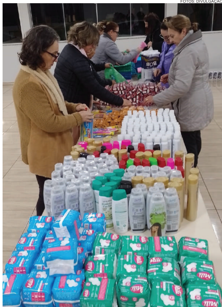
As senhoras da Casa da Amizade de Três de Maio montaram 100 kits de higiene pessoal que foram encaminhados para as vítimas das enchentes