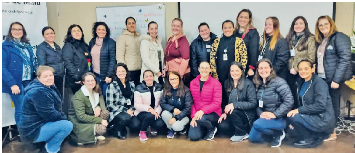
Participaram da formação professores da Educação Infantil

este evento reforça o compromisso da SMECE com a qualidade da educação e o desenvolvimento profissional dos seus educadores, alinhando-se às diretrizes nacionais e promovendo práticas pedagógicas eficazes e inovadoras.