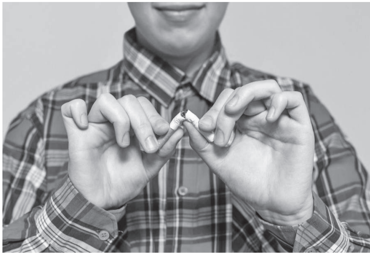
O tabagismo ainda mata 443 pessoas por dia no Brasil. O uso do cigarro é responsável por 90% das mortes por câncer de pulmão, segundo o INCA (Instituto Nacional do Câncer)

Especialista explica as principais doenças causadas pelo uso excessivo de tabaco; e como crianças e fumantes passivos também são afetados. O mote do Dia Mundial Sem Tabaco em 2024 é "Proteger as crianças da interferência da indústria do tabaco".