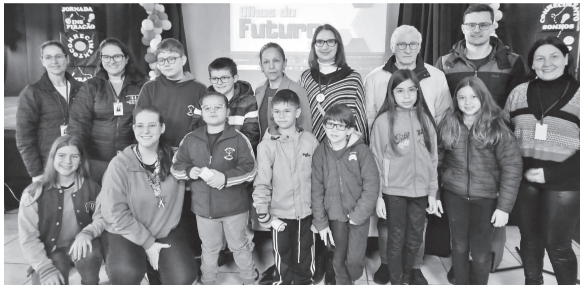
Grupo de alunos que beneficiados com óculos de grau e parceiros do projeto

normal da visão e saúde ocular. Porém, 16 alunos tinham deficiência visual e receberam óculos de grau confeccionados e doados