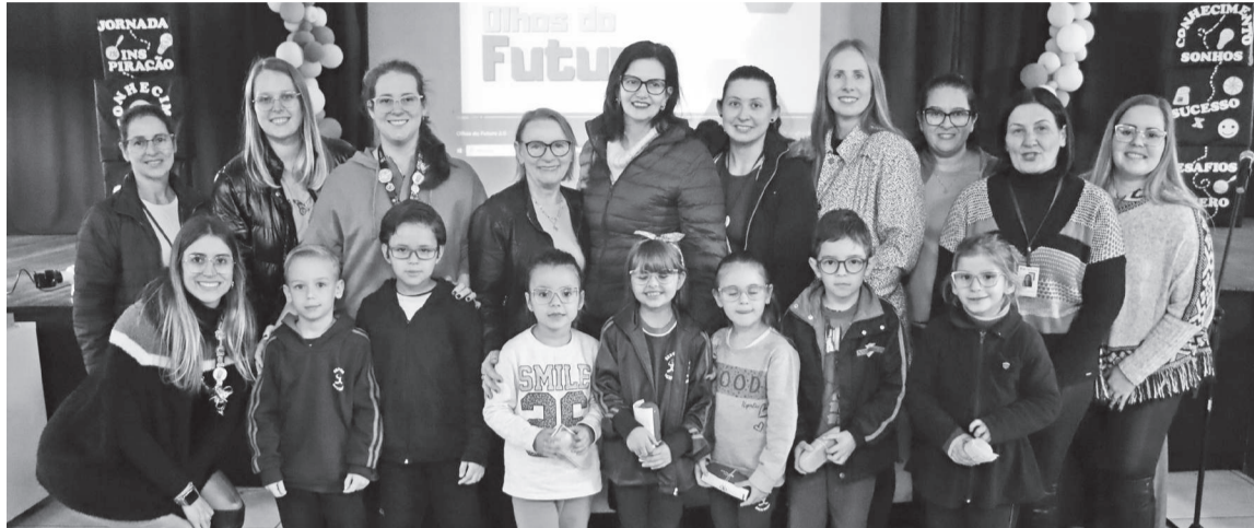
Grupo de alunos beneficiados com óculos de grau e parceiros do projeto