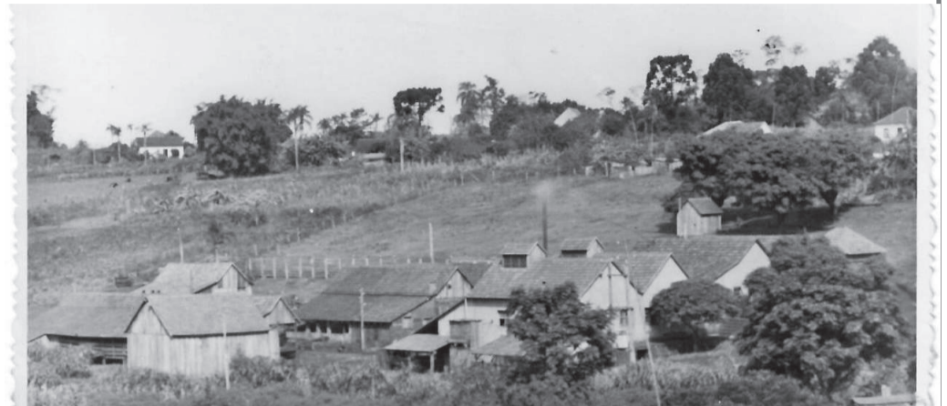
Instalações do Frigorífico Stahl localizadas no final da Rua Ijuí

Aos sábados, trabalhavam na limpeza das instalações e equipamentos, e, nesse dia, era costume fazer um churrasco para confraternização, momento no qual os funcionários se davam a liberdade de beber alguns goles de cachaça com mel, o que, de vez em quando, ajudava a causar algumas rugas entre os mais exaltados. Como era costume todos os funcionários