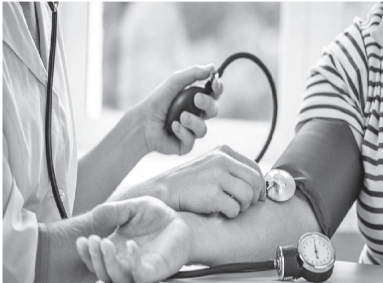
A hipertensão arterial sistêmica, quando não tratada adequadamente, vai gerando lesão em muitos outros órgãos, como olhos, os rins, o cérebro e coração

E os órgãos que mais sofrem com o descontrole da pressão arterial são os olhos, os rins, o cérebro e coração. Explico: a alta da pressão sanguínea afeta o funcionamento dos vasos da retina, e estes em um contexto de hipertensão arterial, passam por um processo de "adaptação" que a longo prazo altera o funcionamento da visão, a chamada retinopatia hipertensiva. O mesmo acontece com os vasos sanguíneos que irrigam os rins e o risco, neste caso, é prejudicar o funcionamento renal - a filtra-