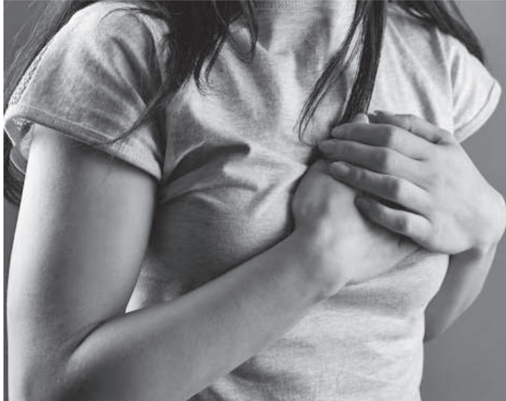
Doenças cardiovasculares podem ser prevenidas ou ter seus impactos muito reduzidos com algumas medidas simples, mas que muitas pessoas acabam deixando de lado

Doenças cardiovasculares matam 23 mil mulheres por dia no mundo ou oito vezes mais do que o câncer de mama