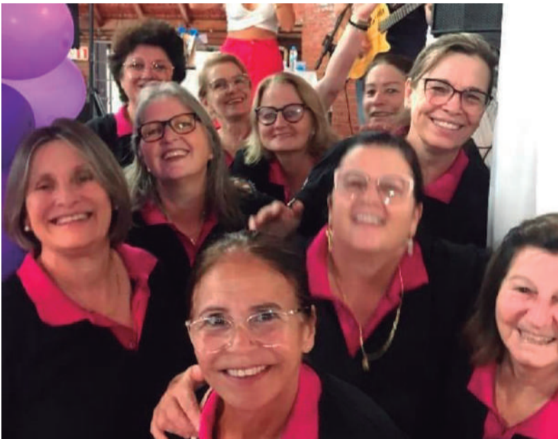
Clube de Mães da APAE de Três de Maio , Aqui Meu Filho É Mais Feliz. Elas que realizam um lindo trabalho na escola da Apae são exemplos de amor, dedicação e resiliência.