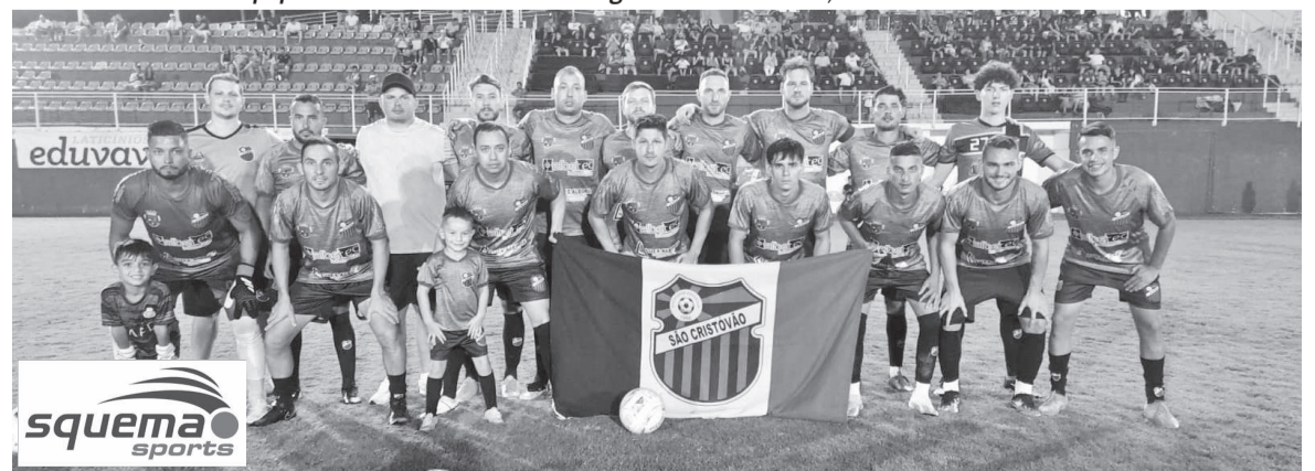
Equipe finalista da Libertadores Regional 2024: São Cristóvão, de Frederico Westphalen