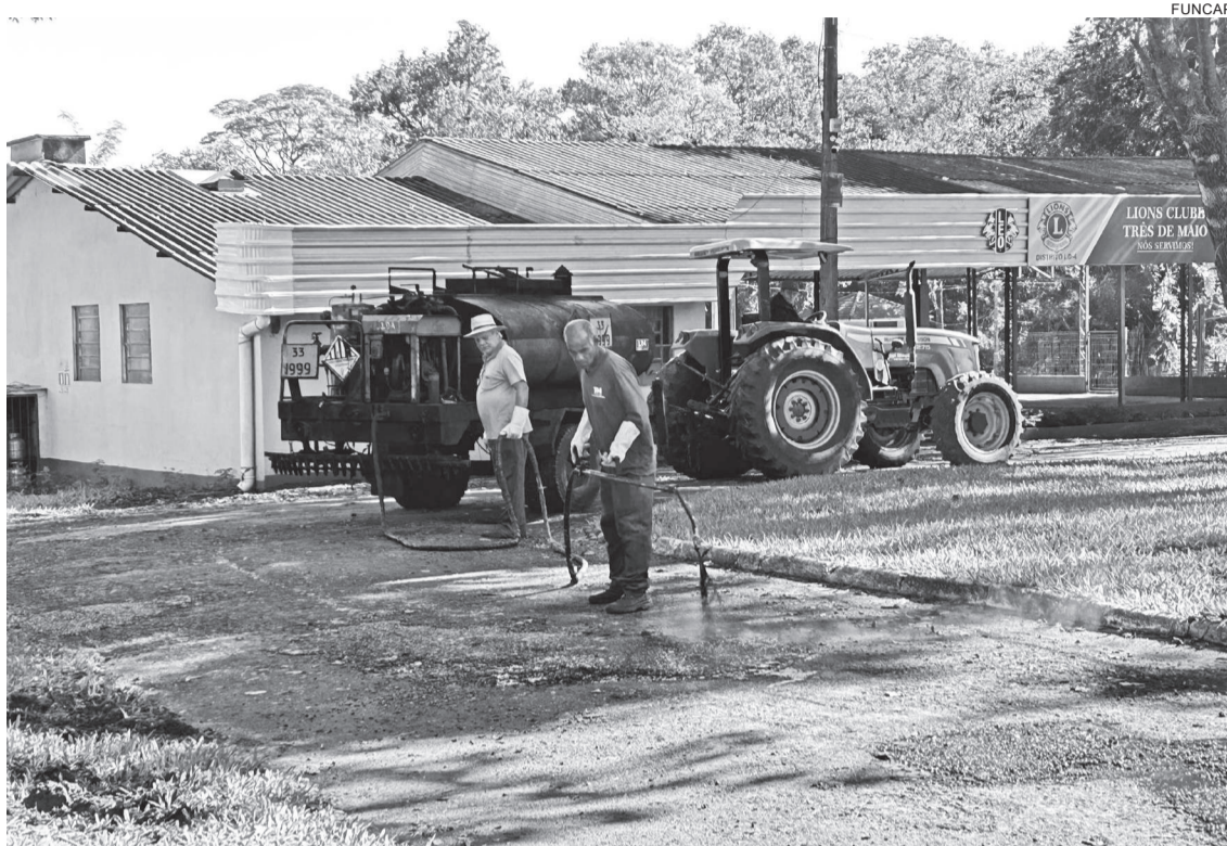
Equipes de infraestrutura estão nas ruas do parque fazendo a manutenção

Manutenção da pavimentação ocorre antes da abertura do espaço de eventos