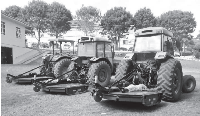
Equipamentos irão compor grupos de máquinas das localidades de Linha Central, Poço Traira e Linha Usina

A administração municipal de São José do Inhacorá adquiriu três roçadeiras, que foram destinadas aos três grupos de máquinas do município. As localidades beneficiadas incluem Linha Central, Poço Traira e Linha Usina, fortalecendo as operações agrícolas.