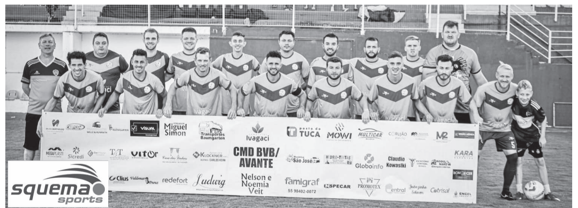
Equipe finalista da Libertadores Regional 2024: Avante, de Boa Vista do Buricá

Na preliminar, às 13h15, se enfrentam a Associação Três-Maiense - Botal X Celtic/Comercial , valendo a Taça da Primeira Liga.