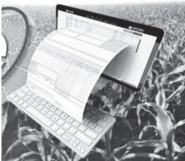
A medida vale para propriedade rural, independentemente do seu tamanho ou faturamento

Os produtores rurais de todo o país têm menos de 15 dias para se prepararem para o início da emissão obrigatória da Nota Fiscal de Produtor Eletrônica (NFP-e). A medida, que visa modernizar e simplificar o processo de emissão de documentos fiscais, estava prevista para 2023, mas foi prorrogada para entrar em vigor em 1º de maio deste ano pelo Conselho Nacional de Política Fazendária (Confaz).