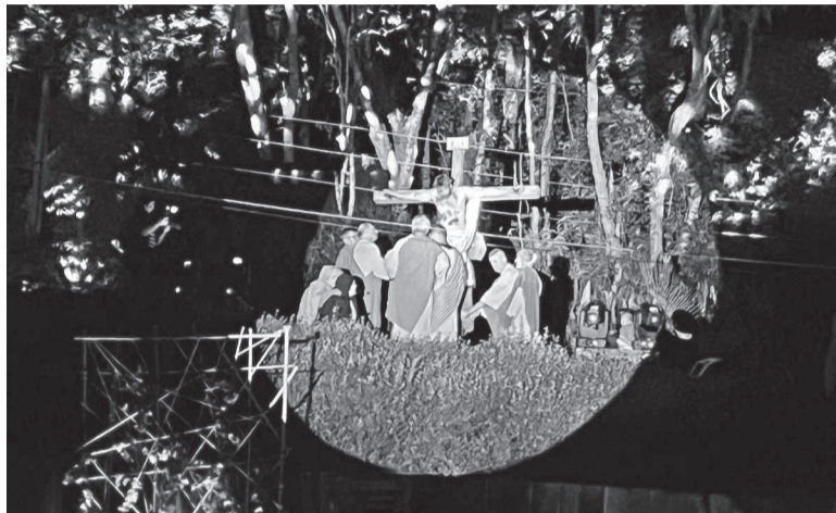
Crucificação de Jesus Cristo foi representada ao longo do espetáculo