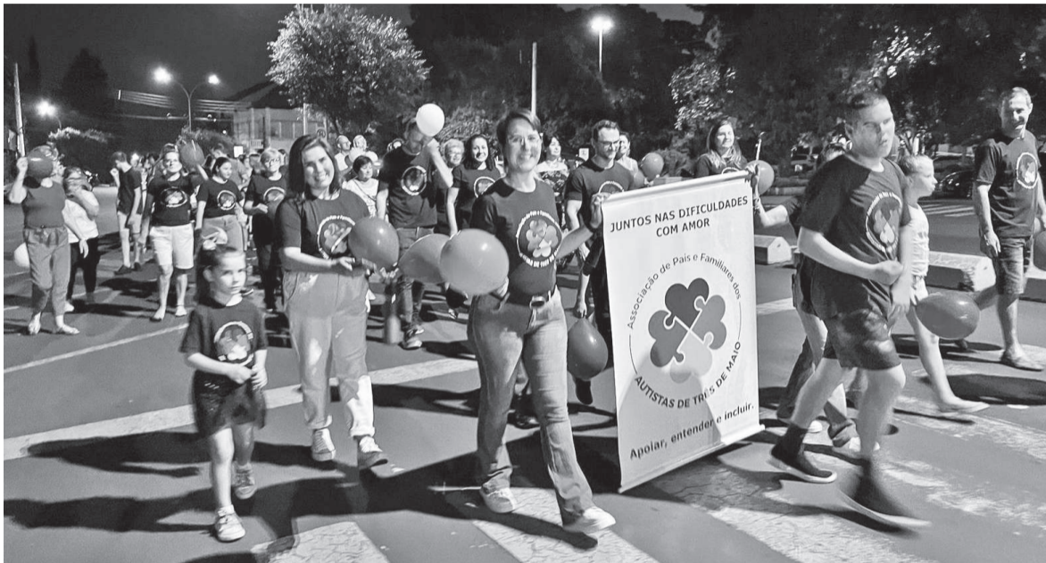
Na terça-feira foi realizada uma caminhada pela Avenida Uruguai com a participação de integrantes da associação, familiares e comunidade

Associação de Pais e Familiares dos Autistas de Três de Maio está realizando programação para dar mais visibilidade à causa