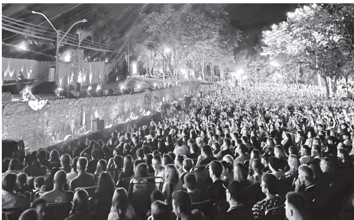
Encenação atraiu cerca de 5 mil fiéis ao Parque São Francisco de Assis - O Calvário

Após a chuva fraca que logo se desfez em frescor, os espectadores foram transportados para os eventos da Semana Santa, testemunhando a dramática história da paixão, morte e ressurreição de Cristo. "Foi uma experiência que tocou profundamente os corações e renovou a fé de todos os presentes", diz o coordenador.