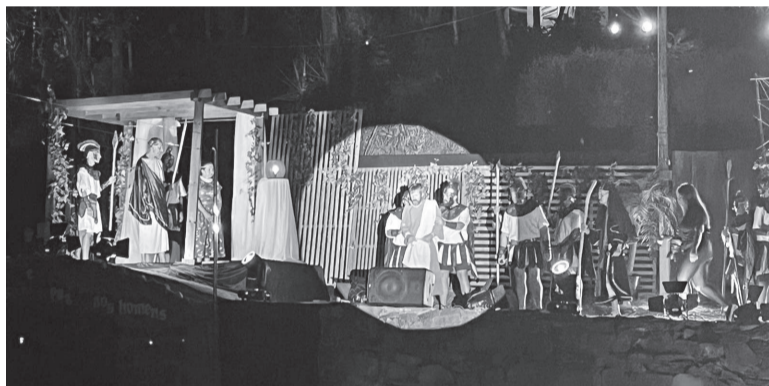
44ª edição da Encenação Paixão, Morte e Ressurreição de Cristo retratou momentos finais de Jesus Cristo na Terra

lo participaram mais de 80 voluntários da comunidade. "Neste ano a encenação atraiu mais de cinco mil peregrinos e fiéis, que chegaram de diversas partes em busca de penitência, agradecimento e momentos de reflexão. São pessoas de locais distantes, alguns que vieram a pé em grupos de peregrinos religiosos. Tivemos peregrinações de municípios da região, como também de lugares mais distantes. O Santuário tornou-se um local de encontro e de-