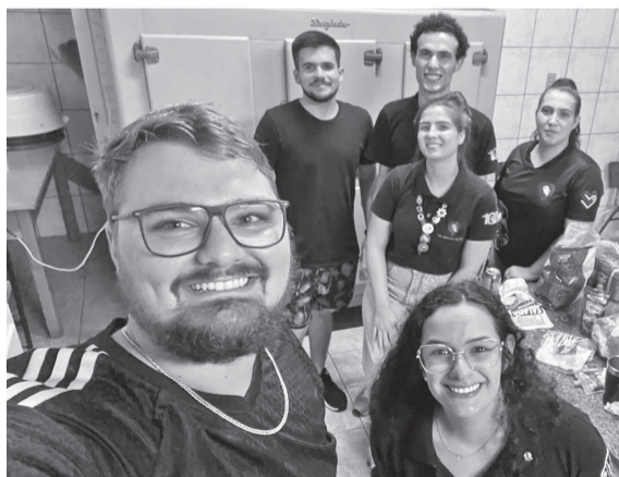
Alguns integrantes do Leo que ajudaram na organização do evento