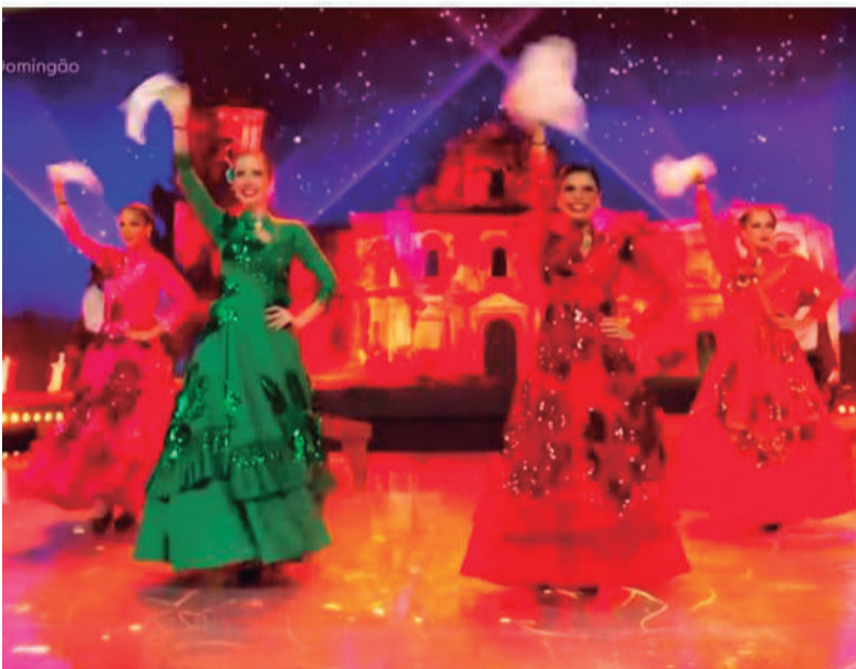
Dança dos Famosos - E a dança tradicional do Rio Grande do Sul , foi lindamente representada na dança dos famosos, no último domingo, dia 24, em um programa da Rede Globo. Motivo de orgulho, em ver parte das nossas tradições evidenciadas a nível nacional. A plateia aplaudiu de pé.