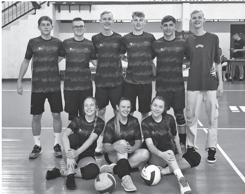
Equipe Banguela's é campeã da primeira edição do VôleiLEO, realizada no último sábado