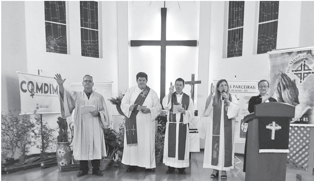
Dia Mundial da Oração reuniu quatro igrejas de Três de Maio no templo da Igreja IECLB

Dia Mundial da Oração abriu a programação do mês da mulher em Três de Maio