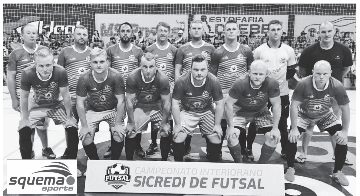
Juventude de Poço Traíra enfrenta o CBFC. Ambas equipes precisam da vitória para buscar a classificação