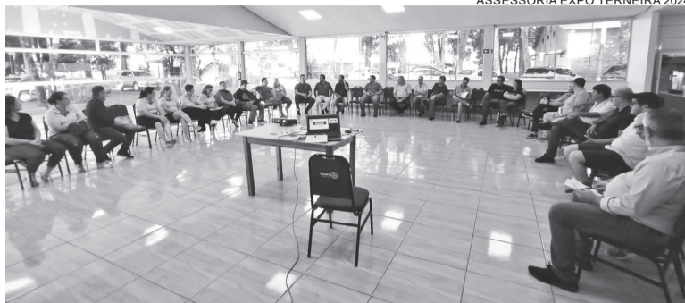
Comissões estão se reunindo para alinhar todos os detalhes para a realização da feira, que ocorre de 1º a 5 de maio no Parque de Exposições Germano Dockhom

A Comissão de Infraestrutura reforçou que tem trabalhado para melhorar a parte elétrica de alguns pavilhões e na troca do telhado do pavilhão 2, que, nas últimas edições, registrou goteiras. Dentro de poucos dias deve ocorrer a pintura e organização dos espaços para receber expositores e visitantes.