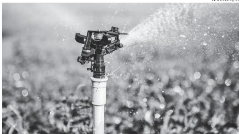
O programa é destinado a todos produtores rurais (pessoas físicas)

O Estado pagará a subvenção ao produtor rural em parcela única, após a execução do projeto (que pode ser financiado por instituições bancárias ou por recursos próprios)