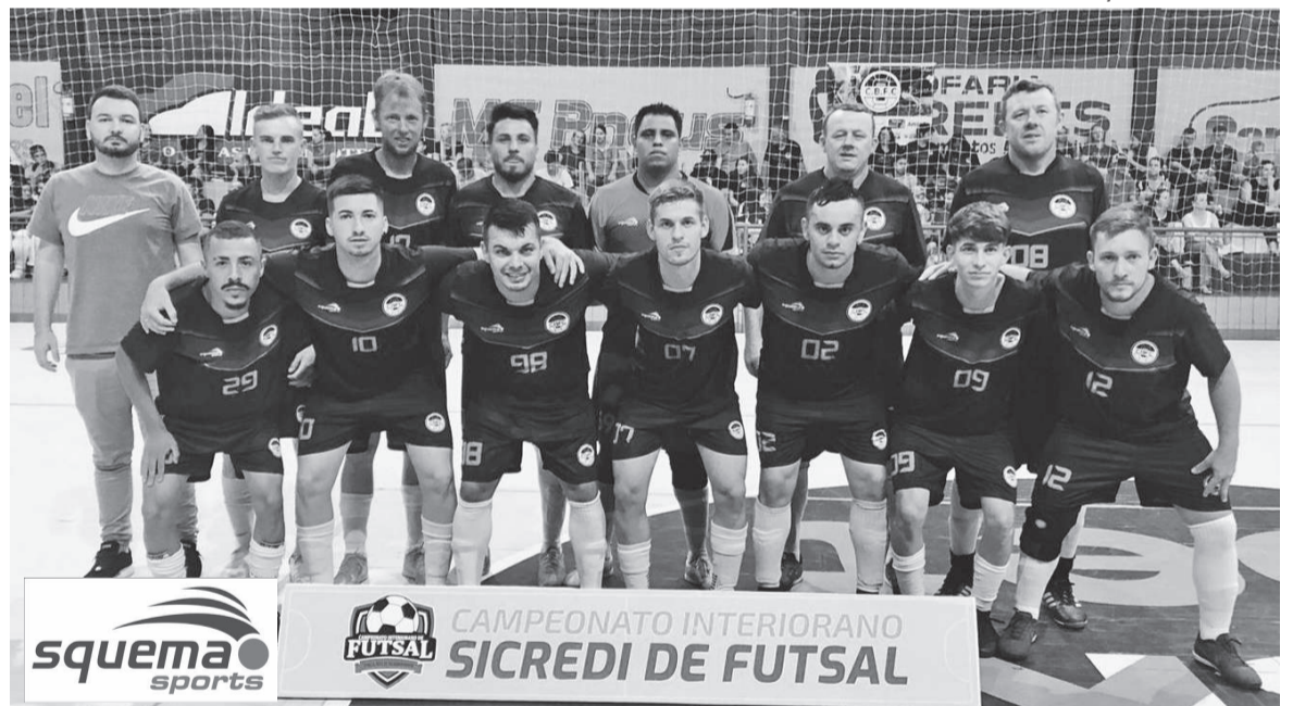
Equipe do CBFC, de Caúna Baixa, joga hoje pela Chave B do Interiorano. Jogo será contra o Juventude de Poço Traíra