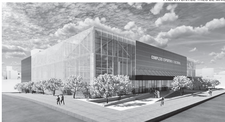
Todo o complexo prevê investimento de R$ 12 milhões

Tal decisão judicial ocorre após uma ação movida por um grupo de moradores do bairro que são contrários à remoção das árvores da praça Osvaldo Fleck para a construção de um complexo. A justiça estipulou multa diária ao município, no valor de R$