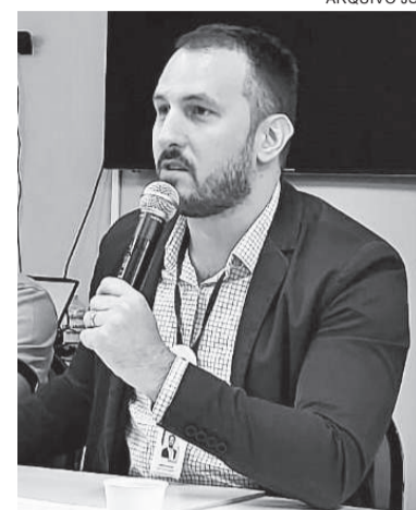
Prefeito de Três de Maio, Marcos Corso

Corso também reforça que haverá a compensação das árvo-