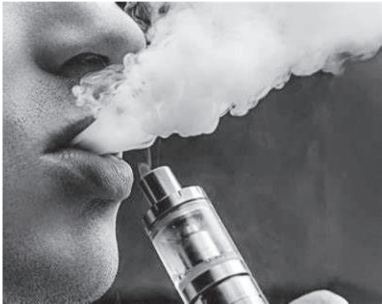
Comercialização, publicidade e importação de dispositivos eletrônicos para fumar são proibidos no Brasil

Mesmo com a venda proibida no Brasil, uma pesquisa feita pela Universidade Federal de Pelotas revelou que no ano de 2022, um em cada cinco jovens com idade de 18 a 24 anos - quase 20% da faixa etária - era usuário de cigarros eletrônicos.