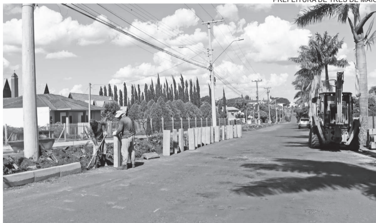
PREFEITURA DE TRÊS DE MAIO

A obra tem investimento de R$ 4,1 milhões e visa melhorar a circu-