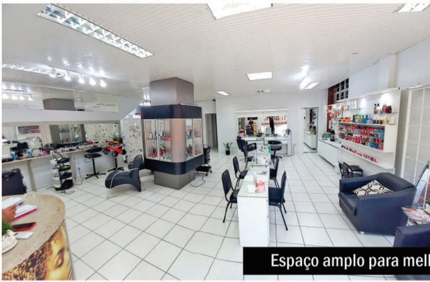
Espaço amplo para melhor atender nossos clientes