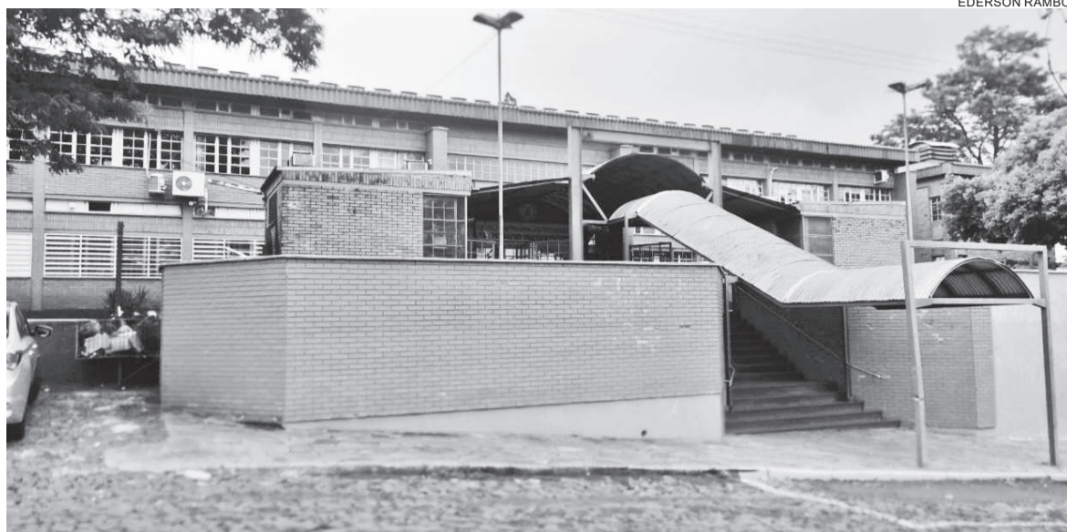
A Escola Estadual Professora Glória Veronese (CIEP) com uma média de 200 alunos matriculados, em 2022 passou a ser uma escola sob a manutenção do município

Quando questionada sobre as variações no número de matriculados ao longo do período, a coordenadora explicou que isso se deve principalmente à mudança de manutenção de escolas e à redução do número de alunos em algumas instituições. “Dois exemplos recentes temos em Três de Maio. A Escola Estadual de Ensino Fundamental Beno Meurer, que teve sua manutenção alterada em 2018 e se tornou a Escola Municipal de Ensino Fundamental Bem Viver Caúna, e a Escola Estadual de Ensino Fundamental Professora Glória Veronese (CIEP), que em 2022 passou a