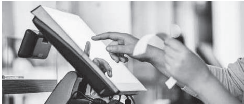
Desde 1º de janeiro de 2024 é obrigatório que a NFC-e seja emitida de forma automática e integrada aos meios de pagamento. Isso significa que os dois documentos – o comprovante de pagamento e a nota – devem ser gerados pelo mesmo equipamento

A mudança começou em abril de 2023 para supermercados, hipermercados e minimercados com faturamento superior a R$ 1,8 milhão no ano anterior. Ao longo