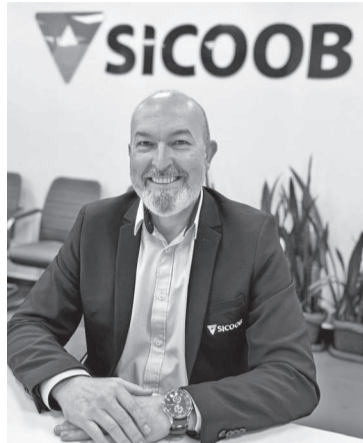
Schmitt considera que montante de R$ 20 milhões representa trabalho de gestão e preocupação com o cooperado