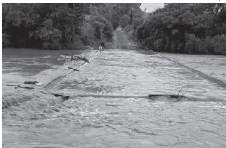
As chuvas intensas de terça e quarta-feira, ocasionaram a cheia no Rio Buricá. A ponte de concreto entre Alpargatas e Caúna Baixa, construída recentemente, ficou submersa pelo volume de água

O mês de Outubro se destacou como o mais chuvoso do ano, atingindo o recorde de 648 milímetros, marcando o maior valor pluviométrico em um único mês registrado pela Comanja