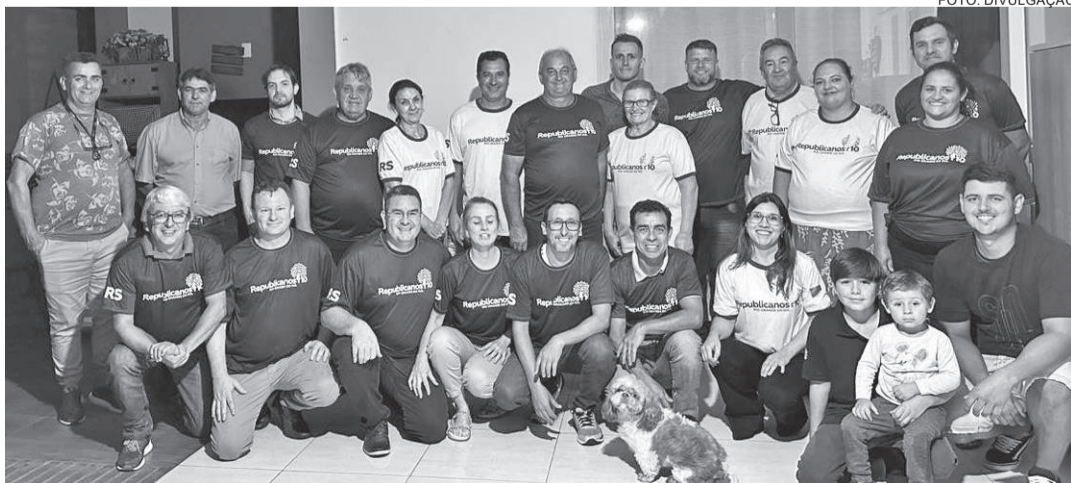
Evento contou com lideranças, membros e simpatizantes da sigla. Republicanos estuda ter candidatura à prefeitura nas próximas eleições municipais de Independência