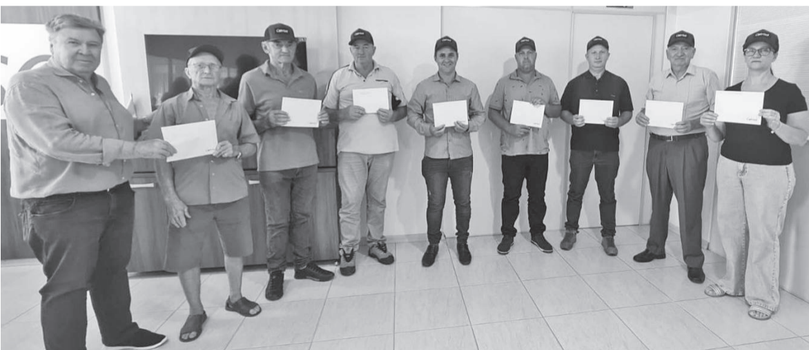
Presidente Walter Vontobel com alguns dos contemplados com a vale-compras no valor de R$ 2.500 cada um