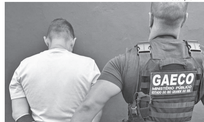
Homem apontado como autor de homicídio foi preso nessa semana

O crime foi motivado por desavenças envolvendo organização criminosa que atua na região. O homicídio ocorreu em uma estrada vicinal na localidade de Nossa Senhora do Carmo e o corpo da vítima foi deixado no local.