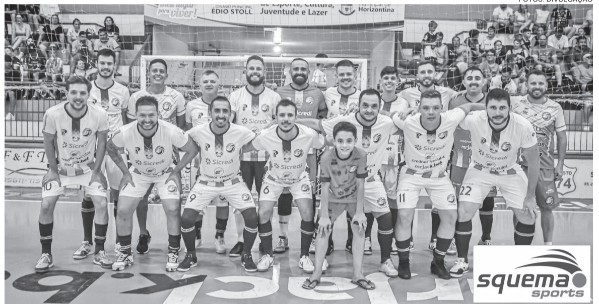
Atletas do Crednor Futsal que disputaram o Jogo das Estrelas. Jogo ficou empatado em 6 a 6

Crednor Futsal e Atlético de Horizontina realizaram, no domingo, 14, no Ginásio Edio Stoll, em Horizontina, um jogo reunindo craques do futsal gaúcho defendendo as cores das duas equipes com a presença do Rodrigo Capita, que jogou meio tempo para cada equipe. Um grande nome do futsal brasileiro, tricampeão da Liga e campeão mundial de futsal em 2012. O futsal também movimentou as categorias de base sub-7, 9, 11 e 13, com o confronto entre Crednor Futsal X Pumas Futsal .