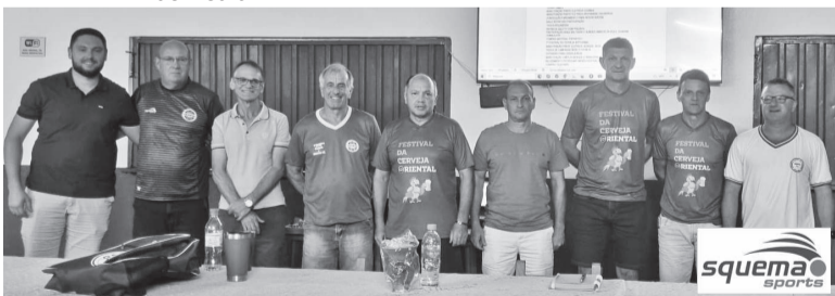
Integrantes da antiga e nova diretoria do Oriental