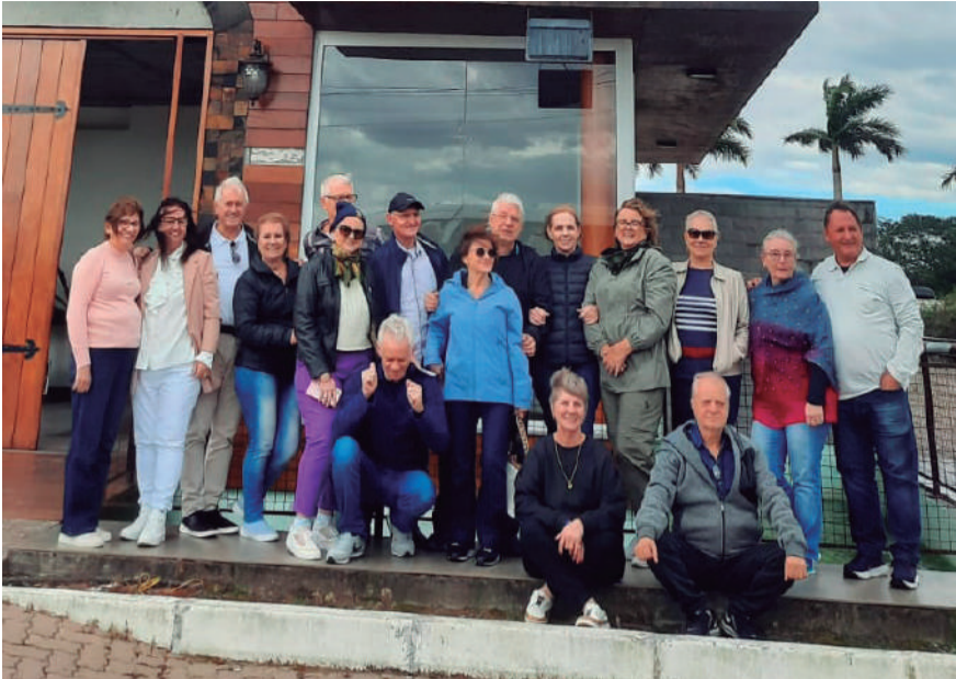
A Turma 74, do Colégio Pio XII, há tempos vem se reunindo em encontros anuais. Nos dias 3, 4 e 5 de novembro, foi realizado mais um encontro, desta vez, na cidade de Santo Antônio da Patrulha, para marcar os 49 anos de formatura. Foi um encontro de muita alegria, descontração, afeto e lembranças dos tempos vividos, dando um sentido especial à essa turma que construiu laços de amizade, que se fortalecem apesar do tempo e da distância