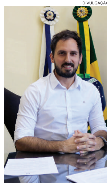
Prefeito Marcos Corso

Embora o índice de investimentos tenha sido modesto (0,3619), o prefeito enfatiza que os investimentos foram cuidadosamente escolhidos para garantir máximo retorno social e econômico. “Priorizamos investimentos em saúde, educação e manutenção, fundamentais para a