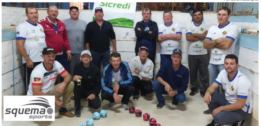
Equipe São Luís, de Manchinha