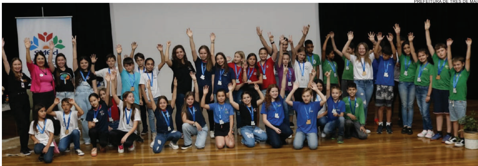
Estudantes das turmas do 4º e 5º anos da rede municipal de ensino participaram do Tech Oscar 2023, quando receberam medalhas pela participação no programa de Letramento em Programação

Município foi um dos 13 municípios do Estado a atender requisitos para certificação. A conquista da certificação, ocorre pelo segundo ano consecutivo