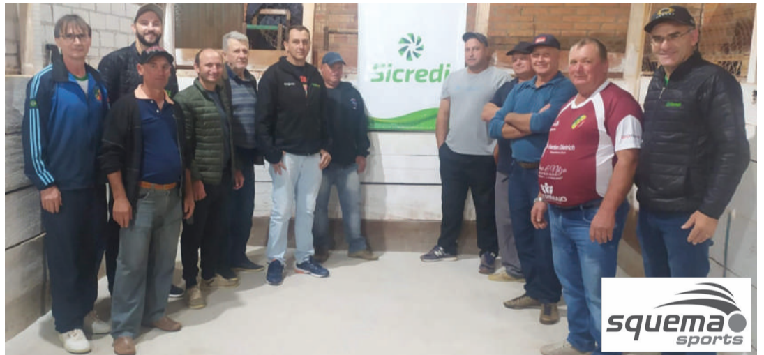
Equipe de Esquina Bado