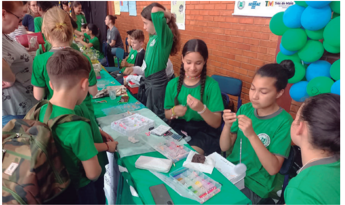
Alunos de 1º ao 9º anos das escolas Caminhos Inovadores, Bem-Viver Caúna, Frederico Lenz e Francisco Salles Guimarães participaram da feira