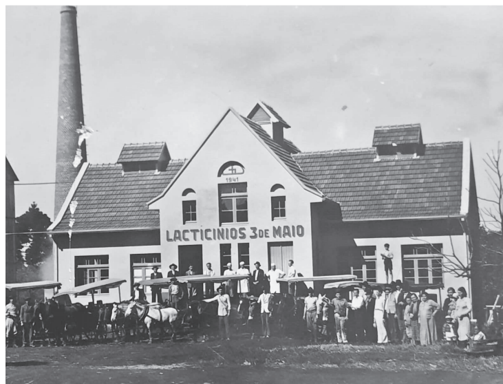
A Laticínios 3 de Maio iniciou suas atividades em 18 de agosto de 1941