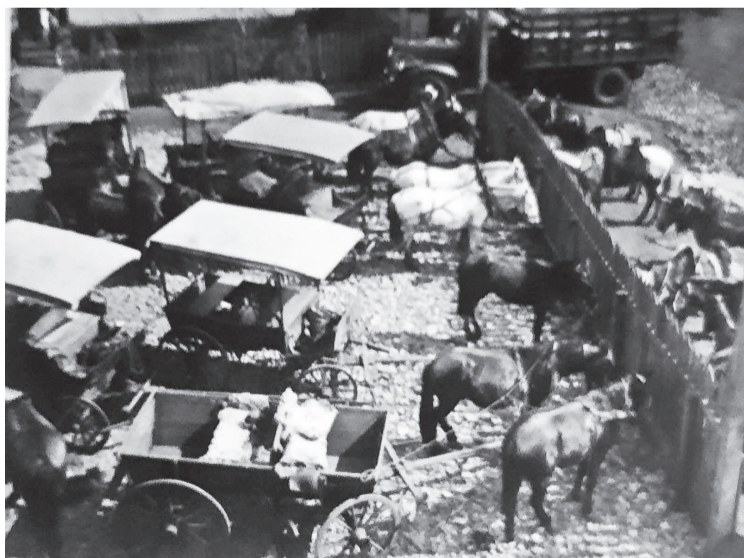
Carroças que traziam leite para a Laticínios 3 de Maio ficavam estacionadas ao lado da fábrica

Em 1974, foi eleito presidente do Rotary Club de Três de Maio. Edivaldo Stieglmeier veio a falecer no dia 13 de março de 1998, tendo posteriormente sido homenageado pela municipalidade, batizando o Estádio Municipal de Três de Maio como Estádio Municipal Poliesportivo Edivaldo Stieglmeier.