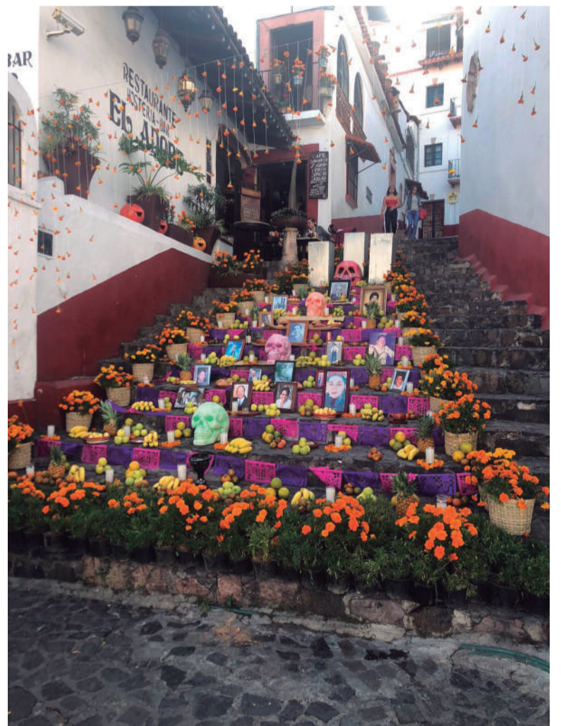
O país possui uma tradição no Dia dos Mortos. Famílias preparam oferendas destinadas aos mortos em frente às suas casas ou comércio