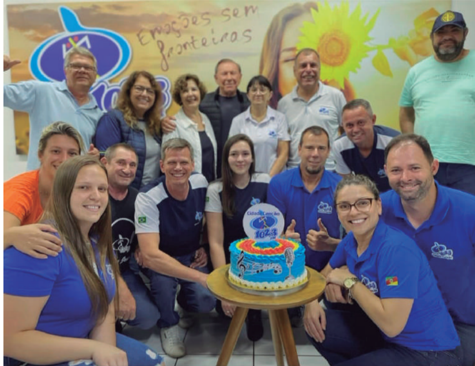
Vivas para a família Casali e equipe da Rádio Cidade Canção pelos 35 anos, comemorados no último dia 13. Parabéns!