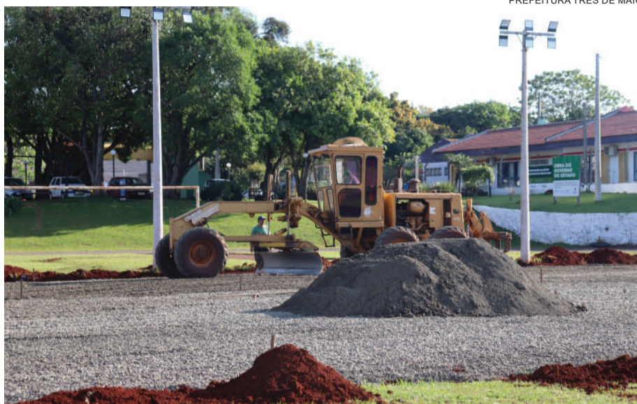
Campo de futebol society está sendo construído no Centro Poliesportivo

De acordo com a prefeitura, mais obras serão realizadas em conformidade ao cronograma, como quadra de vôlei de areia, melhorias na infraestrutura, entre outras.