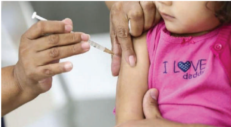
Campanha é voltada para a população de 0 a 14 anos, 11 meses e 29 dias

No período de 14 a 27 de outubro, o governo municipal de Três de Maio, por meio da Secretaria de Saúde, estará realizando a Campanha de Multivacinação. A ação tem início amanhã, na Unidade Central de Saúde das 8h às 13h, e é voltada para a população de 0 a 14 anos, 11 meses e 29 dias.