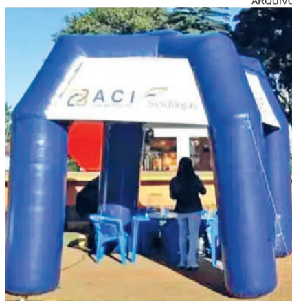
Notas fiscais emitidas desde o dia 19 de setembro até amanhã, dia 14 de outubro, podem ser trocadas por cautelas

Além das premiações da Tenda, serão sorteados os prêmios da Campanha do Dia da Criança, que totalizam R$ 15 mil em vales-compras.