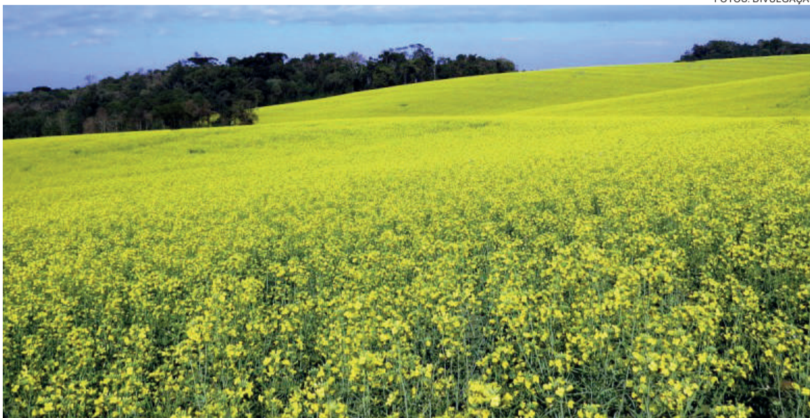
Canola tem se tomado uma ótima alternativa para rotação de culturas de inverno

Semeadura e colheita são fatores fundamentais para a produtividade. “É preciso entender muito bem os processos e dominá-los. A densidade e a boa distribuição de plantas na área é fundamental para o potencial de rendimento. Já na colheita, deve ser feita em momento adequado sob pena de ocorrer muita perda por debulha, demandando ajustes específicos nas co-