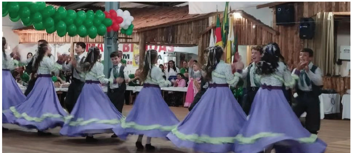
O CTG três-maiense alcançou o primeiro lugar em cinco categorias: melhor coreografia de entrada nas invernadas Xirú e Juvenil, e o primeiro lugar na categoria das Danças Tradicionais nas invernadas Mirim, Juvenil e Xirú