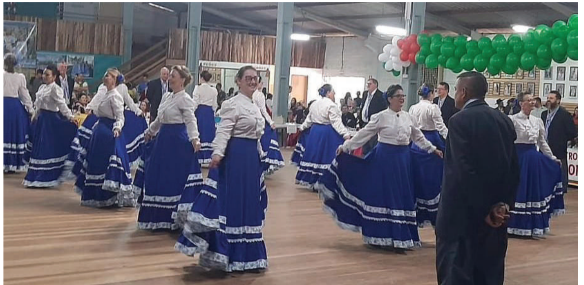
O CTG Tropeiros do Buricá fez bonito no evento. Foram três categorias de dança, totalizando 90 participantes