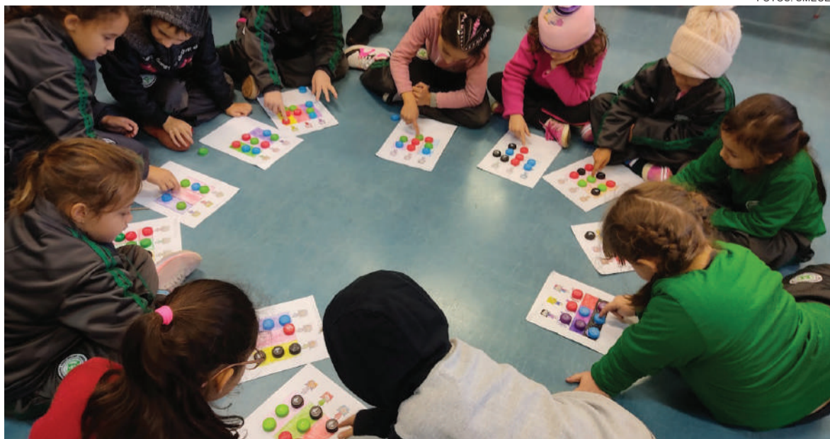
Atividades desplugadas com os Anos Iniciais

As aulas são online e presenciais no polo UAB, às terças-feiras. Os estudantes do 6º ao 9º ano também participam da atividade do Livro dos Aventureiros. “Em cada aula de Linguagem Computacional nós fazemos as missões. Nós precisamos salvar o 01, que é um robô que perdeu a memória. Ao longo dessas missões, nós vamos tentando recuperar a memória do 01”, contou Renan.