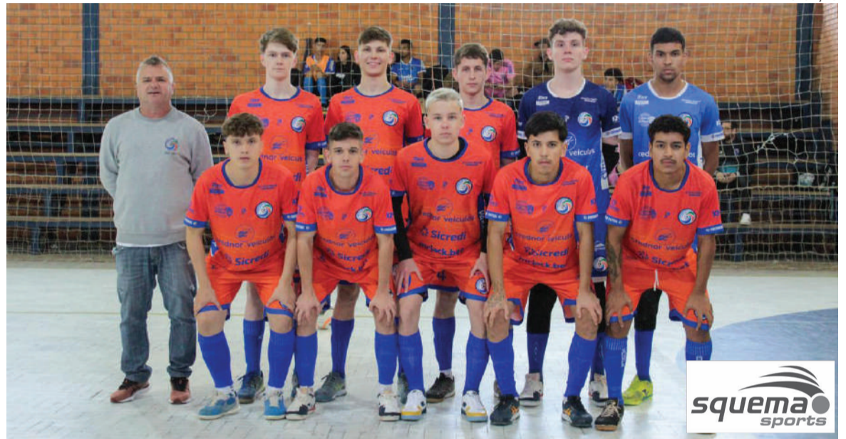
Equipe da Crednor/Atelc sub-18