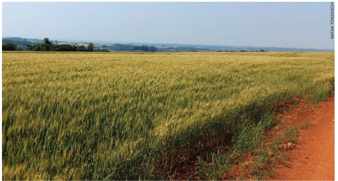
Lavouras de trigo têm registrado desenvolvimento abaixo do esperado devido ao excesso de chuvas das últimas semanas

O extensionista lembrou que o Governo Federal acenou com um auxílio de R$ 400 milhões para ajudar na comercialização de trigo. Conforme o Ministério da Agricultura, a medida serve para apoiar produtores para a comercialização de cerca de 1,5 milhão de toneladas de trigo e que visa suprir a comercialização aos produtores para o valor mínimo da saca. “Mas não se sabe como será este recurso. Se será destinado ao produtor ou para as empresas e cooperativas que comercializam. É um cenário de muitas incertezas. Mais uma vez, o produtor deverá ficar sem lucratividade em sua atividade”, avalia.