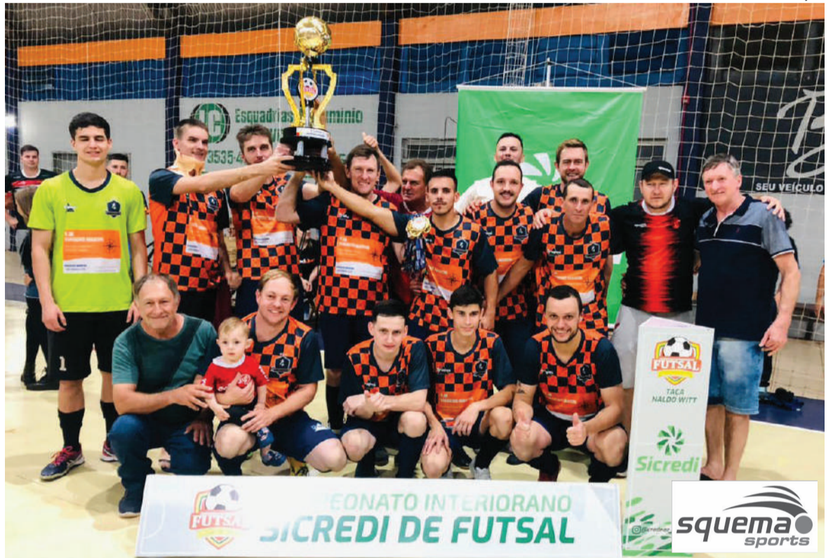
Equipe campeã do Interiorano de Futsal: Juventude, de Bela Vista