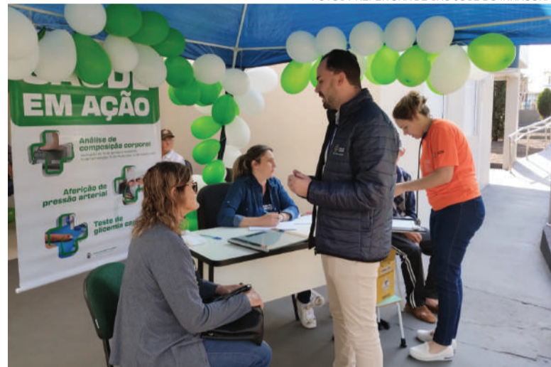
1º Saúde em Ação ocorreu na UBS de São José do Inhacorá