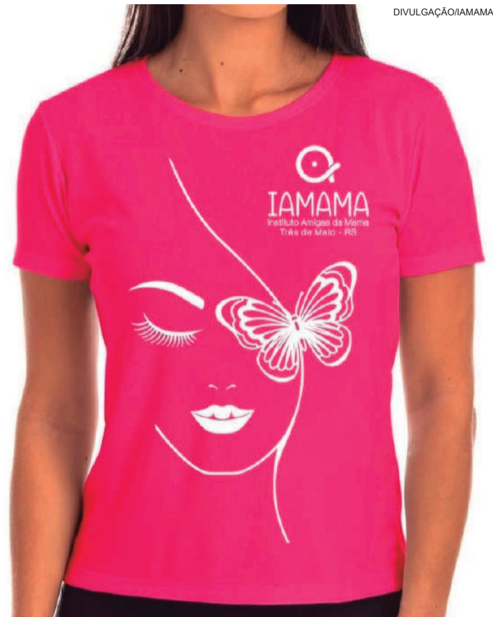
IAMAMA está confeccionando novas camisetas com a logomarca do instituto

“As nossas maiores entradas de recursos são através da venda das camisetas e do Lanche Rosa. Também há pessoas que fazem pequenas doações. Mas, para nós, se tornaria inviável manter esses repasses, até pela nossa realidade ser bem diferente da de Porto Alegre”.