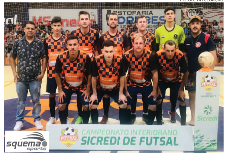
Equipe finalista: Juventude

Será a última partida da fase classificatória nas categorias sub-8, 10, 12 e 14. As categorias de base do Oriental tem o apoio do Fundo Social Sicredi.