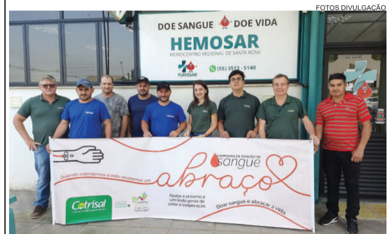
Funcionários da Cotrisal fizeram doação de sangue no Hemocentro Regional

COTRISAL – Funcionários da cooperativa da região Noroeste fizeram doação de sangue no Hemocentro em Santa Rosa. A ação faz parte das atividades da CIPA. Participaram da ação, funcionários das unidades da Cotrisal de Três de Maio, Alegria, São Caetano, São José Inhacorá e Independência.