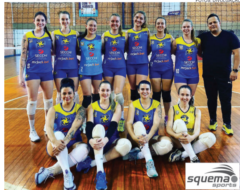
Equipe Horizontina Voleibol, campeã da categoria feminina da etapa da LGV realizada em Três de Maio