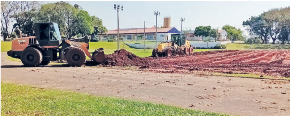
Quadra de futebol society será no meio da pista de caminhada. Nova iluminação já foi concluída

Iniciaram na semana passada as obras de modernização do centro poliesportivo de Três de Maio. Conforme a Coordenadoria de Esportes do município, o espaço contará com uma quadra de futebol society , de grama sintética (etapa que está sendo realizada atualmente), e mais duas quadras de areia.