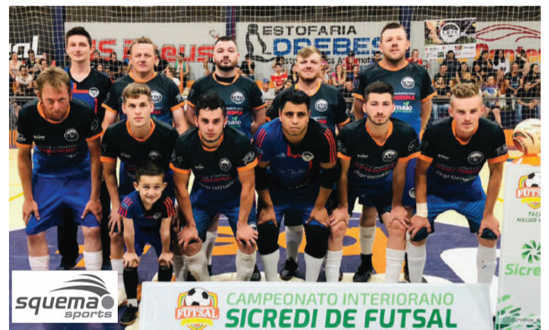
Equipe finalista: CBFC