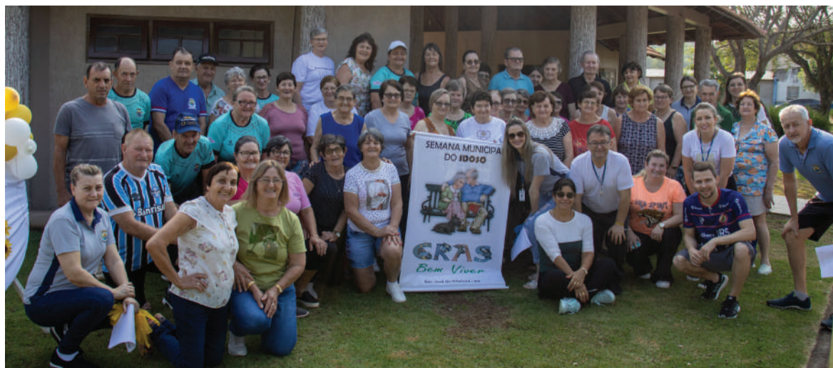
Idosos participaram da 1ª Gincana Municipal do Idoso, que integrou a Semana Municipal do Idoso de São José do Inhacorá

A programação teve ainda jogos de integração de câmbios dos grupos de São José do Inhacorá, Nova Candelária, Boa Vista do Buricá e Três de Maio, realizado na segunda-feira, dia 25, no Ginásio Poliesportivo.