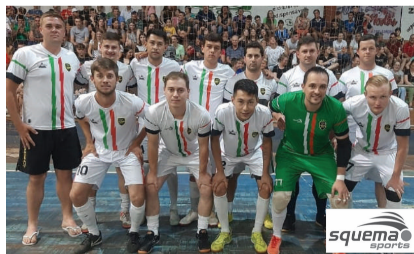
São Valentim, equipe campeã do Interiorano 2023, empatou em 1 a 1 e nos pênaltis venceu por 5 a 4