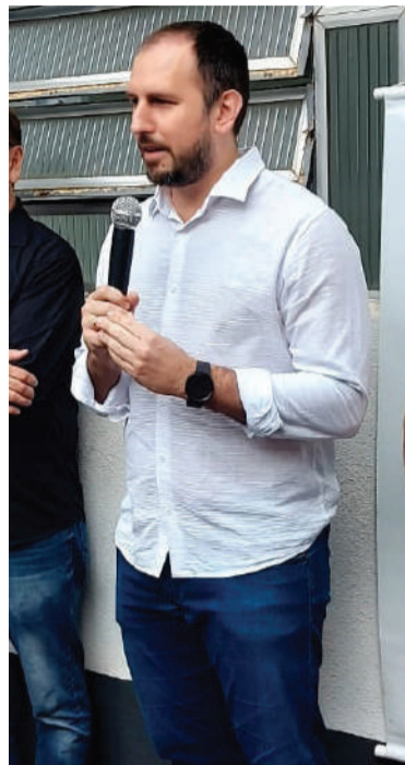
Prefeito Marcos Corso

O prefeito adianta que o próximo projeto da área da saúde deve ser um programa voltado aos pacientes acamados do município. “Havia a necessidade e o pedido da população e pudemos ampliar os serviços de saúde, além de efetuar novas políticas que devem ser implantadas em breve, como o atendimento às