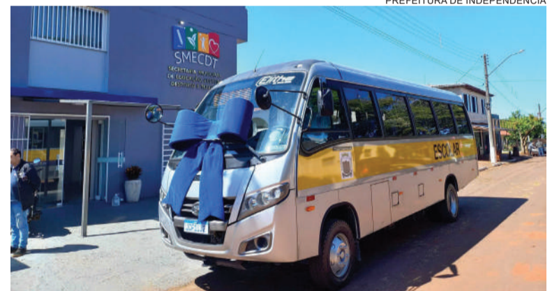
De acordo com a SMECDT, veículo custou R$ 640 mil e foi adquirido com recursos próprios do Município

Os investimentos contemplam, ainda, a segurança dos alunos, com a aquisição de cadeirinhas