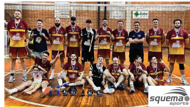
AVT Vida & Aconchego, equipe masculina campeã da etapa da LGV realizada em Três de Maio

No último final de semana, Três de Maio foi sede de uma etapa da Liga Gaúcha de Vôlei – LGV. As partidas ocorreram no Ginásio do Colégio Cooper Dom Hermeto.