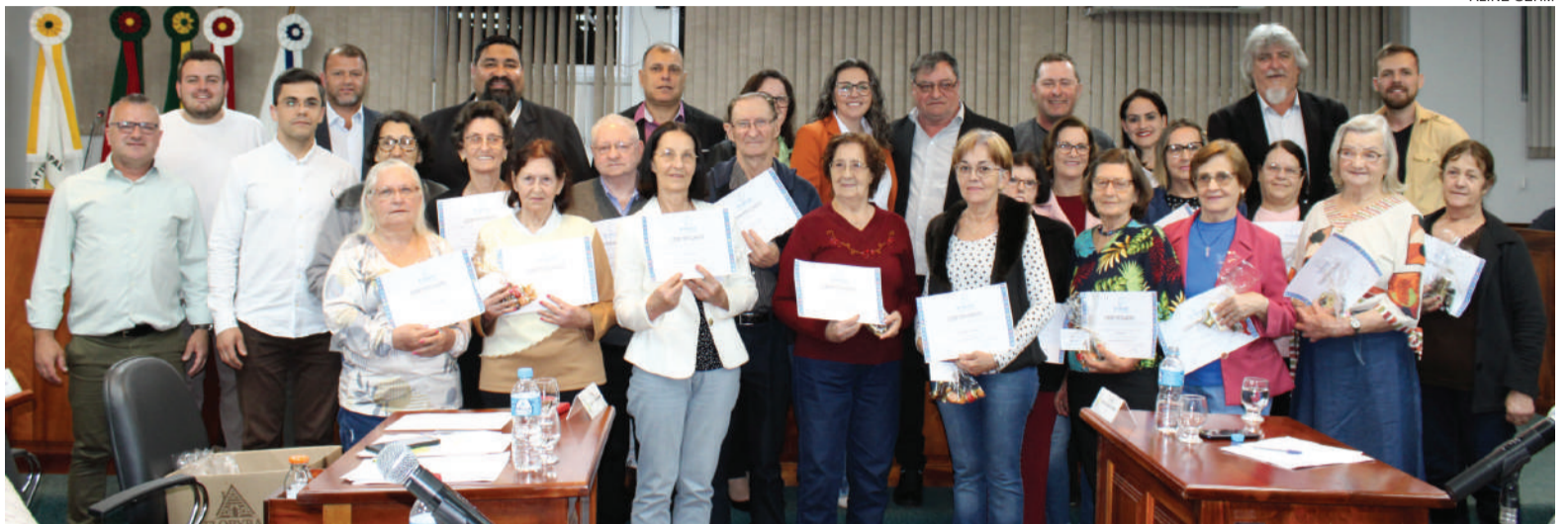
Após a sessão de quarta-feira, com a participação dos idosos, foram entregues os certificados aos formandos do curso "Mundo Digital Descomplicado: um guia para a Melhor Idade", realizado pela Secretaria, em parceria com a E-ducar

Já na Sessão Ordinária da Câmara Municipal, realizada à noite, 11 vereadores idosos sentaram-se ao lado dos vereadores e, inclusive, puderam se manifestar na Tribuna, no espaço das livres manifestações. Já a assistente social