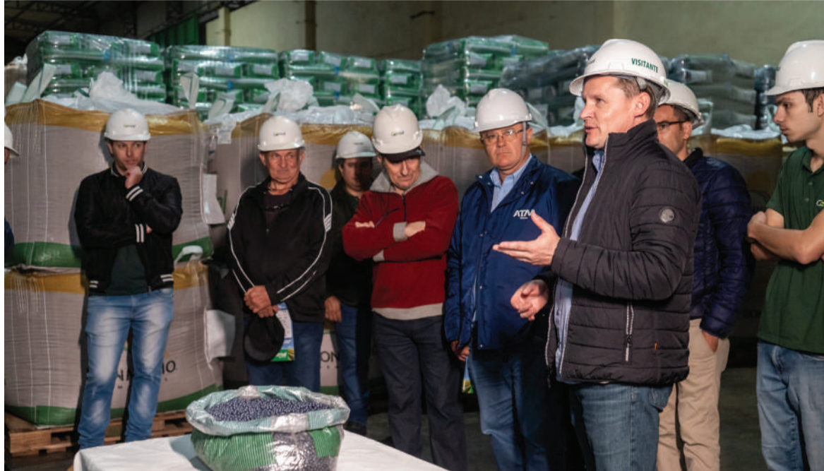
Associados conheceram desde as etapas de avaliação à campo, recebimento, pré-limpeza e armazenamento, rastreabilidade, beneficiamento, tratamento industrial das sementes, ensaue, expedição e laboratório

Durante duas semanas, a Unidade de Beneficiamento de Sementes (UBS) da Cotrisal, em Sarandi, recebeu mais de 450 associados de todas as filiais da cooperativa.