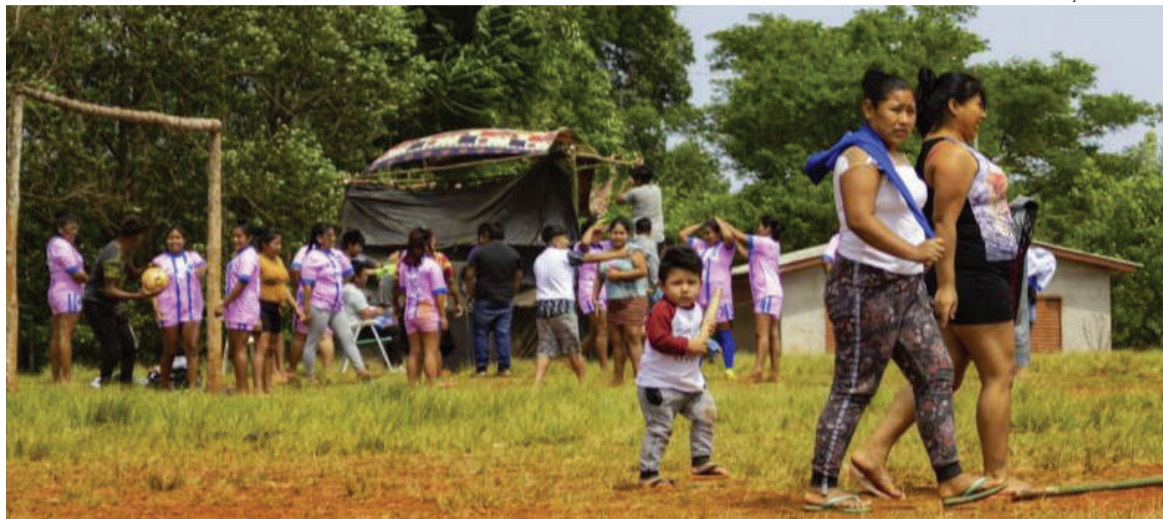
São Valério do Sul é o município gaúcho com o maior percentual de população indígena. Dos 2.543 residentes no município, 1.237 são indígenas

Dos 48 indígenas, 70% estão em Santa Rosa, 34 residentes, que também tem a maior concentração em relação a sua população total, ou seja, 0,04% dos moradores santa-rosenses. Três de Maio, registrou apenas três indígenas residentes.