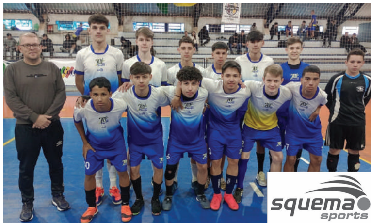
Equipe finalista no futsal juvenil masculino: Cardeal Pacelli

No voleibol, os jogos se realizaram na tarde de ontem. Os resultados, na próxima semana.