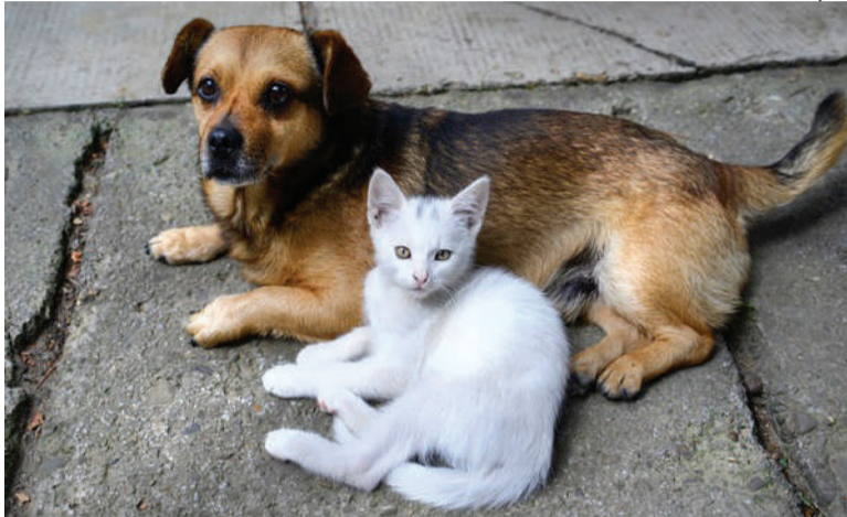
Cachorras e gatas serão atendidas com ação promovida pela prefeitura de Três de Maio e Anjos do Bem

A Secretaria de Agricultura de Três de Maio está com inscrições abertas para cadastro de cachorras e gatas. O prazo para inscrição encerra hoje, dia 15.