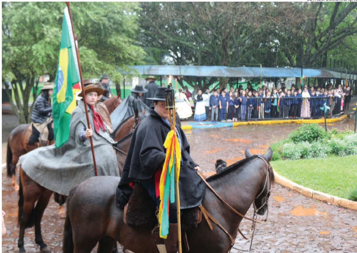
Na quarta-feira, dia 13, a Chama Crioula foi distribuída para as escolas de Três de Maio. No registro, a chegada da chama na Setrem