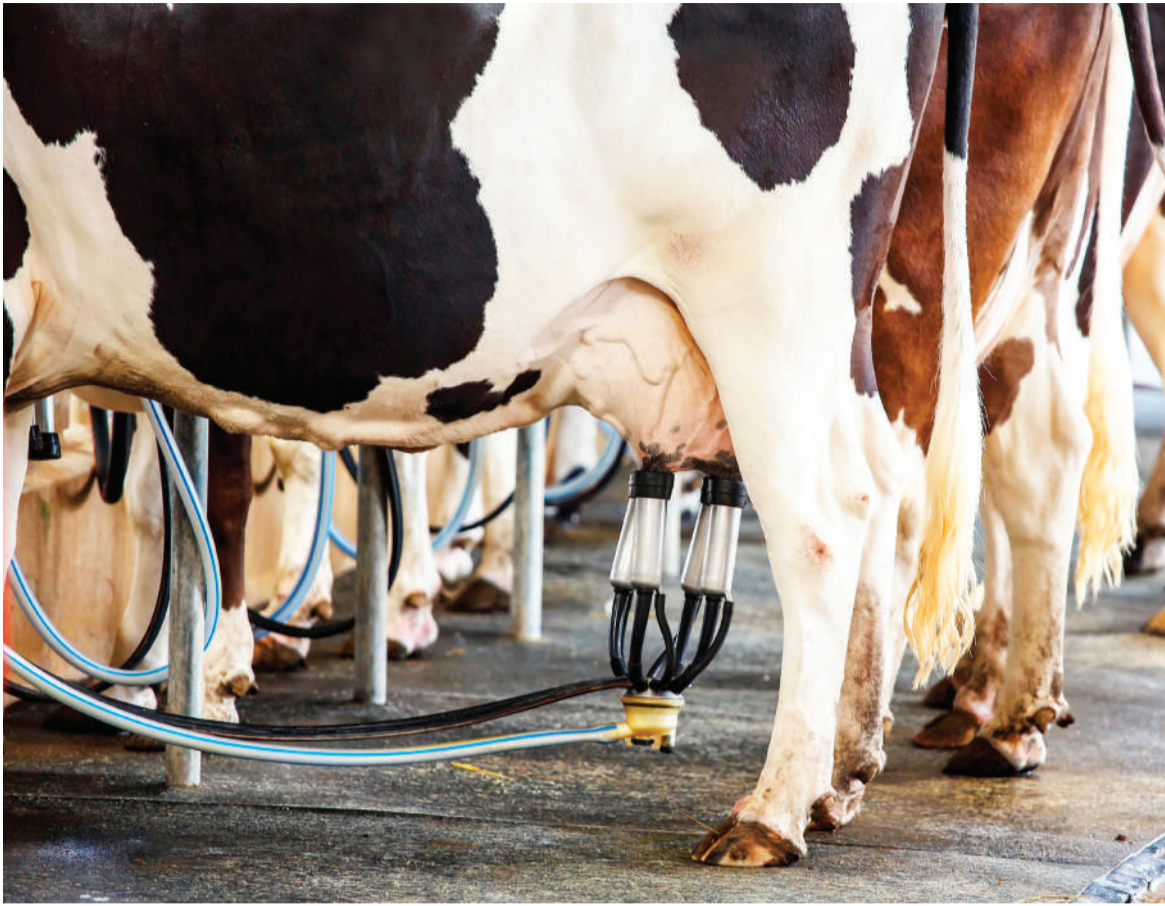
De 2010 a junho de 2023, a produção leiteira no município de Três de Maio caiu de 140 mil litros diários para 85 mil