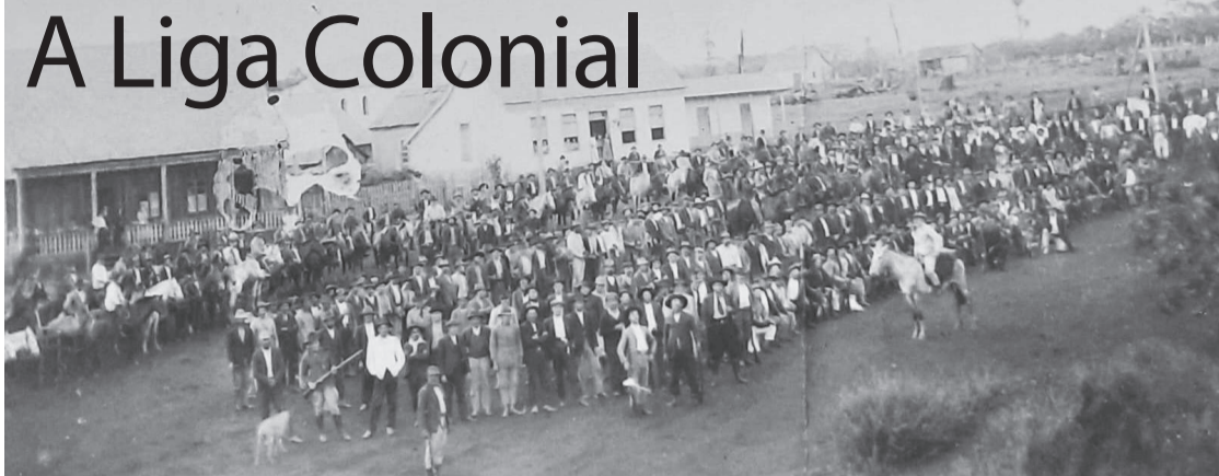
Liga Colonial de Três de Maio, em 1923. Atrás, o Hotel Laufer e a Farmácia Schünke.

Com a quinta recondução de Borges de Medeiros à presidência do Estado, no dia 25 de janeiro de 1923 deu-se início a mais uma guerra civil no Rio Grande do Sul.