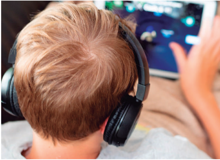
Pais devem limitar o uso do celular dos filhos e observar o que eles estão acessando na internet. E principalmente, não delegar a educação dos filhos para influenciadores digitais, como youtubers e tiktokers