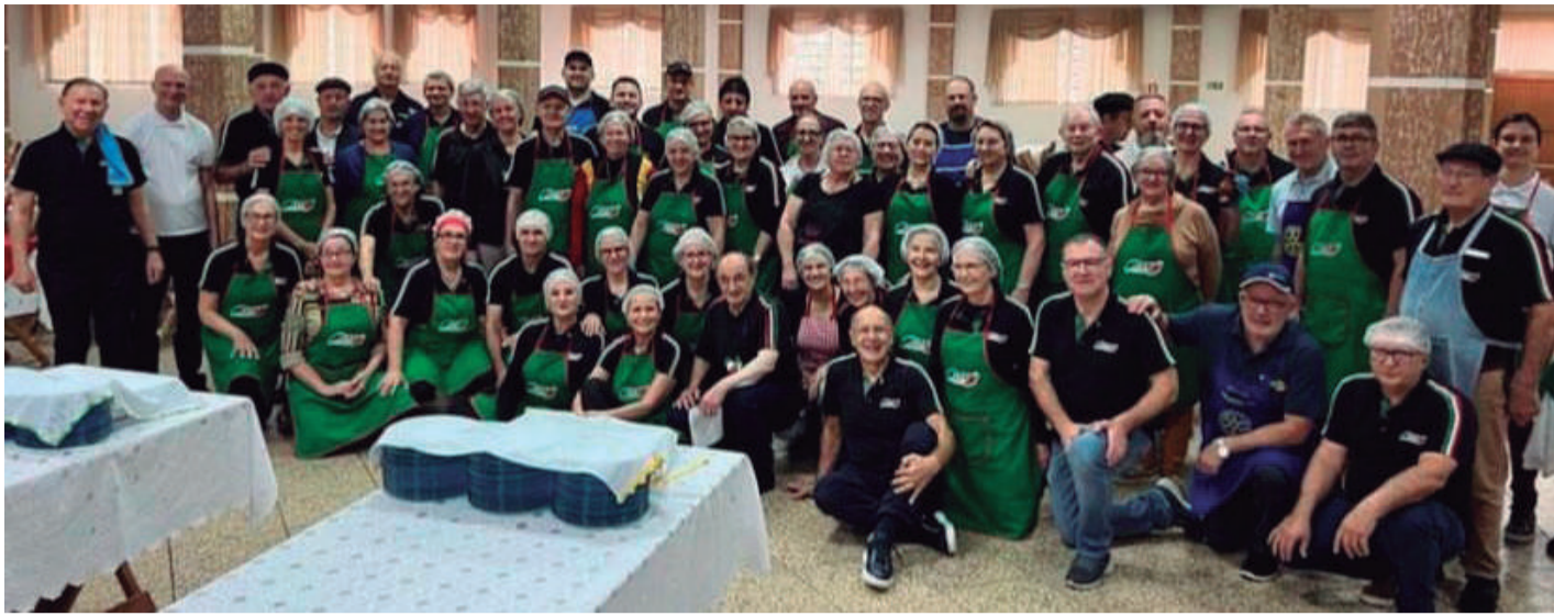
Pessoas maravilhosas! Equipe da ACITRE, responsável pelo almoço italiano, realizado no último domingo, dia 3, no Salão Paroquial Católico. Parabéns pelo almoço e pela união do grupo