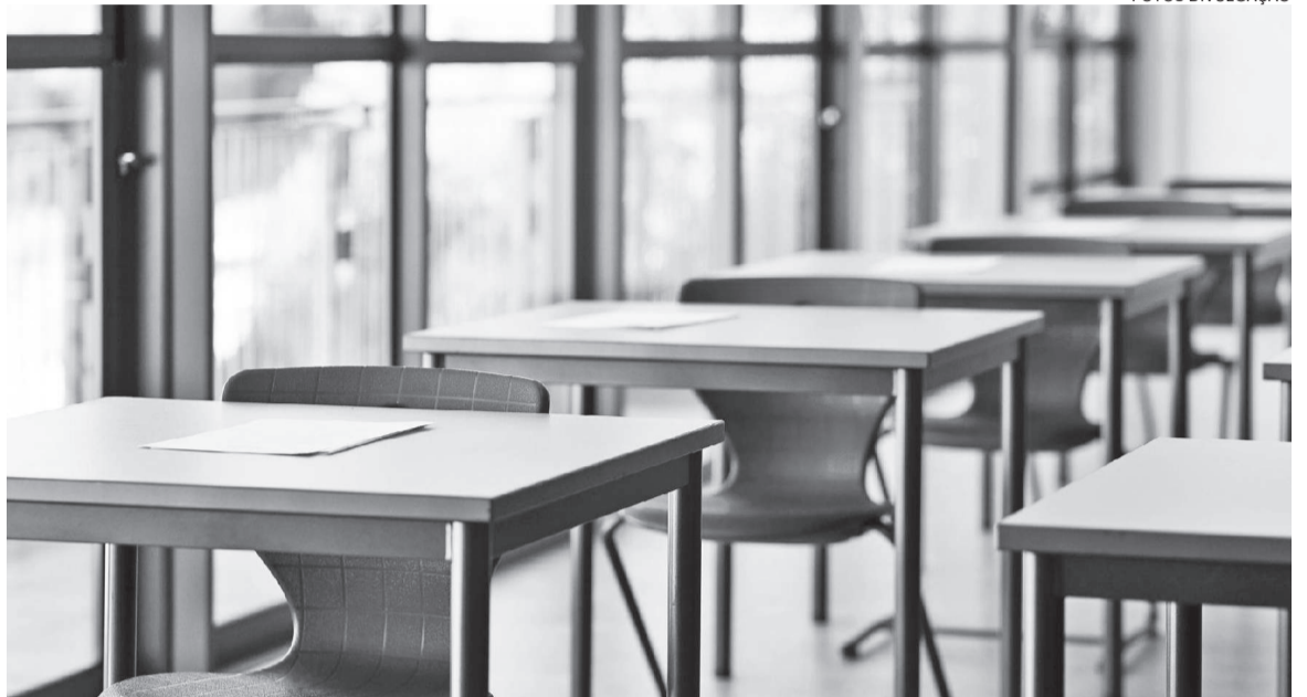
Em 2022, foram 193 atendimentos entre FICAI e Busca Ativa nas escolas municipais e estaduais de Três de Maio. No primeiro semestre de 2023 já são 37, número considerado alto, se considerado o fim da pandemia