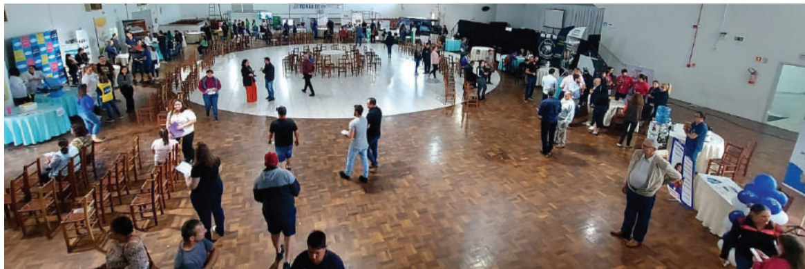
Cerca de 300 vagas foram disponibilizadas no 2º Feirão do Emprego de Três de Maio

Evento ocorreu do dia 17 e teve a participação de 80 empresas de forma presencial ou no Varal do Emprego