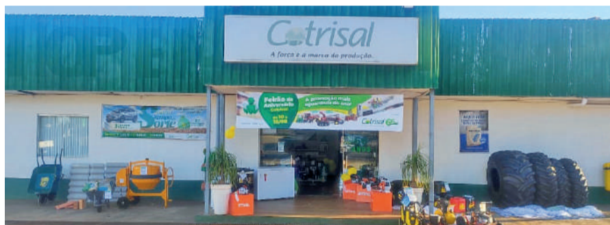
A unidade da Cotrisal em Três de Maio, fica ao lado do mercado da Cotrimaio

A Cotrisal tem 10.948 mil associados (até dezembro/2022). Em 2022, o faturamento foi de mais de R$ 3,5 milhões e uma sobra líquida de mais de R$ 190 milhões