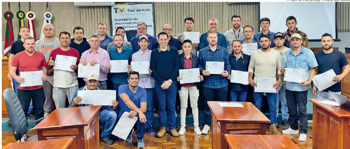
Formatura de 24 soldadores ocorreu na última terça-feira, na Câmara de Vereadores de Três de Maio

Estudantes integram terceira turma da ação promovida pela Secretaria de Desenvolvimento Econômico de Três de Maio