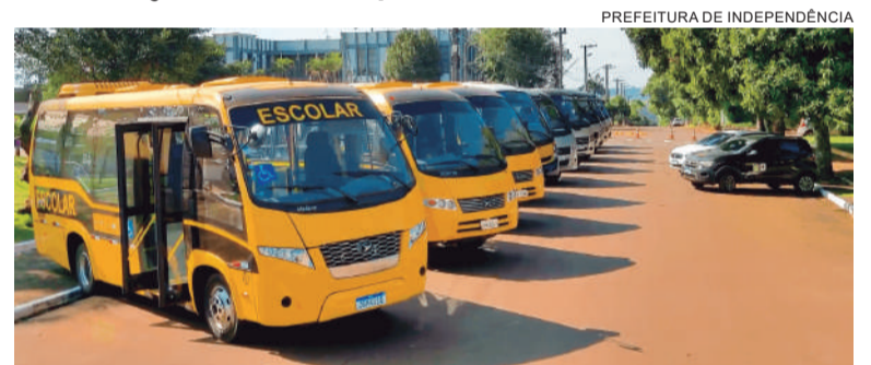
Frota que compõe o transporte escolar da SMECDT

Nos itinerários com crianças menores de 5 anos, além do motorista, há uma monitora que auxilia no embarque, acomodação e desembarque dos alunos