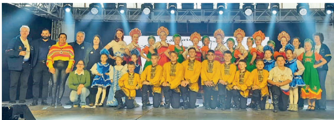
Grupo Folclórico Russo Troyka, de Campina das Missões