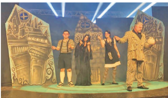
Teatro Luz e Cena, de Novo Hamburgo