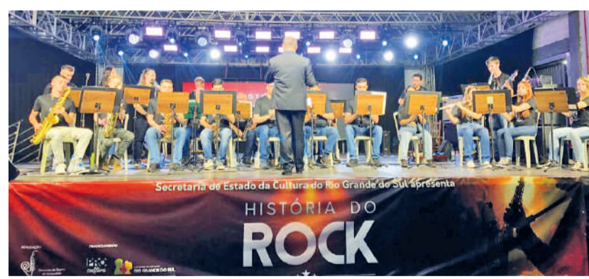
Orquestra de Sopros de Horizontina com o espetáculo uma viagem na história do rock