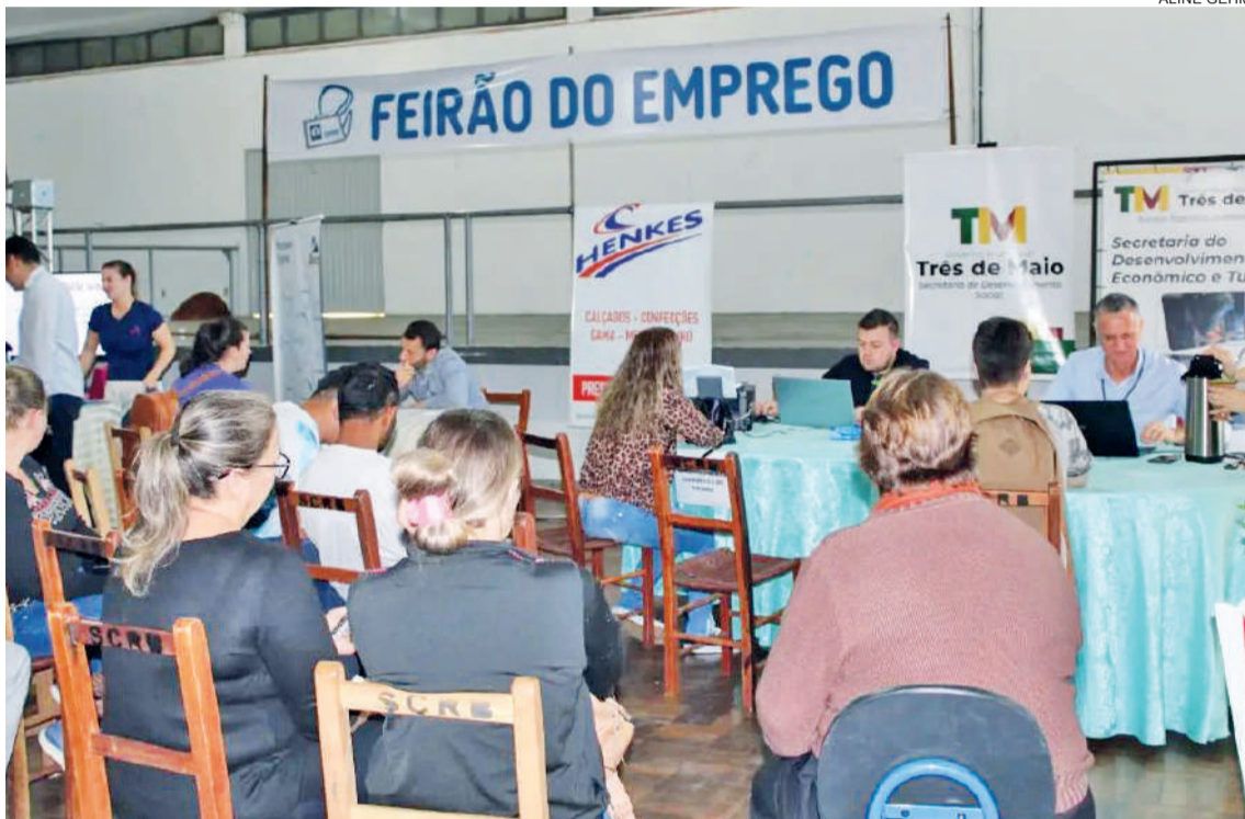
O Feirão do Emprego é uma excelente oportunidade de colocação no mercado de trabalho para o candidato em busca de uma vaga