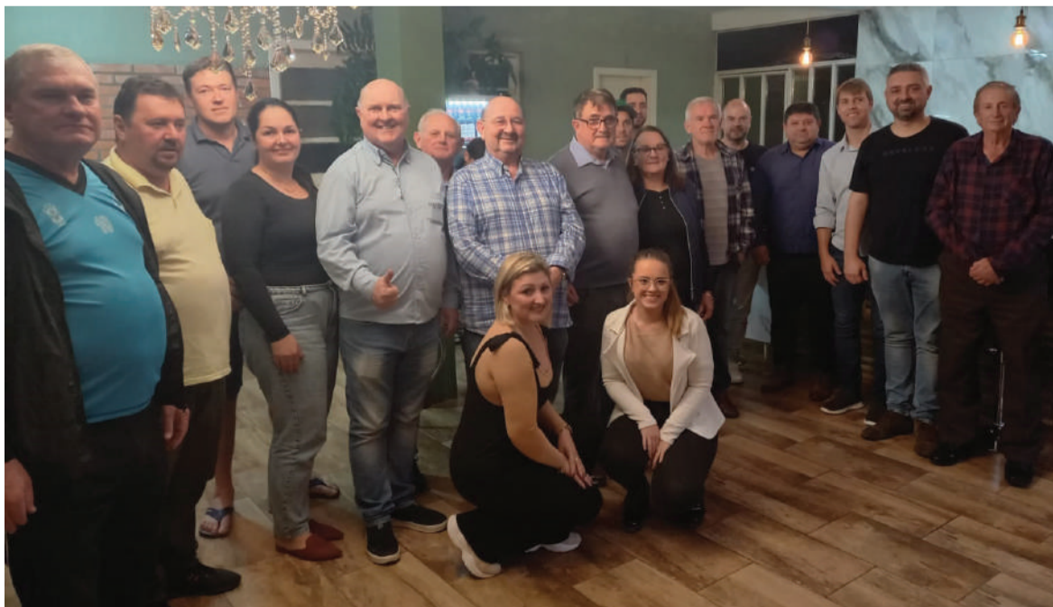
Membros da Comissão Provisória e simpatizantes do União Brasil