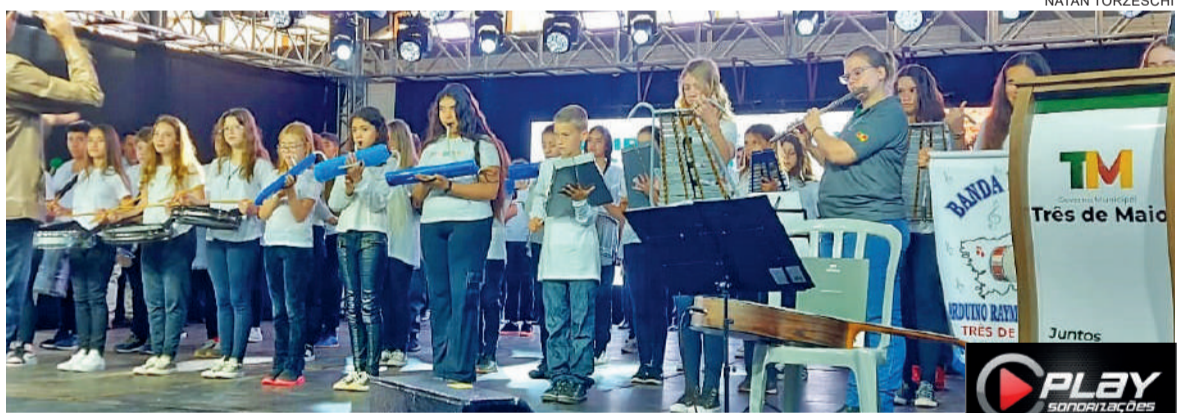
A Banda Municipal Arduíno Raymundo Dalsenter tocou o hino municipal de Três de Maio na abertura do evento