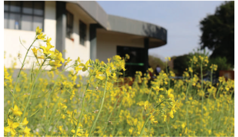
A canola é uma das culturas cultivadas na safra de inverno

Evento reunirá estudantes, pesquisadores e produtores rurais do Brasil, Uruguai, Argentina, Paraguai, além de palestrantes da Austrália