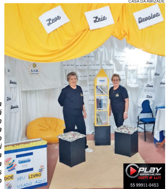
A Casa da Amizade está presente com a Biblioteca de Rua. No estande foi disponibilizada uma caixa para doações de livros para o projeto