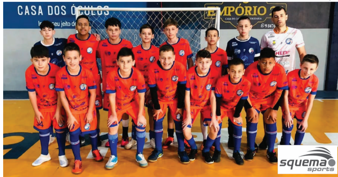
Liga Sicredi - equipe sub-13 Crednor Futsal

No domingo, no Ginásio da ABB jogaram Crednor Futsal X CMD Alegria . Todos os resultados foram positivos para a Crednor Futsal. Seguem os resultados: - Sub-9: 2X1; - Sub-11: 9X0; - Sub-13: 3X2; - Sub-15: 4X0.