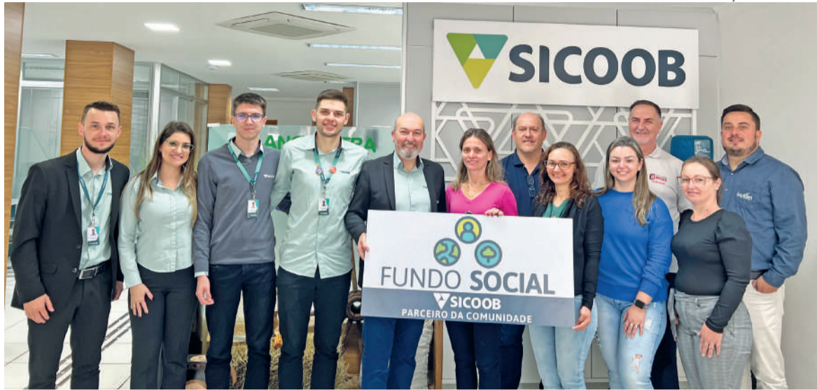
Fundo Social entregue para entidades de Três de Maio

O Sicoob apresentou, nos dias 31 de julho e 1º de agosto, os projetos que foram contemplados com recursos do Fundo Social nos municípios de Campo Novo, Braga, São Martinho, Três de Maio, São José do Inhacorá, Boa Vista do Buricá e Nova Candelária.