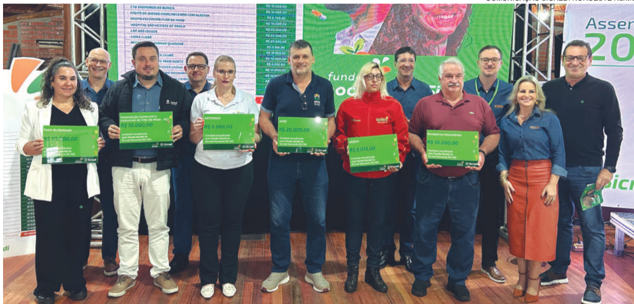
Representantes de entidades três-maienses receberam uma placa simbólica pelos recursos aprovados através do Fundo Social Sicredi. Valores variam de R$ 6 a R$ 20 mil