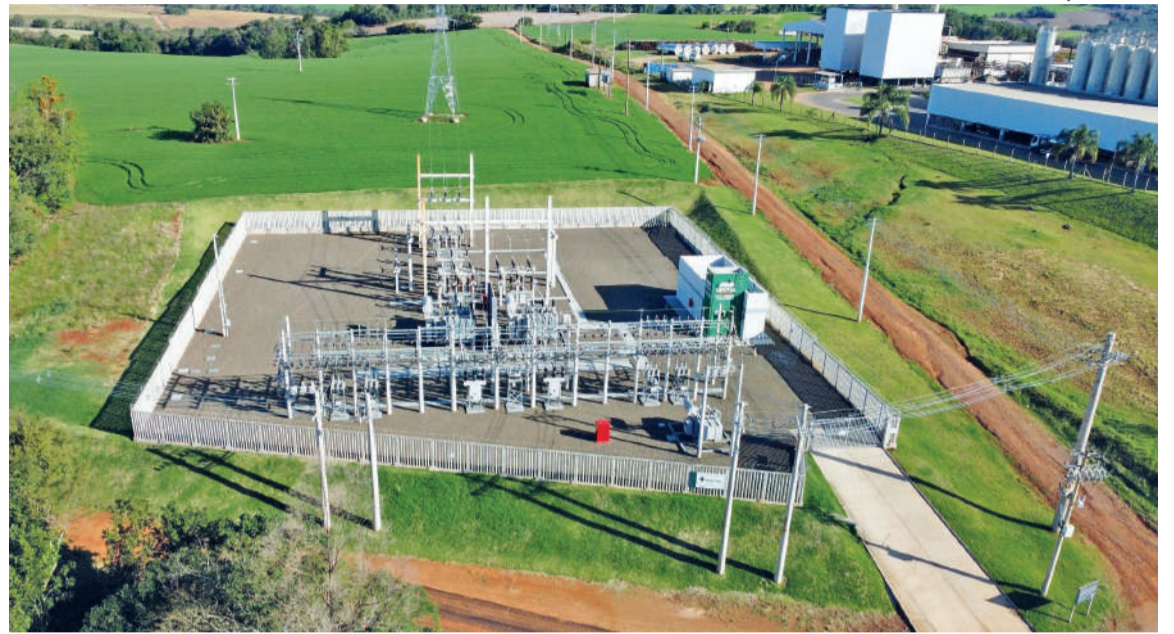
Subestação Nossa Senhora do Carmo - 69kV

Além dos investimentos, em 2022 a cooperativa migrou, juntamente com outras 3 cooperativas, para o ambiente de contratação livre, comprando parte da energia a custos menores, diretamente do mercado livre, daqueles praticados até então, quando a energia era adquirida