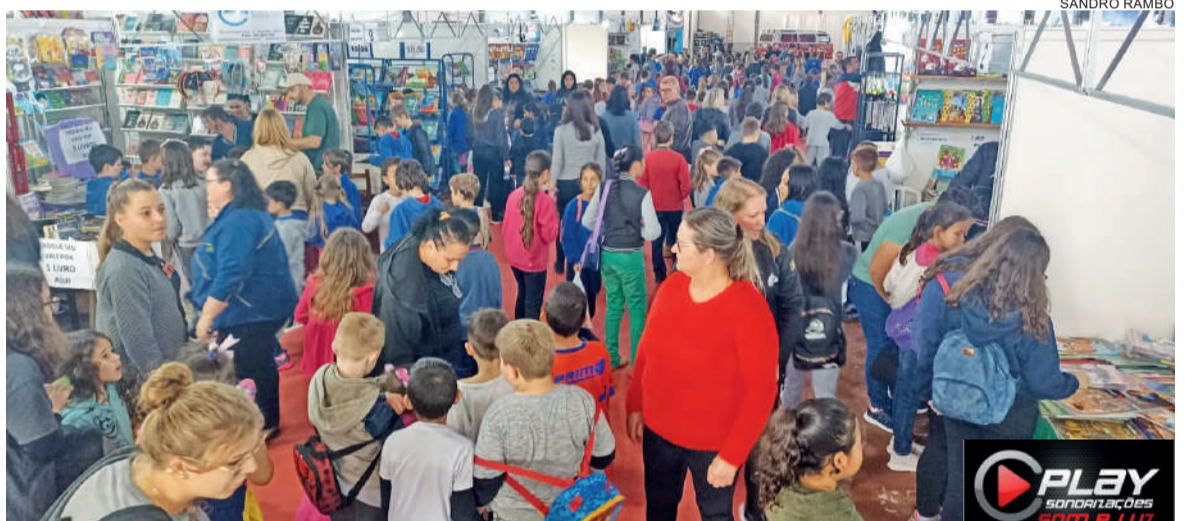
Obras literárias dos mais diversos gêneros estão à disposição do público, na maioria formado por estudantes