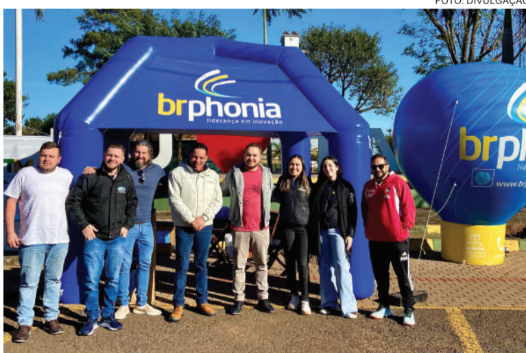
Ação promovida pela Brphonia Telecom arrecadou alimentos e agasalhos. Doações foram encaminhadas à Secretaria de Desenvolvimento Social, que irá destinar os materiais