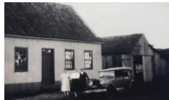
Primeira igreja foi construída em 1927, na Rua Horizontina