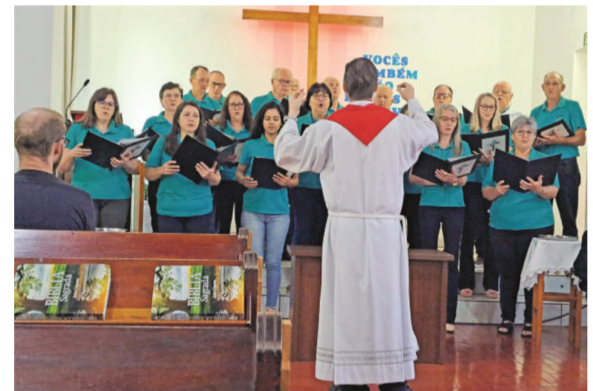
Coral, banda e grupo de violões abrilhantaram o culto festivo