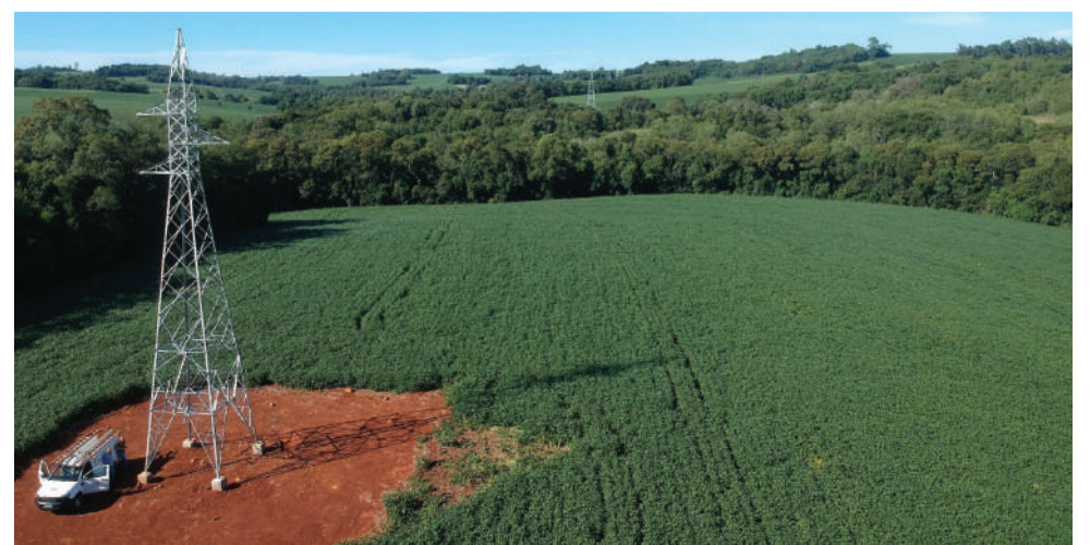
Redes de transmissão