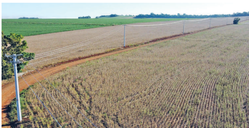
Redes de transmissão