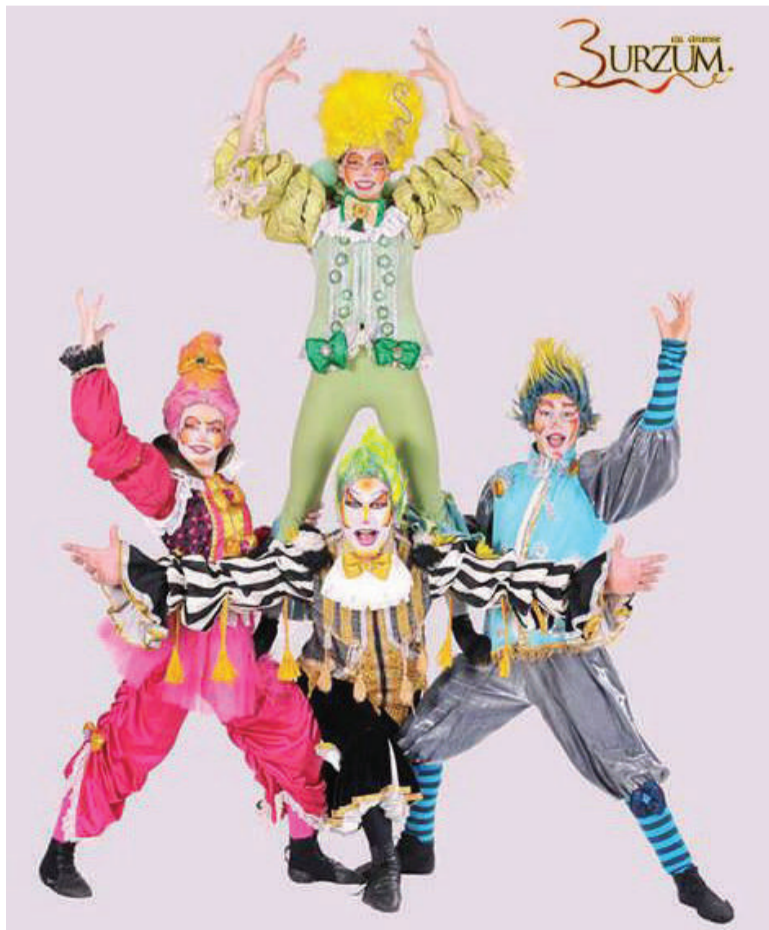
Teatros e espetáculos de dança e música farão parte da programação da feira

- Quinta-Feira: às 8h, às 9h30 e às 19h: ‘Família Susto S/A’ E DA às 14h e às 15h30: ‘Abra a boca e feche os olhos’