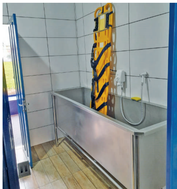
Construção da sala de assepsia auxiliará no uso dos equipamentos da corporação, que serão higienizados de maneira mais segura