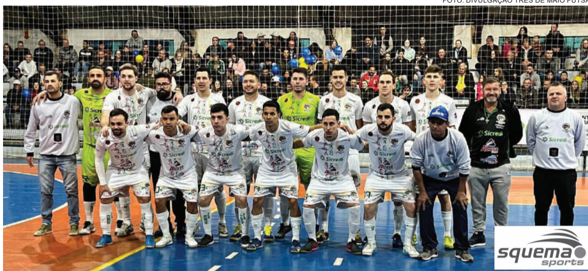
Equipe três-maiense está na quarta colocação no Gauchão de Futsal Sicredi Série C 2023