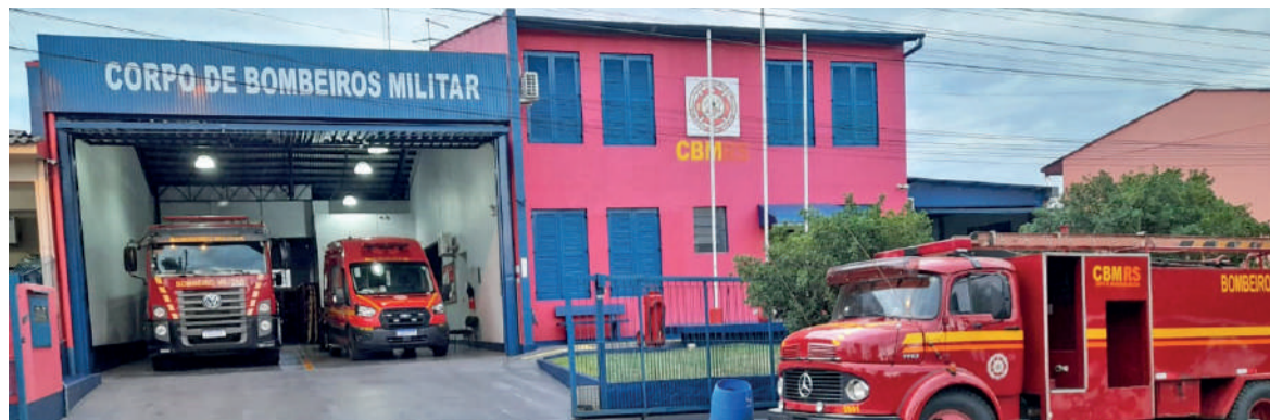
Melhorias na estrutura do Corpo de Bombeiros foram viabilizadas por recursos públicos e doações de empresários locais