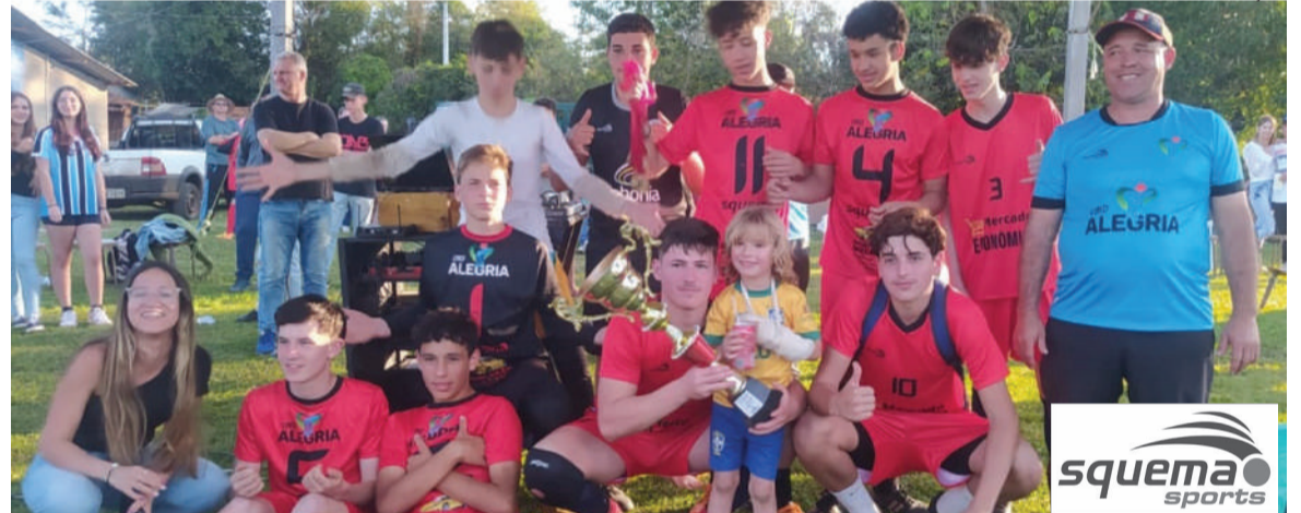
Equipe campeã na categoria sub-15: CMD Alegria