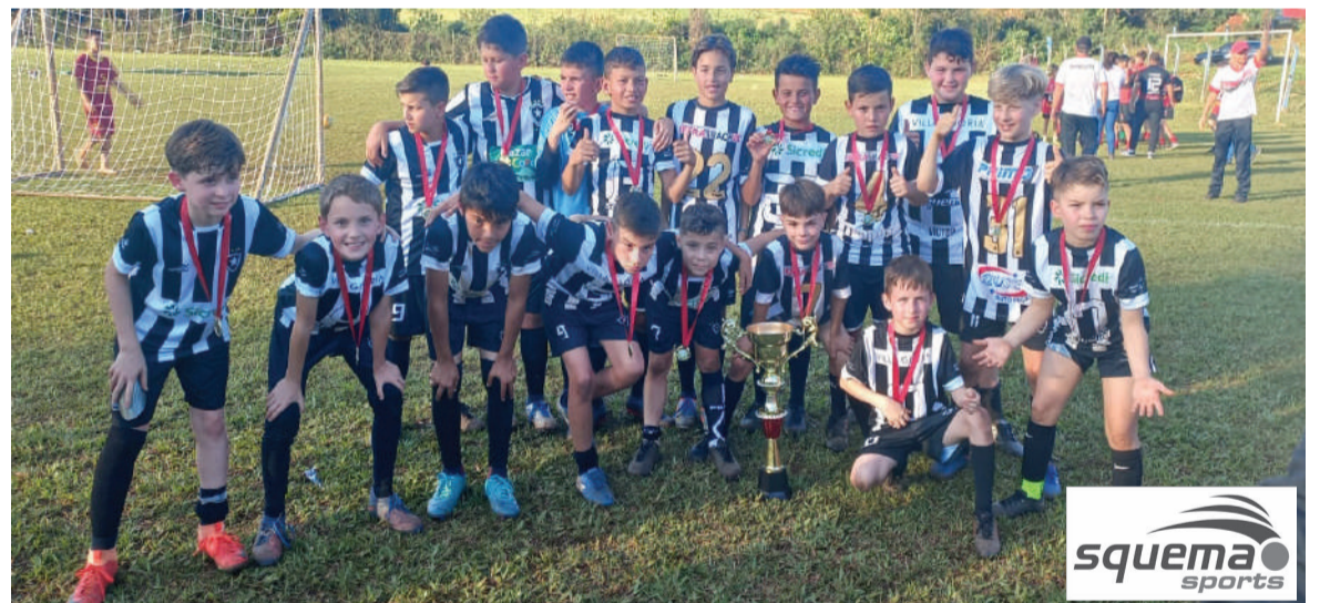
Equipe campeã na categoria sub-11: Botafogo Três de Maio