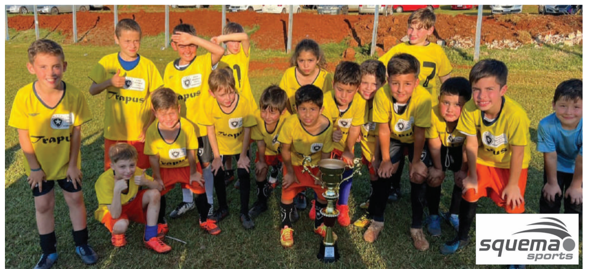
Equipe campeã na categoria sub-9: Botafogo Três de Maio