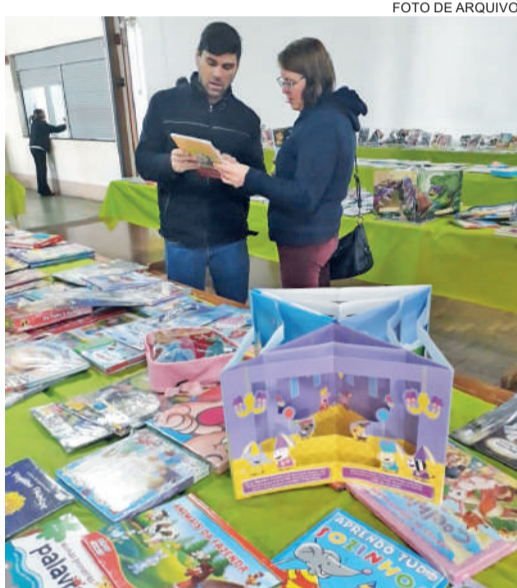
Comunidade três-maiense voltará a prestigiar uma feira do livro, após três anos do último evento do tipo

De terça-feira, dia 9, até o sábado, 12, Três de Maio viverá um evento voltado à cultura. Realizada no Parque de Exposições Germano Dockhorn, a 1ª Feira Literária e Cultural terá diversas atrações. Além das 11 bancas de livros com os mais diversos gêneros literários, serão realizadas atividades culturais, apresentações de grupos de dança, música, teatro, grupos étnicos, oficinas, teatro, contação de história, entre outros. O evento, inédito, tem entrada gratuita / 3 e 5