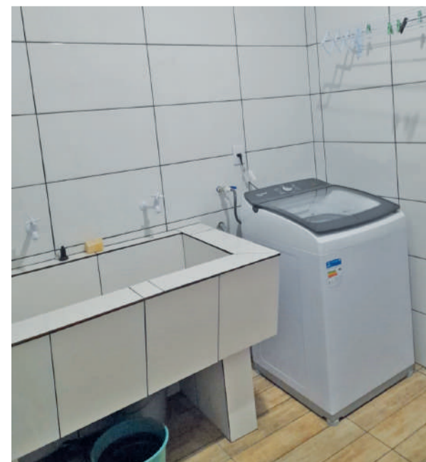
Recursos de municípios da região viabilizaram a reforma da lavanderia