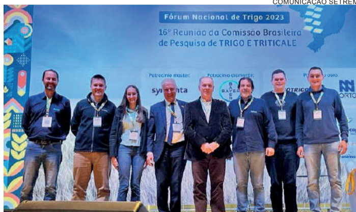
Professores e acadêmicos da Setrem participaram de evento em Guarapuava, interior do Paraná