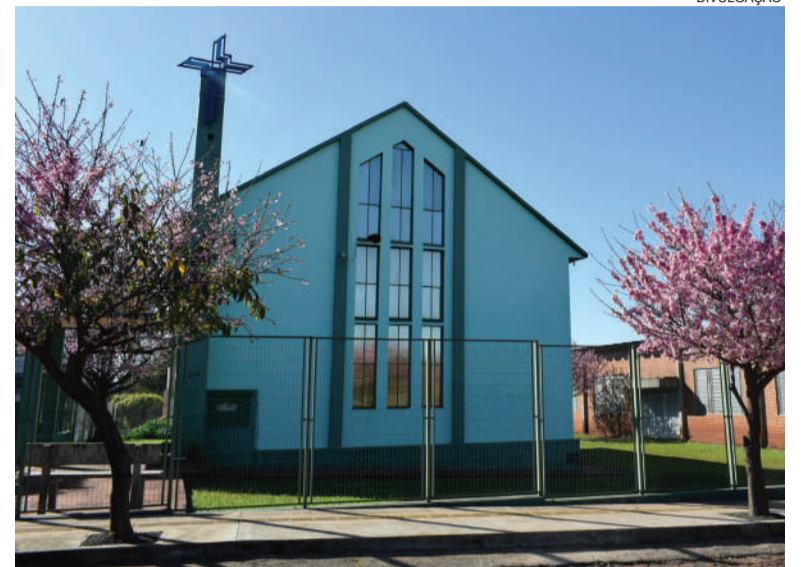
Igreja está localizada na Rua Planalto, 268, na esquina com a Rua Frederico Krebsler

Programação inicia com culto festivo, a partir das 9h