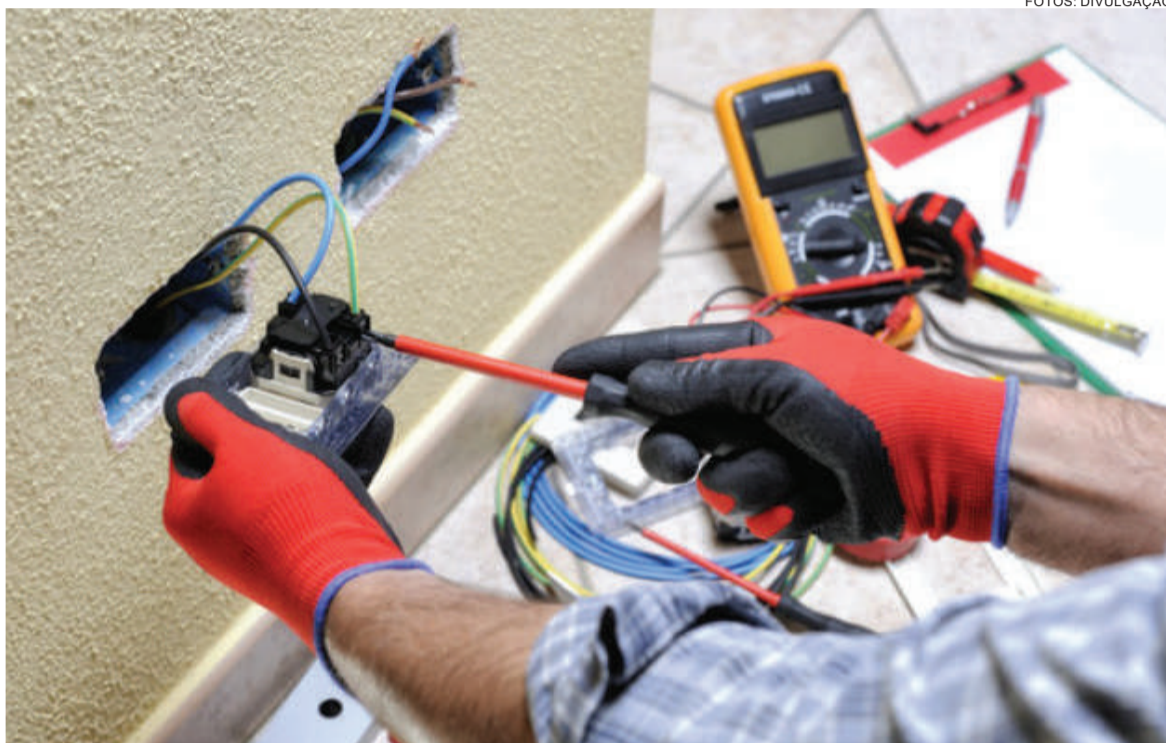
O setor de serviços apresentou o maior saldo positivo no primeiro semestre de 2023. Também é o único que não registrou nenhum mês com saldo negativo ao longo dos seis primeiros meses do ano

Ainda, há um trabalho da entidade, juntamente com o Sindicato de Três de Maio, no sentido de fomentar qualificação profissional que atendam as demandas do município. “Nós fazemos uma