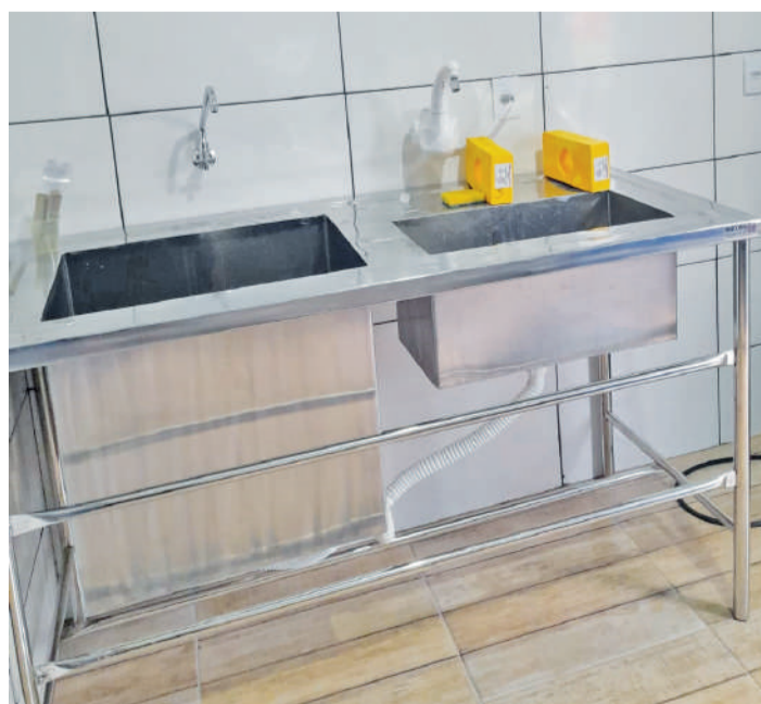
Cubas de aço inox e porta metálica foram adquiridas com recursos da Câmara de Vereadores de Três de Maio