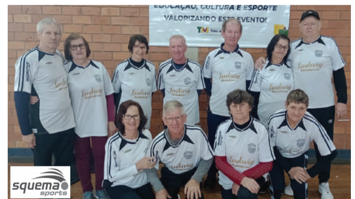
Equipe Esperança de Boa Vista do Buricá, vice campeã