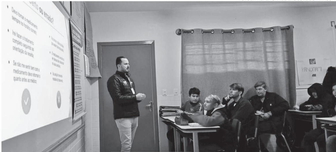
Farmacêuticos realizaram ação nas escolas do município pela Campanha Farmácia vai à Escola