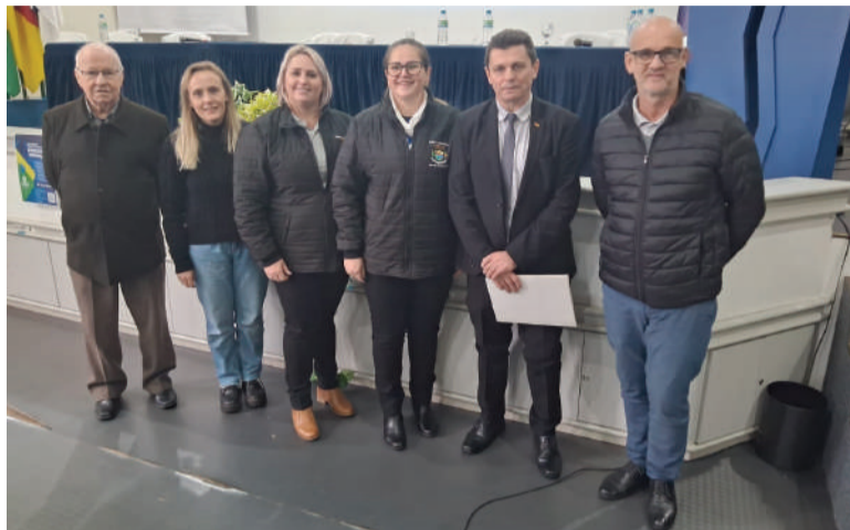
Vereadores e servidoras da Câmara de São José do Inhacorá participaram de evento em Frederico Westphalen

Evento foi realizado em Frederico Westphalen