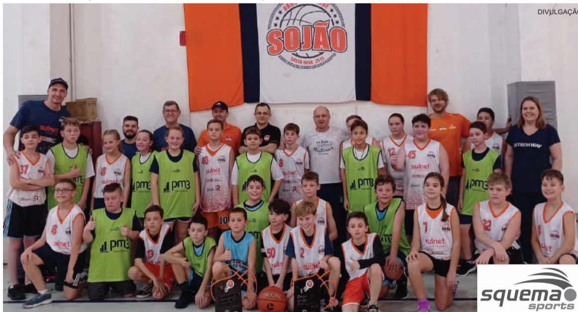
A Escola Setrem participou do evento com as categorias sub-8, sub-10, sub-12, sub-14 e sub-16, nos naipes feminino e masculino