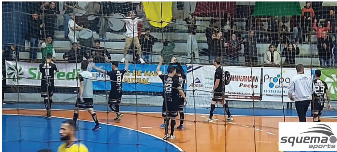
Jogadores de Três de Maio Futsal comemoram resultado com a torcida ao final da partida