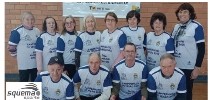
Equipe Esperança de Boa Vista do Buricá, terceiro lugar