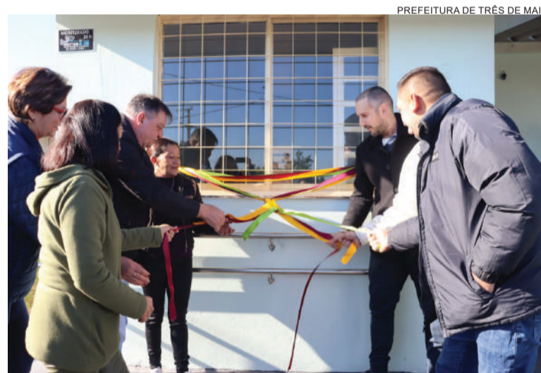
Equipe de Atenção Primária no Bairro Santa Maria deverá atender cerca de 800 moradores do Bairro Santa Maria e Menino Deus