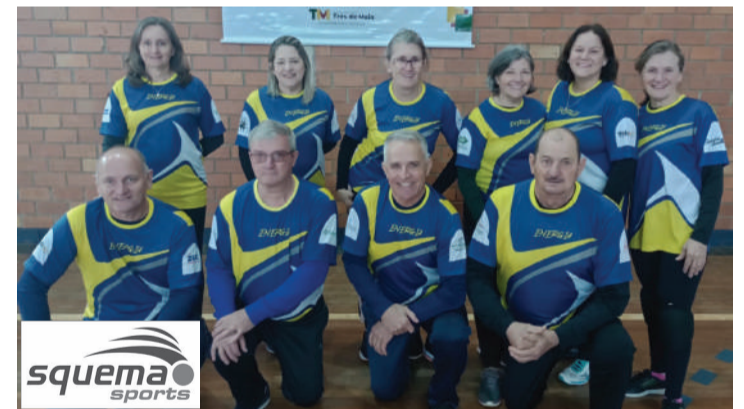
Equipe Energia Santa Rosa, campeã do 1º Torneio Municipal de Câmbio

Participaram as equipes Saber Viver, de Três de Maio; Grupo Energia Santa Rosa A; Grupo Energia Santa Rosa B; Grupo Madeireira Boa Vista e Grupo Esperança, de Boa Vista do Buricá. Confira os campeões: